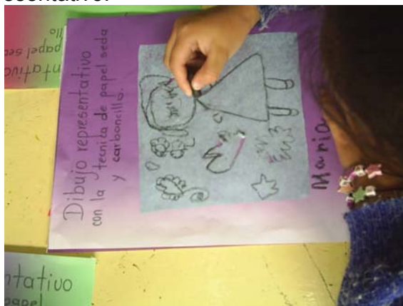
Foto 2. Dibujo Representativo.