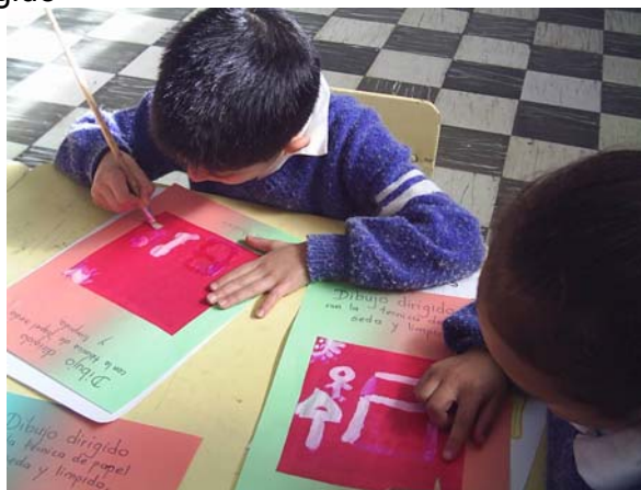
Foto 4. Dibujo Dirigido

5.2.2 Actividades pedagógicas donde promueven el dibujo. En la Institución las actividades pedagógicas se desarrollan de acuerdo al currículo de preescolar con los lineamientos del Ministerio de Educación Nacional donde se consideran como tales a los períodos en que se desarrolla la jornada de trabajo, denominados así: