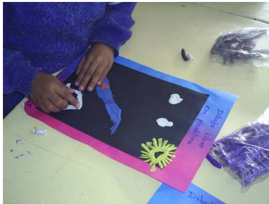
Foto 1. Dibujo Libre.