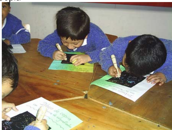
Foto 3. Dibujo de Copia

- Dibujo Dirigido. El currículo de preescolar 1987, lo propone como una actividad donde la maestra lo va dirigiendo por pasos y a la vez supervisa la realización en forma homogénea, obteniendo dibujos similares.