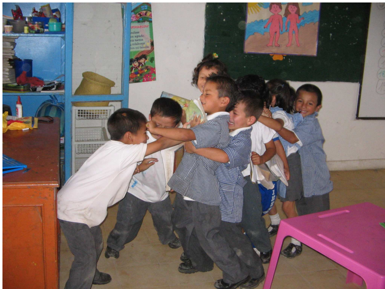
Foto No 7. “En varias ocasiones la actitud de los niños fue de desobediencia e impulsividad”

En un menor número de estudiantes están demostradas otras conductas como la desatención, susceptibilidad, inasistencia, impuntualidad, descuido de sus pertenencias, aislamiento, temor de presentarse en público, poco comunicativos, pasivos, nerviosos, aislados, frustrados y tristes. De las conductas específicas registradas en el diario de campo se encuentran: