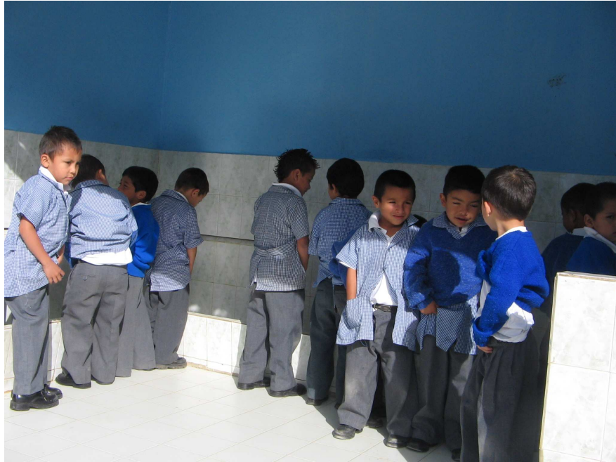
Foto No 14. “Los niños van al baño, y se ubican de tal manera que no interfieran la actividad del otro”