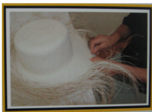
Foto No 6. PRODUCTOS ARTESANALES SANDONEÑOS