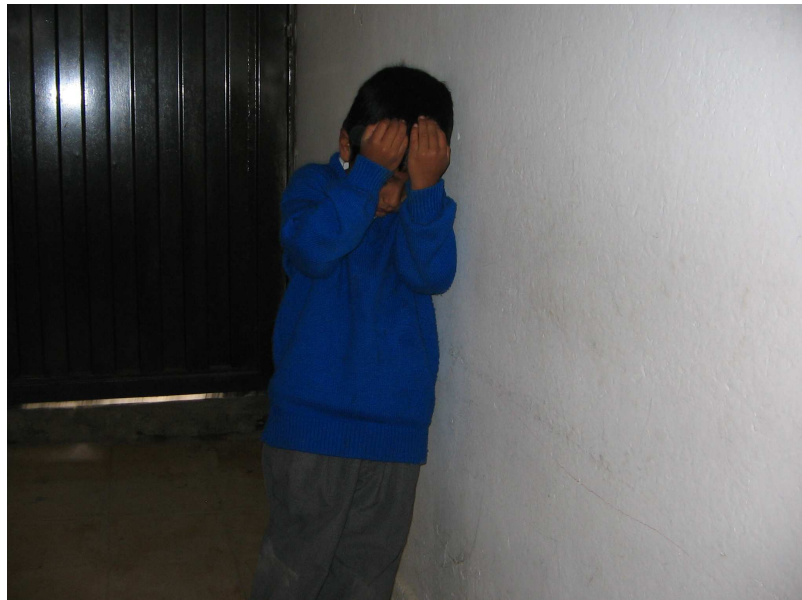
Foto No 9. “ Demostración de capricho por situaciones especiales ante la profesora o compañeros, lo que dificulta el normal desarrollo de las actividades escolares ”.