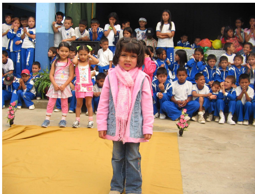
Foto No 13. “La niña participa en un concurso de modelaje donde demuestra tranquilidad y seguridad”