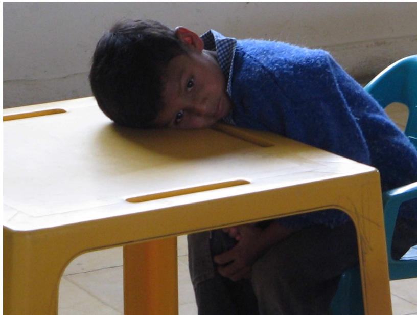
Foto No 10. “El niño se mostró triste, callado, silencioso, ausente y estuvo ajeno a lo que le acontecía en el momento, parecía no estar en el lugar, reaccionó cuando la profesora lo llamó por su nombre”