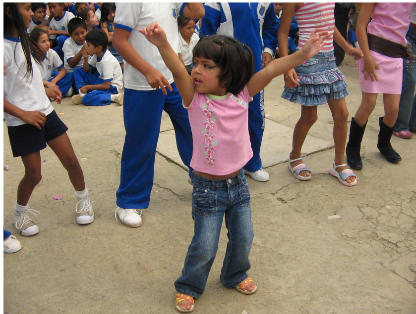
Foto No 11. “La niña se presenta ante un público, demostrando sus aptitudes artísticas”

Sin embargo como en todo grupo heterogéneo también existen niños que tienen manifestaciones y comportamientos apropiados que dejan ver que su desarrollo socioafectivo está bien encausado, lo que está demostrado en las siguientes evidencias: