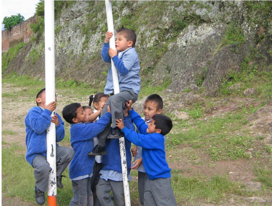
Foto No 12. “Los niños cooperan y unen fuerzas para alcanzar un objetivo, en este caso ayudar al compañero para que se impulse y alcance el borde superior del marco”