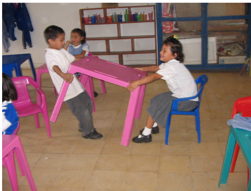
Foto No 8. “Dos niños, al llegar al salón y al ubicarse en la mesa de trabajo, el uno empuja a la otra que cae, se levanta e inicia el forcejeo de la mesa, además la agrede verbalmente con expresiones como: tonta, guagua, fea y la cogí primero”