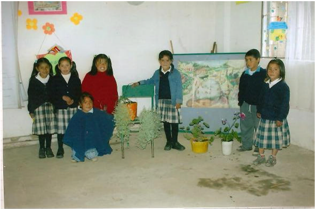
Figura N° 4. Manzanilla