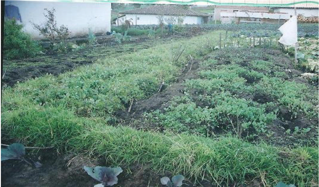
Figura N° 10. Hortalizas