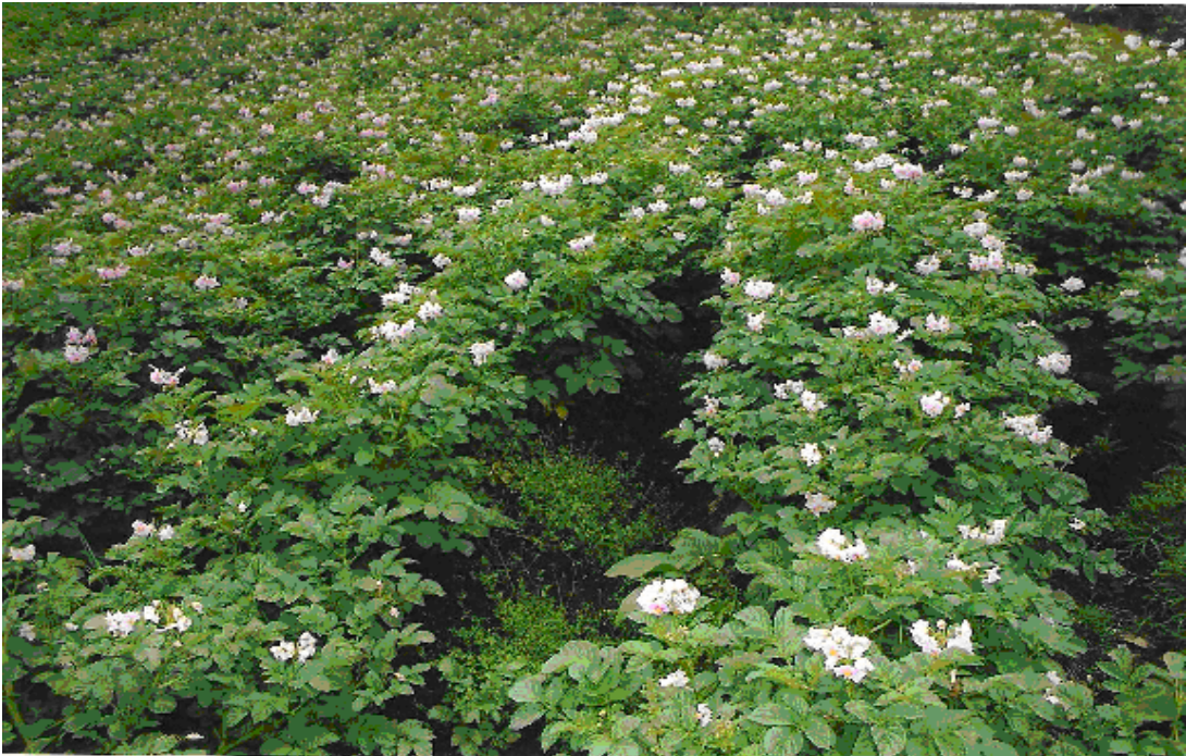
Figura N° 12. La cosecha de papa