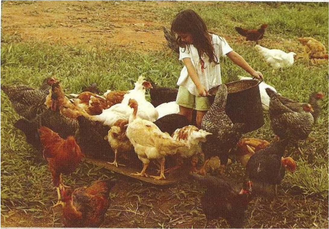
Figura N° 6. Niños trabajando