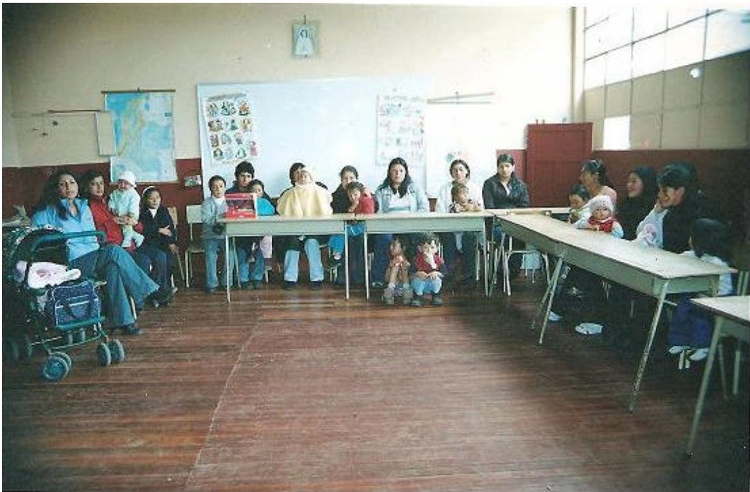
Figura N° 8. Reunión de padres de Familia