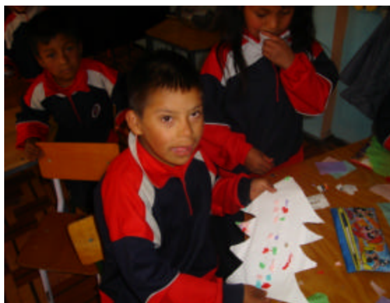
Figura 6. Integración

“Es importante para estos niños integrarse porque no se va a sentir rechazado”