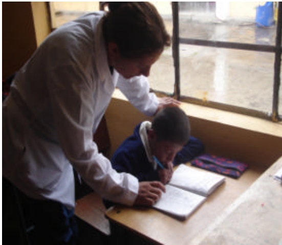
Figura 2. Problemas generales de aprendizaje

“Los niños requieren mayor tiempo de dedicación y metodologías apropiadas para el aprendizaje”.