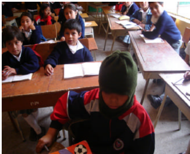
Figura 4. Niños y Niños con N.E.E integrados en el aula regular

“Sus aptitudes y comportamientos demostrados afectan las relaciones dentro del aula”.