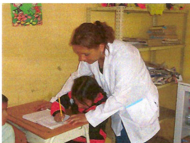
Figura 5. “Los niños con cualquier dificultad deben ser bien tratados, merecen lo mejor y las relaciones con el docente deben ser amistosas”

El primer gestor para que el niño con necesidad educativa especial se sienta bien en el aula y aprenda a relacionarse, es el docente; así lo manifiestan cuando dicen que: “los niños con cualquier dificultad deben ser bien tratados, merecen lo mejor y las relaciones con el docente deben ser amistosas”, la interrelación lograda por el docente con estos niños contribuirá en la aceptación por parte del resto de compañeros del grupo, promoviendo la ayuda, colaboración y tolerancia para sacar adelante a estos niños.