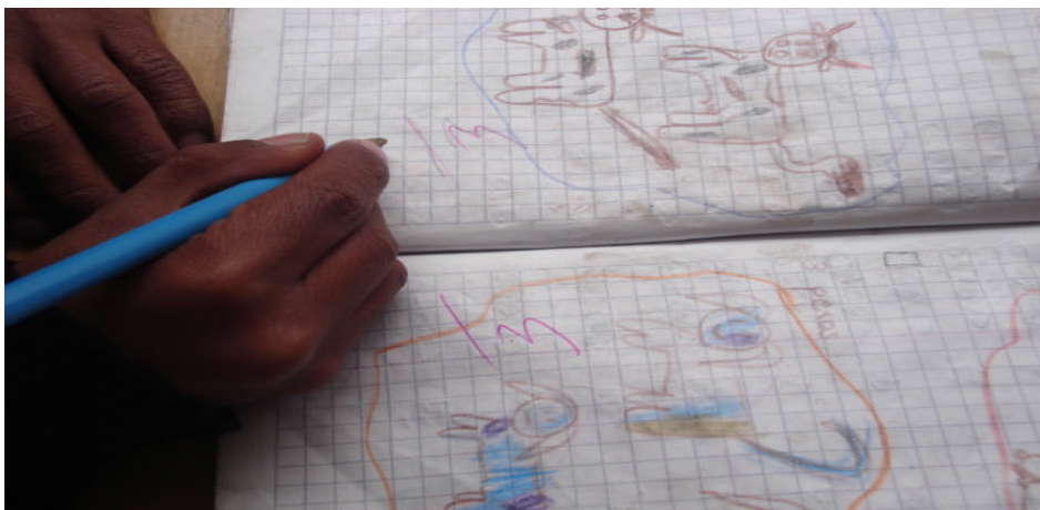
Figura 3. Son muy lentos para terminar sus diferentes actividades afectando su rendimiento

De igual manera el niño necesita de estimulación constante por parte del docente para mantener vivo su interés y así pueda desarrollar sus habilidades, potencialidades y conocimientos en un determinado grado y ritmo de aprendizaje, por cuanto es contraproducente la segregación por parte del docente repercutiendo en el desinterés y apatía del niño frente a las actividades escolares, de ahí que algunos docentes expresan que: “algunos niños son incapaces de concentrarse en la realización de sus tareas porque tardan largo tiempo en desarrollarlas y con frecuencia pasan de una tarea a otra sin concluir la anterior demostrando desinterés por el trabajo en el aula.