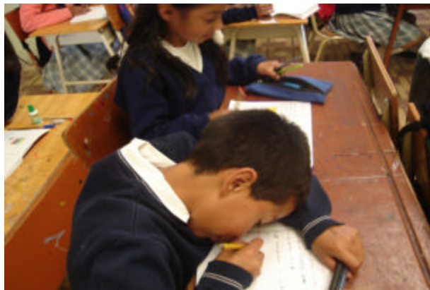
Figura 1. Falta de capacitación docente en la atención pedagógica

“Las dificultades de algunos niños son muy notorias por el trabajo realizado en clase”.