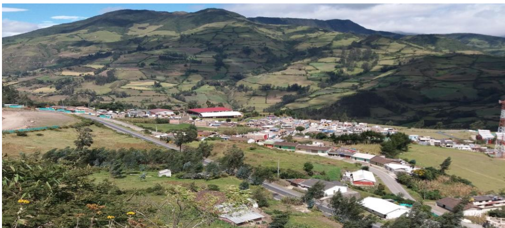
Figura 1: Corregimiento de Obonuco