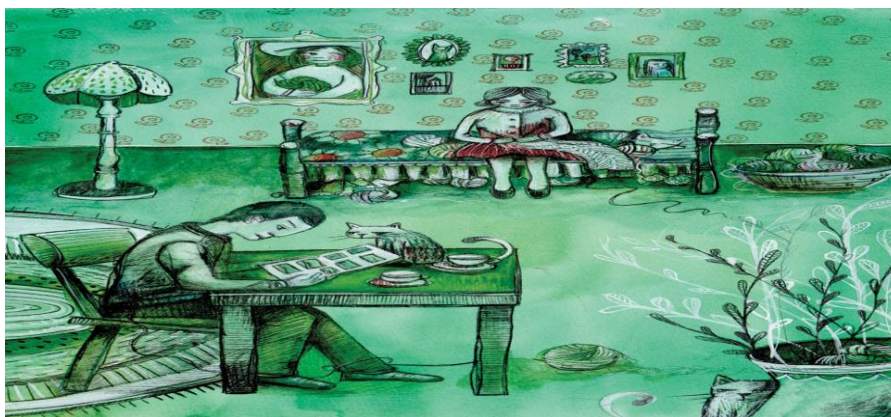
Imagen 2 Casa tomada