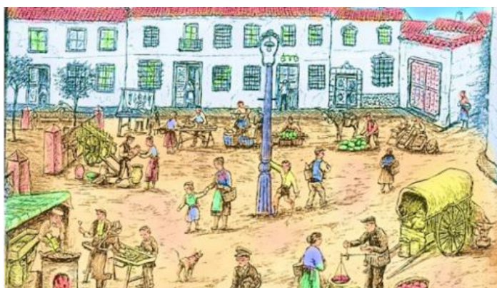
Imagen 2: pueblo antiguo