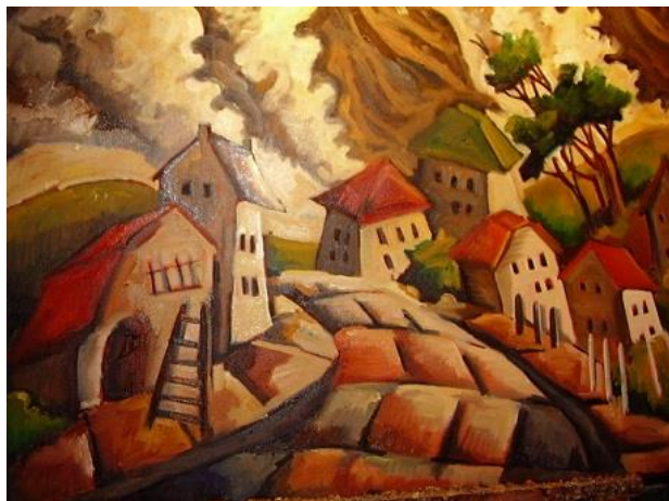
Imagen 1: algo grave va a suceder en este pueblo