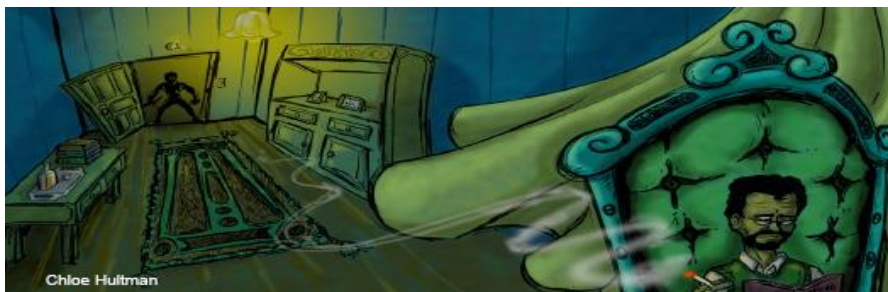
Imagen 1 Continuidad en los parques