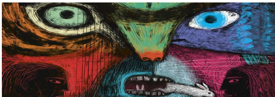
Imagen 1 Bestiario