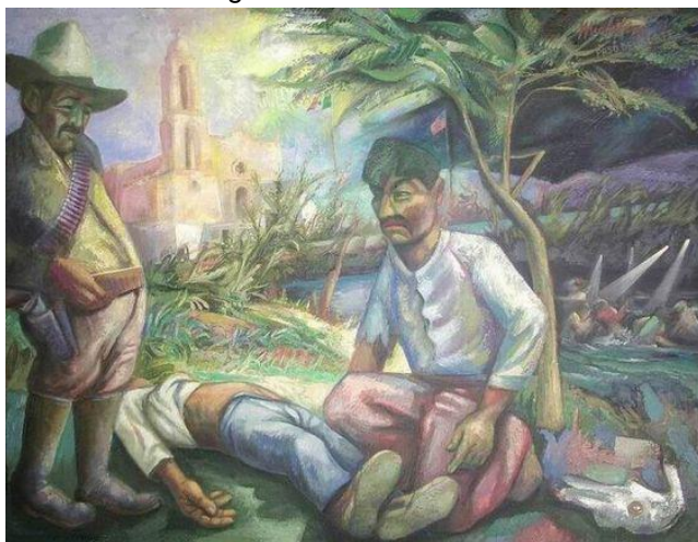
Imagen 2 Aventura

Observa con mucha atención la imagen 2, inventa una historia en la que narres una aventura de los personajes que se miran en la imagen. De la misma manera, observa con mucha atención la imagen 3 e imagina que vas caminando por ese lugar desolado y recrea una historia.