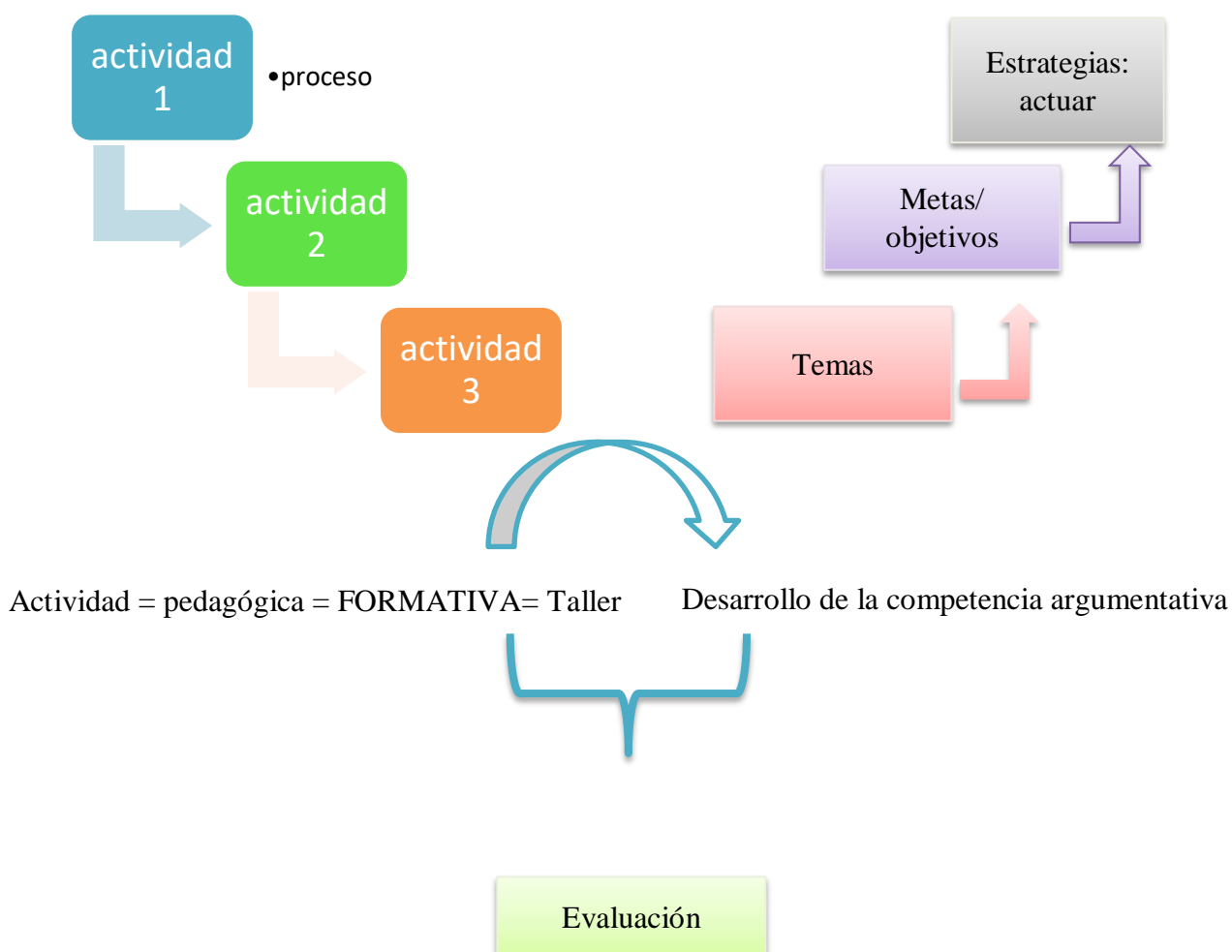
Figura 2. Procesos evaluativos

El trabajo que se desarrolla dentro del aula de clases, pues genera en los estudiantes un ambiente agradable, placentero y dinámico encaminado a potencializar sus capacidades argumentativas y fomentar las habilidades de participación oral. En este sentido, la argumentación asume un papel importante en el diseño de la propuesta, dado que ésta característica fundamenta las relaciones de colectividad, criticidad, y fundamentalmente, la participación activa y dinámica de sus conocimientos.