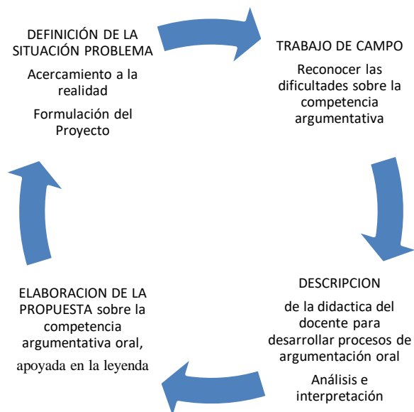
Figura 1: proceso de investigación .