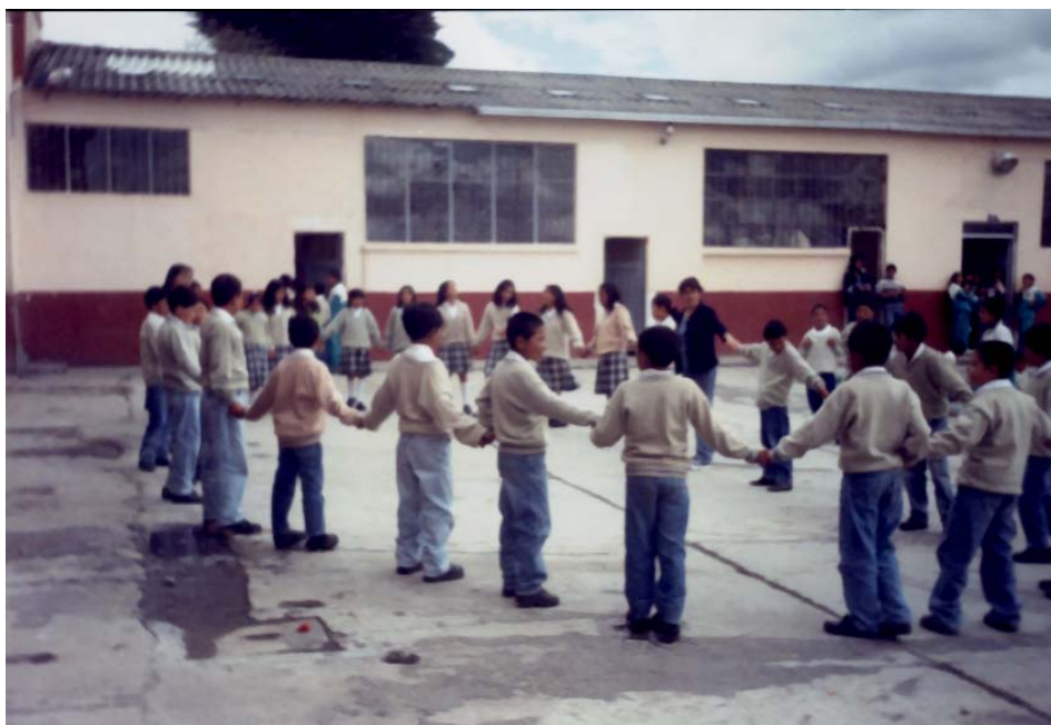
Fig. No. 5. RELACIONANDOME CON LOS DEMAS