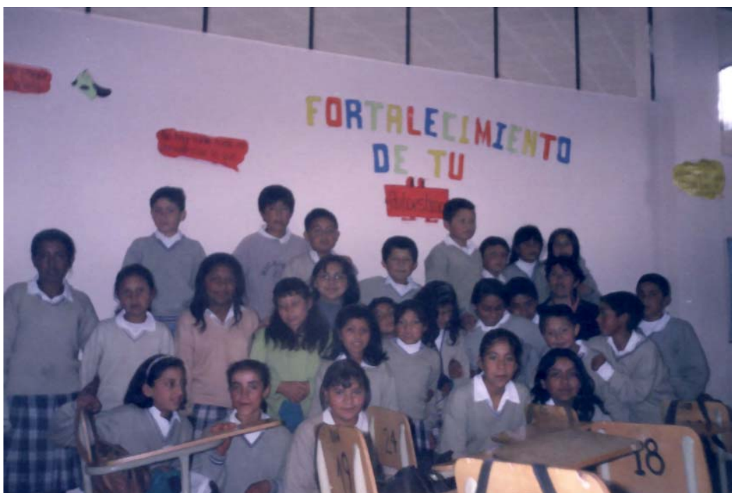
Fig. No. 1. ESTUDIANTES GRADO QUINTO