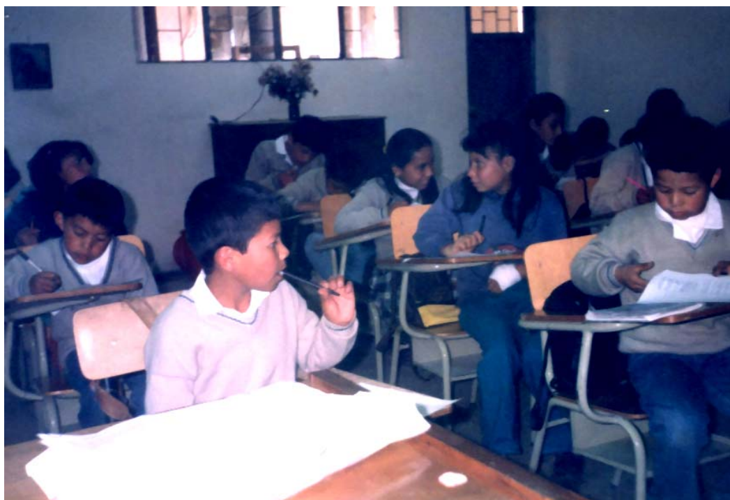
Fig. No. 2. DESARROLLO DE CUESTIONARIOS (PRE-TEST)

En la aplicación del cuestionario (pre-test) se presentaron vacíos y dificultades comunes en niños y niñas, lo que permitieron establecer cuáles son los principales problemas que afectan la autoestima como son: