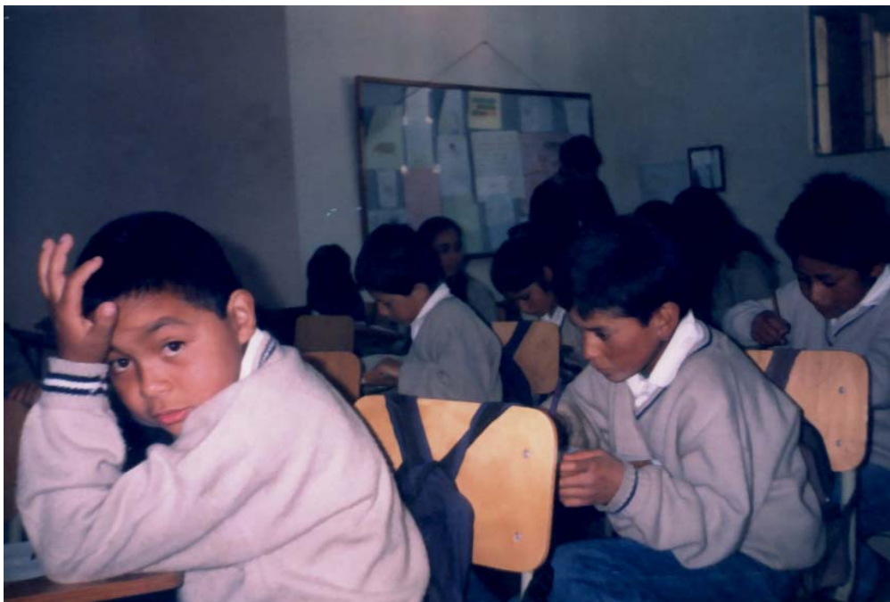
Fig. No. 3. DESARROLLO CUESTIONARIO POST-TEST

Para entender los resultados obtenidos en la aplicación del post-test se aplicó el mismo método de análisis estadístico del pre-test, cuyos resultados se expresan teniendo en cuenta la variable dependiente, resultados de las pruebas pre-test - post-test.