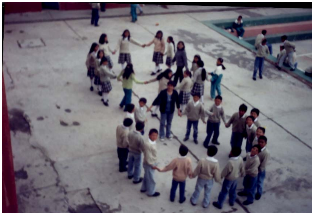
Fig. No. 6. MI IMAGEN CORPORAL