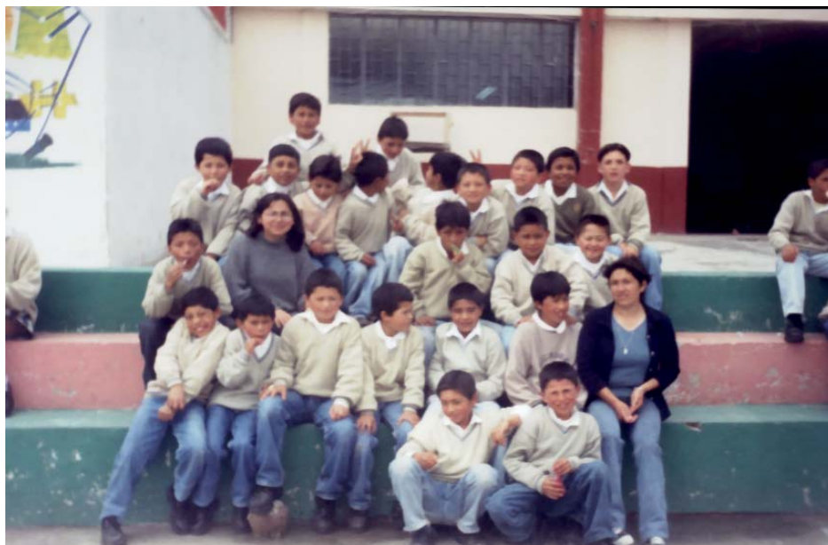
Fig. No. 4. RESULTADOS DE APLICACIÓN DE TALLERES