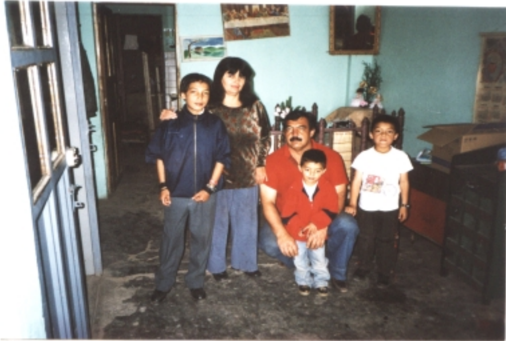
Figura 4. La Familia “Donde se tejen los verdaderos valores”.