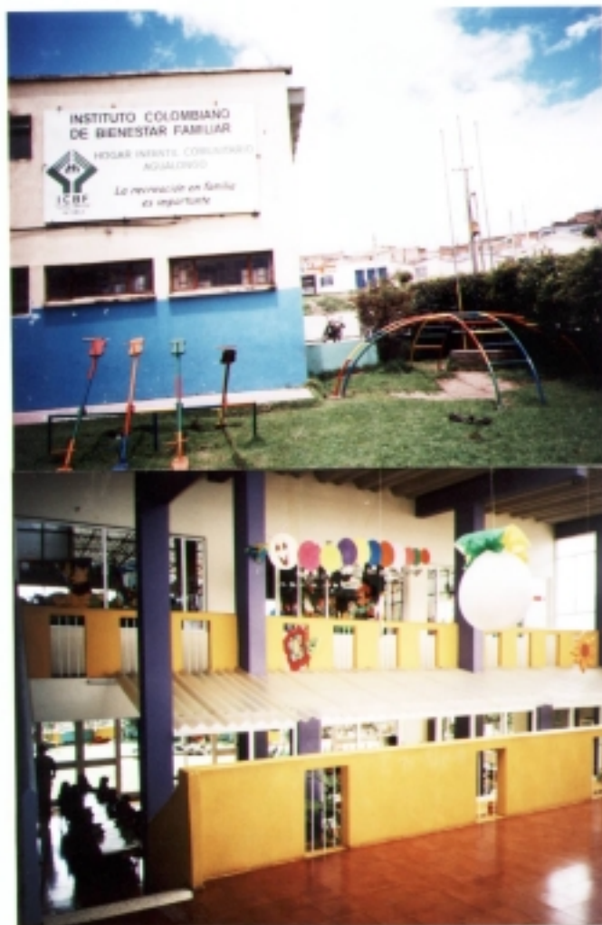
Figura 1. Hogar Infantil Comunitario Agualongo