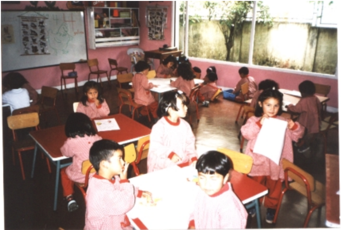
Figura 3. Visión.

El Hogar Infantil liderará procesos de desarrollo humano, para formar personas reflexivas, sensibles e inteligentes desde sus primeros años de vida, brindando oportunidades para el fortalecimiento de la unidad familiar, la solidaridad y el progreso de la comunidad en general.