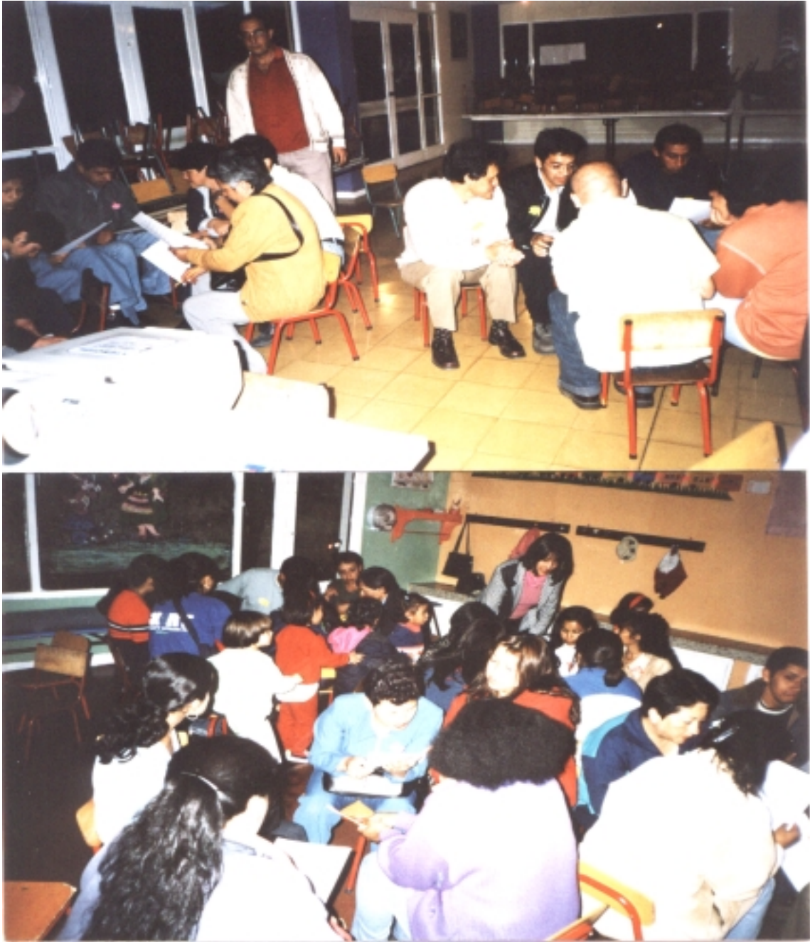
Figura 6. Calidad de tiempo