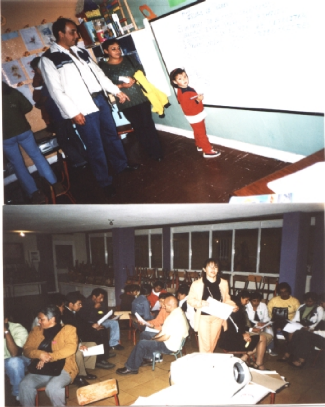
Figura 9. Escuela de Padres.