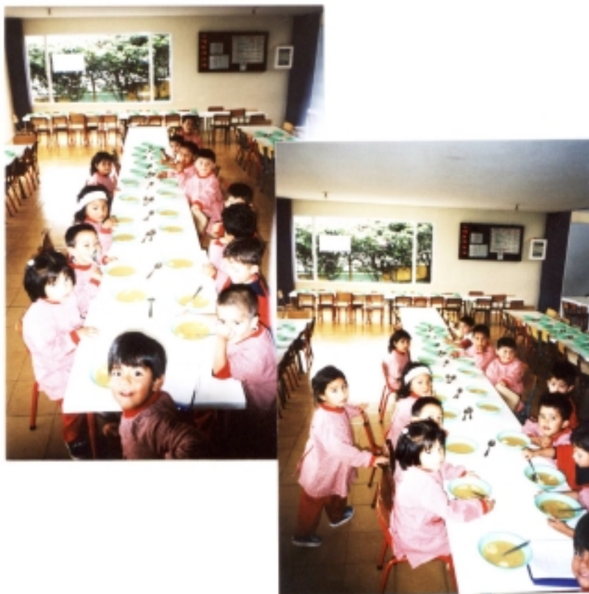
Figura 2. Misión.

El Hogar Infantil Comunitario Agualongo es un ente estatal comprometido con el cuidado, nutrición, formación y educación integral de la comunidad infantil, que se rige por los principios de la democracia participativa, la tolerancia y el respeto por la diferencia, su quehacer está centrado en permitirle al niño, comprender y apropiarse del mundo social, mediante la interacción con el medio que lo rodea, permitiéndole su autonomía y su capacidad para continuar sus estudios primarios y secundarios.