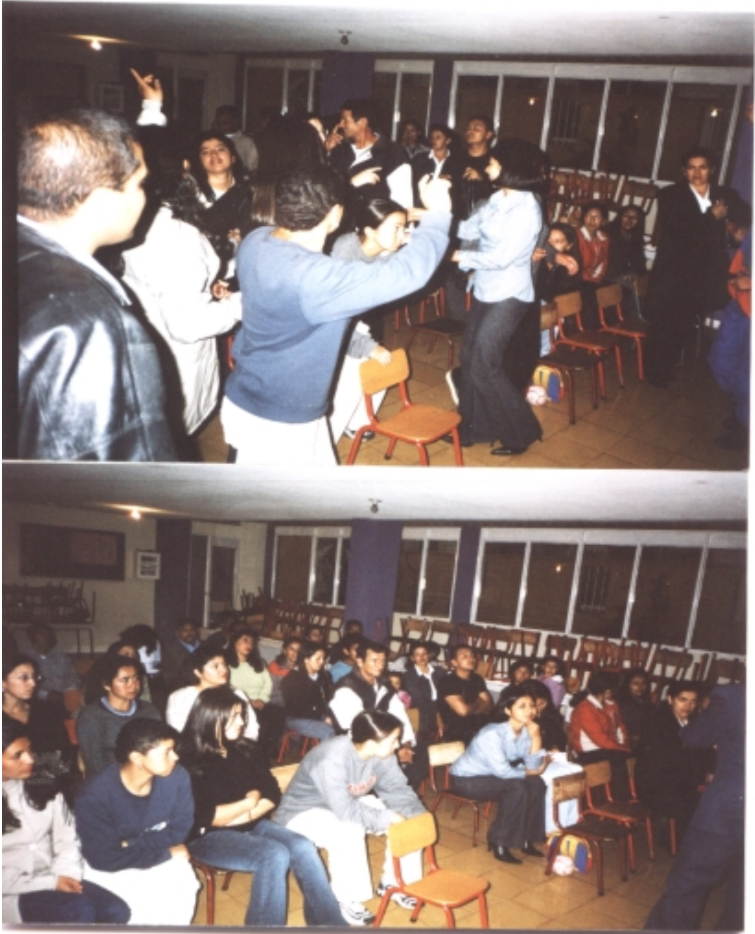
Padres de familia socializando el taller.