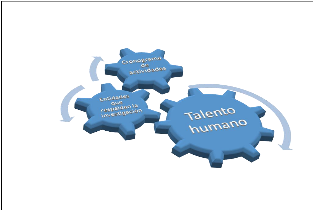
Figura 2. Diagrama administrativo

Para establecer una mejor orientación administrativa de la investigación, fue necesario tener en cuenta el siguiente esquema: