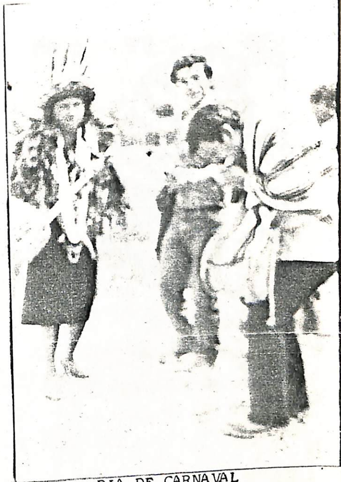
DIA DE CARNAVAL La reina del carnaval bailando - con el Investigador al ritmo de la flauta y tambor tocados por un lider INGA.