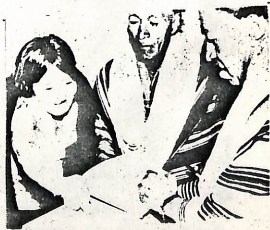
Gobernador Kamzá en el desem- peño de sus funciones.