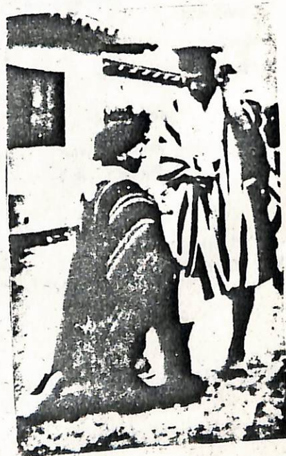
"El perdón público" entre indígenas Kamzá.