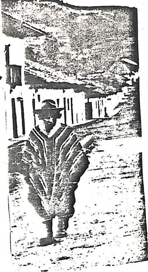
Entrada principal del Corregimiento Intendencial de Santiago. Lider INGA.