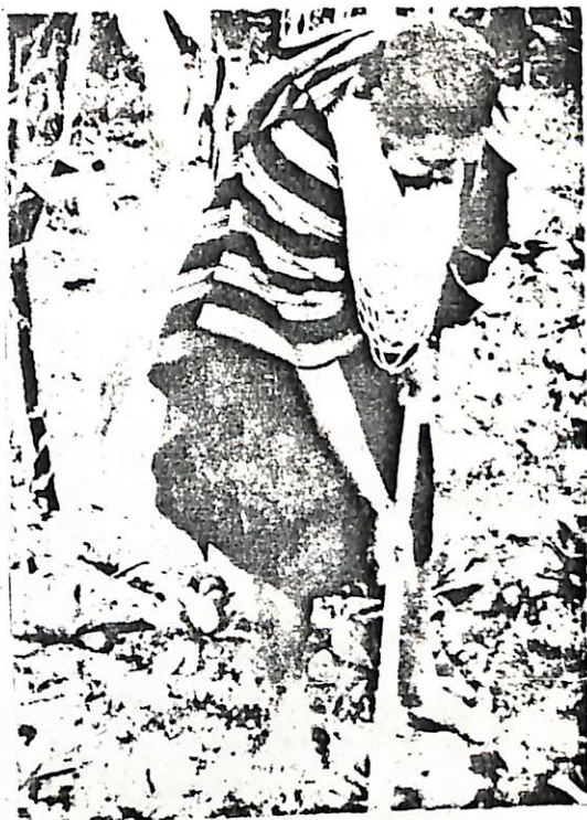
Anciano Inga en sus labores agrícolas.