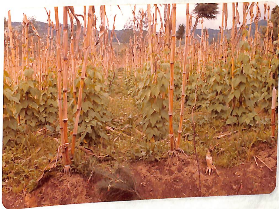
FIGURA 3. Frijol voluble variedad Sangre Toro, con dos ciclos de selección donde se observa la sanidad y vigor de las plantas.