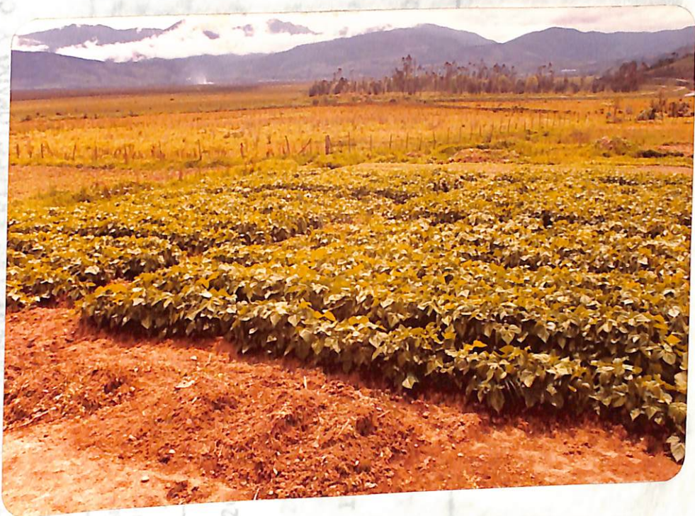
FIGURA 2. Fríjol arbustivo variedad Pa- radillo, con dos ciclos de se- lección, mostrando la unifor- midad de las plantas.

PROBANDO DE LA LONGITUD DE VAIPIAS 50 CENTIMETROS Y SUORO DE GRANDE 100 VAIPIA, EN LAS VARIEDADES DE FRÍJOL VOLUBLE CASCA- SA. SOBRE TIPO DE SUELO DE TIPO CLAYE Y CENIZAL