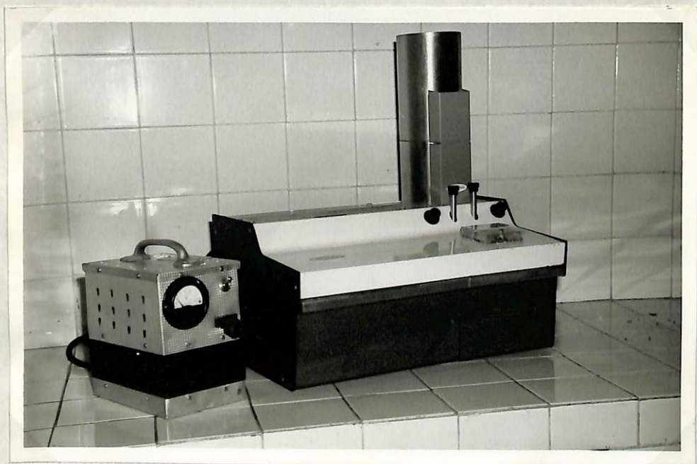
Figura 4.- Laboratorio de Semillas. Determinador de Humedad Burrows.