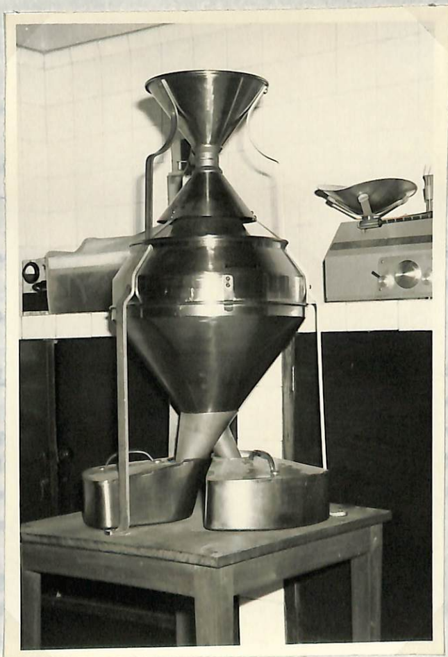
Figura 7.- Laboratorio de Semillas Mezclador para semillas.