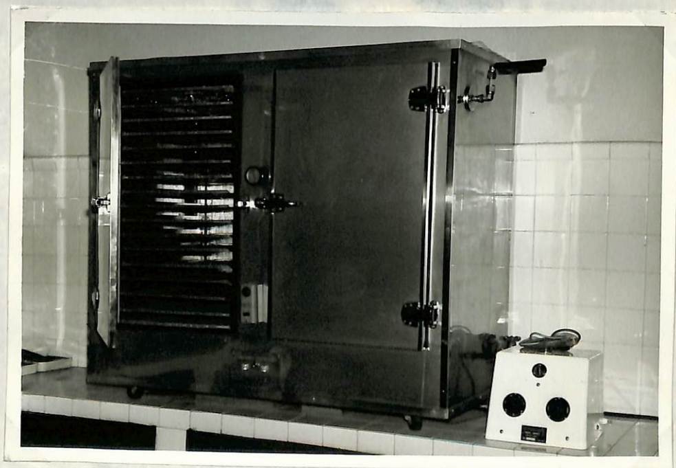
Figura 6.- Laboratorio de Semillas Germinador Electrónico.