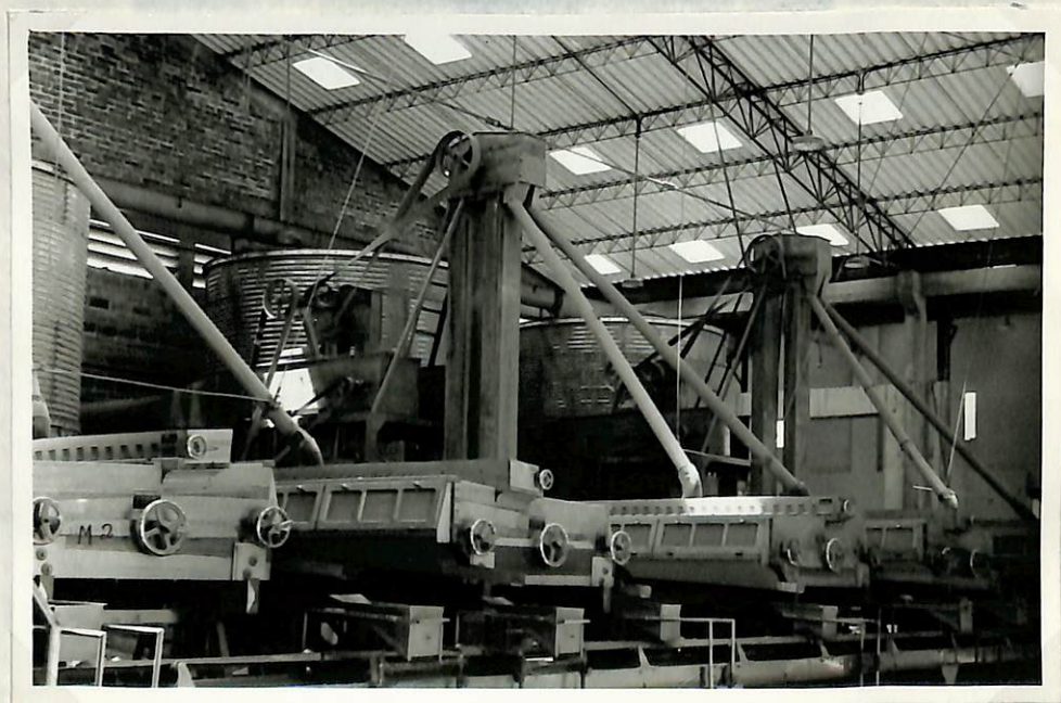
Figura 2.- Planta de Beneficio.

SALA de Clasificación y Selección. Una de del grano de trigo. Capacidad de 30 toneladas por hora.