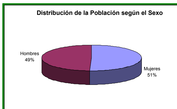
Gráfica 1. Distribución de la población según el sexo

Este grupo de docentes vinculados a las instituciones educativas adscritas a CONACED del perímetro urbano del municipio de San Juan de Pasto y en ejercicio de la docencia en el nivel de educación media se caracteriza por pertenecer a un estrato socio económico medio según datos suministrados por los directivos de cada institución, procedentes en su mayoría de San Juan de Pasto y una minoría originarios de municipios aledaños a la capital Nariñense, el 90% de los docentes se encuentran casados o viven en unión libre y tienen uno o más hijos, y el 10% restante lo constituyen los solteros y sin