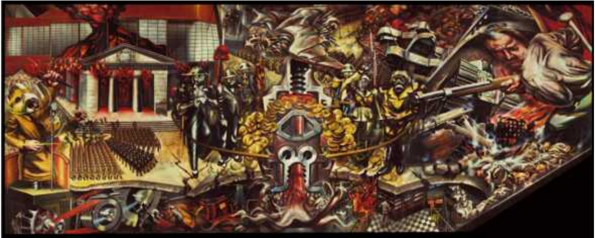
Figura 1. Retrato de la burguesía. Mural de David Alfaro Siqueiros, 1939.

En la imagen se encuentran referencias tanto de la democracia como de los nacientes fascismos de la época, que convertían la sangre de los trabajadores en abundante oro; Siqueiros retrata a militares e integrantes de la burguesía, con rostros protegidos por máscaras de gas, resguardados de la guerra que se sucede a su alrededor, con la protección de unos mediante la explotación de otros.