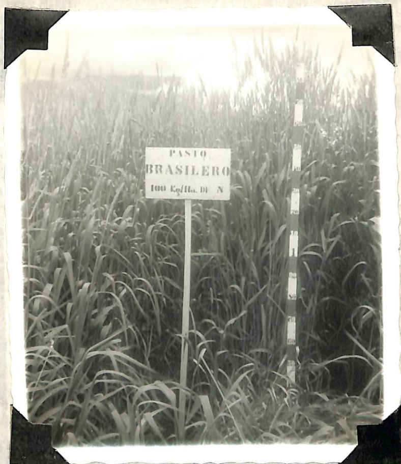
Figura 11. Desarrollo del pasto, con 100 Kg/ Hect de nitrógeno en estado de ma- duración.