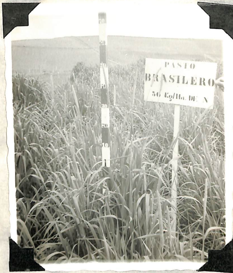
Figura 6. Desarrollo del pasto, con 50 Kg/ Hect de nitrógeno en estado de floración.