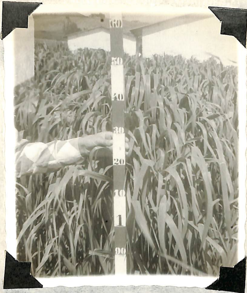
Figura 4. Desarrollo del pasto "brasillero", en estado de prefloración, a los 160 días después de la siembra.