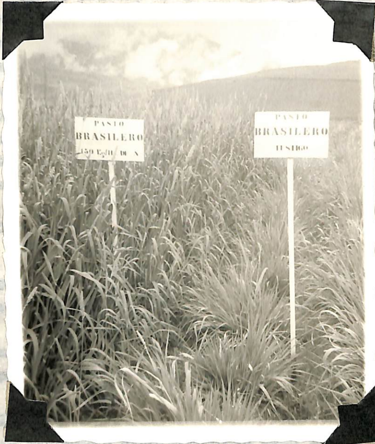
Figura 13. Efecto del nitrógeno en el crecimiento del pasto "brasileiro". A la izquierda parcela con 150 Kg/Hect de este elemento y a la derecha parcela sin fertilización.