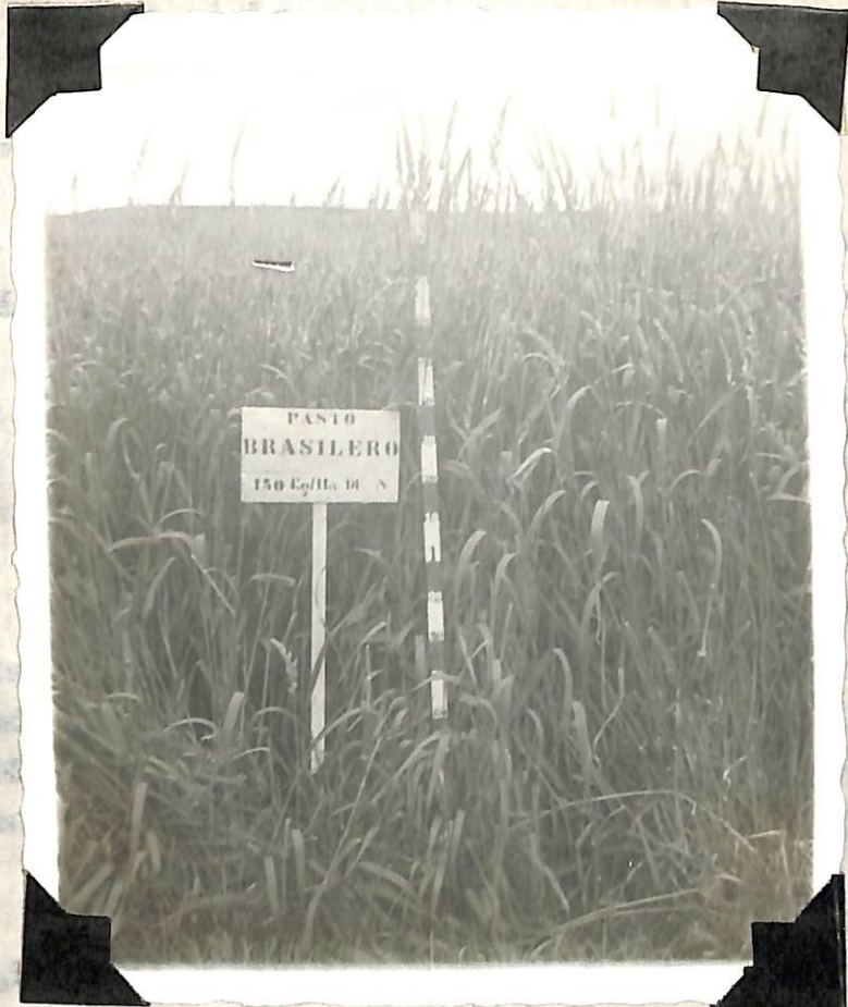
Figura 12. Desarrollo del pasto, con 150 Kg/Hect de nitrógeno en estado de na duración.