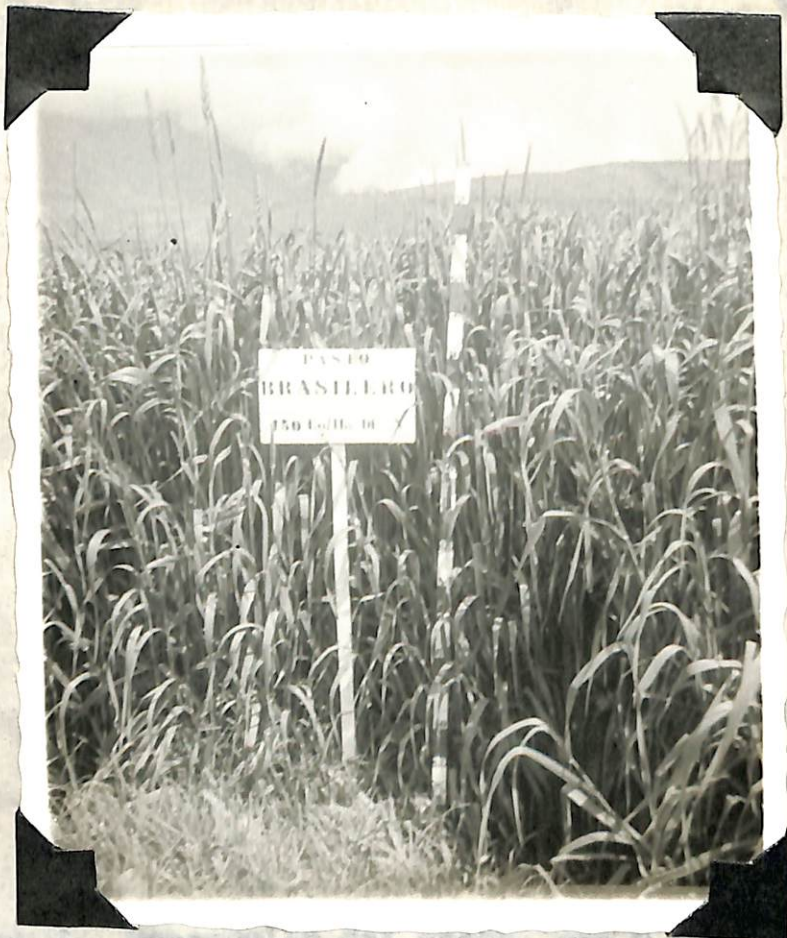
Figura 8. Desarrollo del pasto, con 150 Kg/ Hect de nitrógeno en estado de floración.