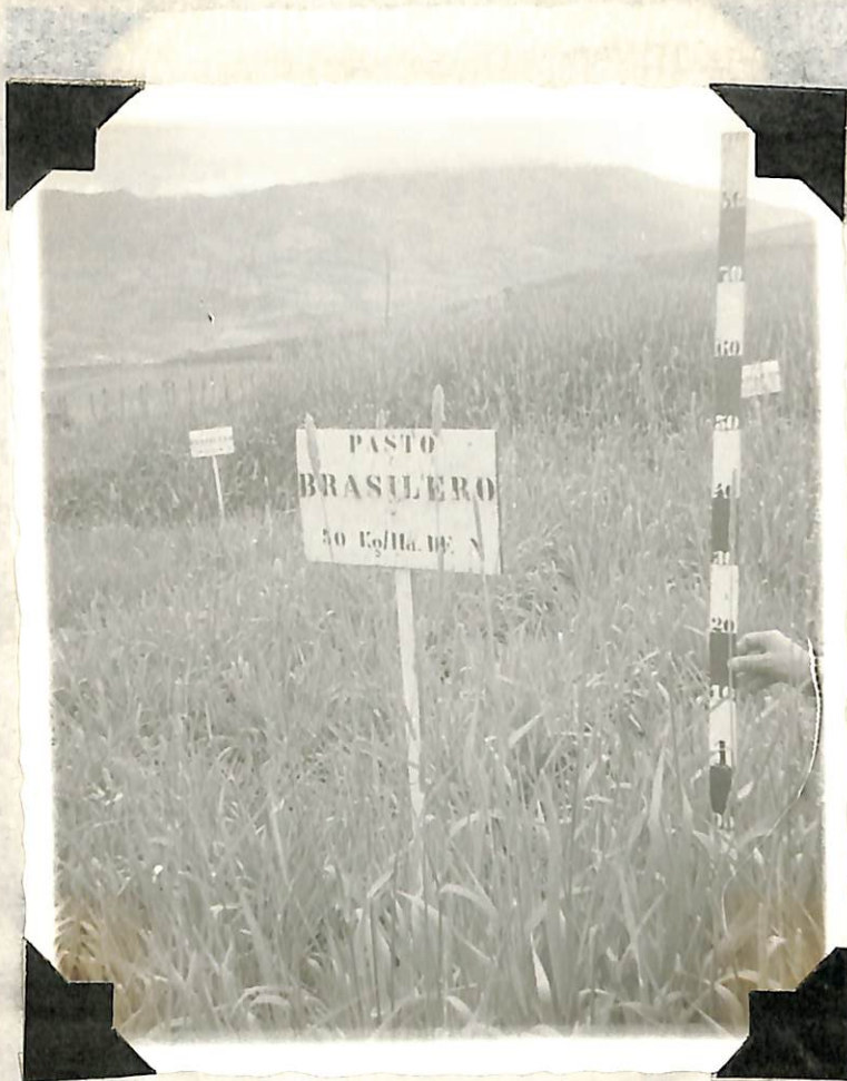
Figura 11. Desarrollo del pasto, con 100 kg/ha de nitrógeno en estado de maduración . Figura 10. Desarrollo del pasto, con 50 Kg/Hect de nitrógeno en estado de maduración .