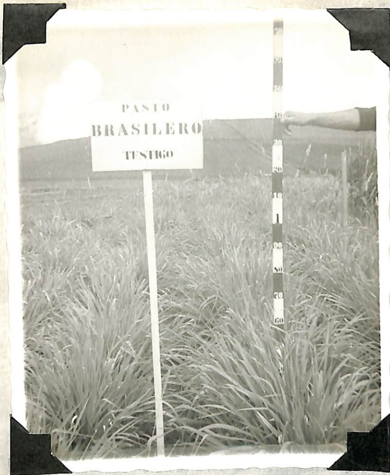
Figura 9. Desarrollo del pasto, con 0 Kg/ Hect de nitrógeno en estado de maduración, a los 102 días des- pués del segundo corte.