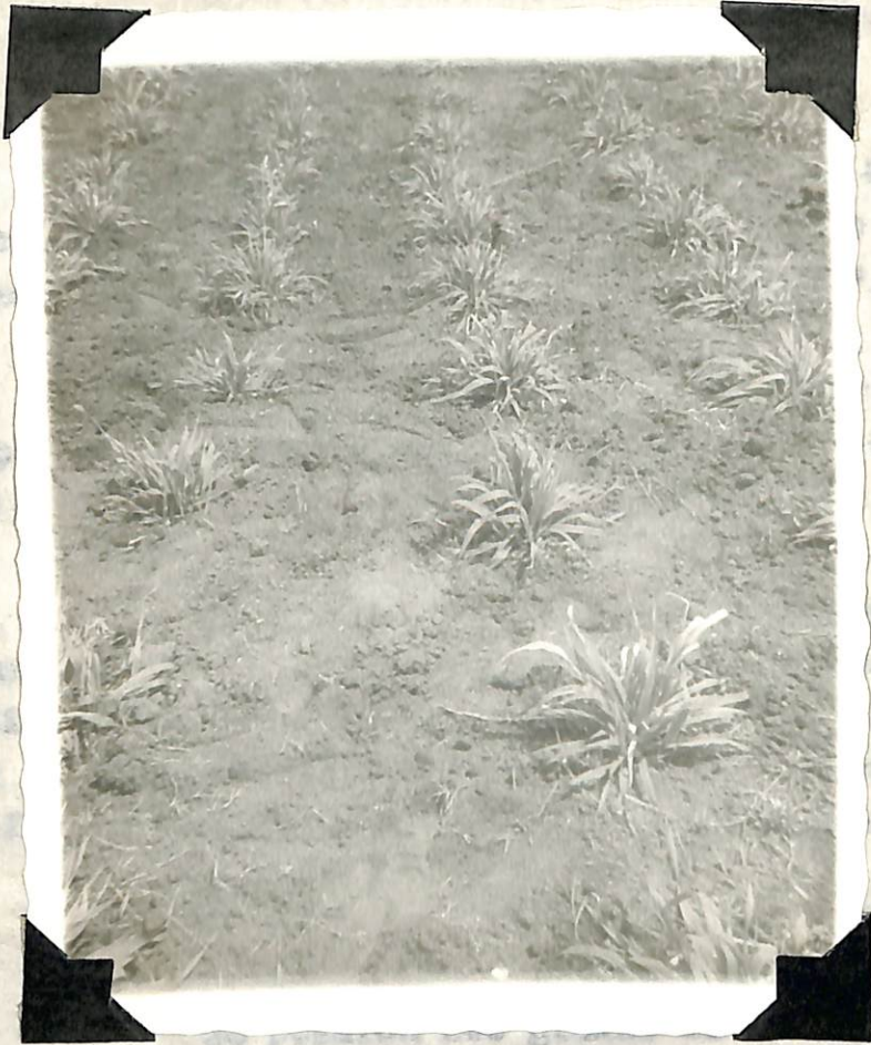
Figura 3. Desarrollo del pasto, a los 30 días después de la siembra.

... en forma, la primera dosis después del primer corte ... y la segunda después del segundo corte. Como muestra en ... del 40%.