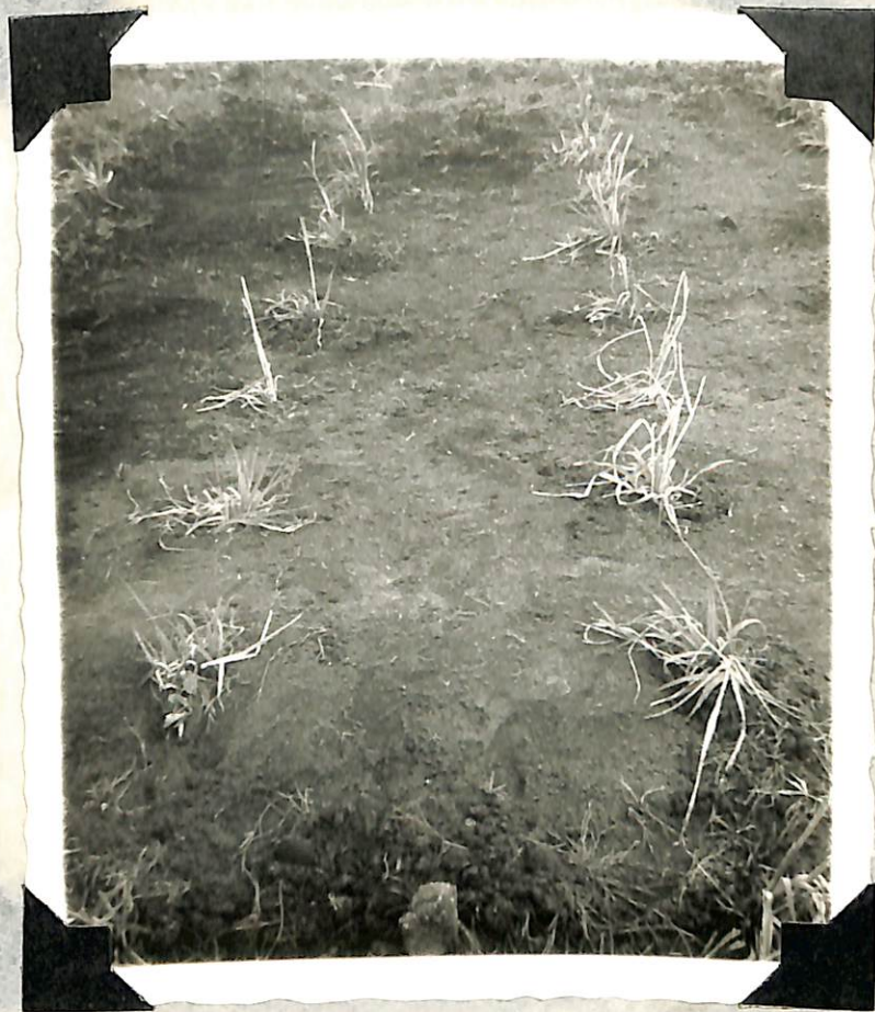
Figura 2. Siembra de cepas del pasto "brasileño".