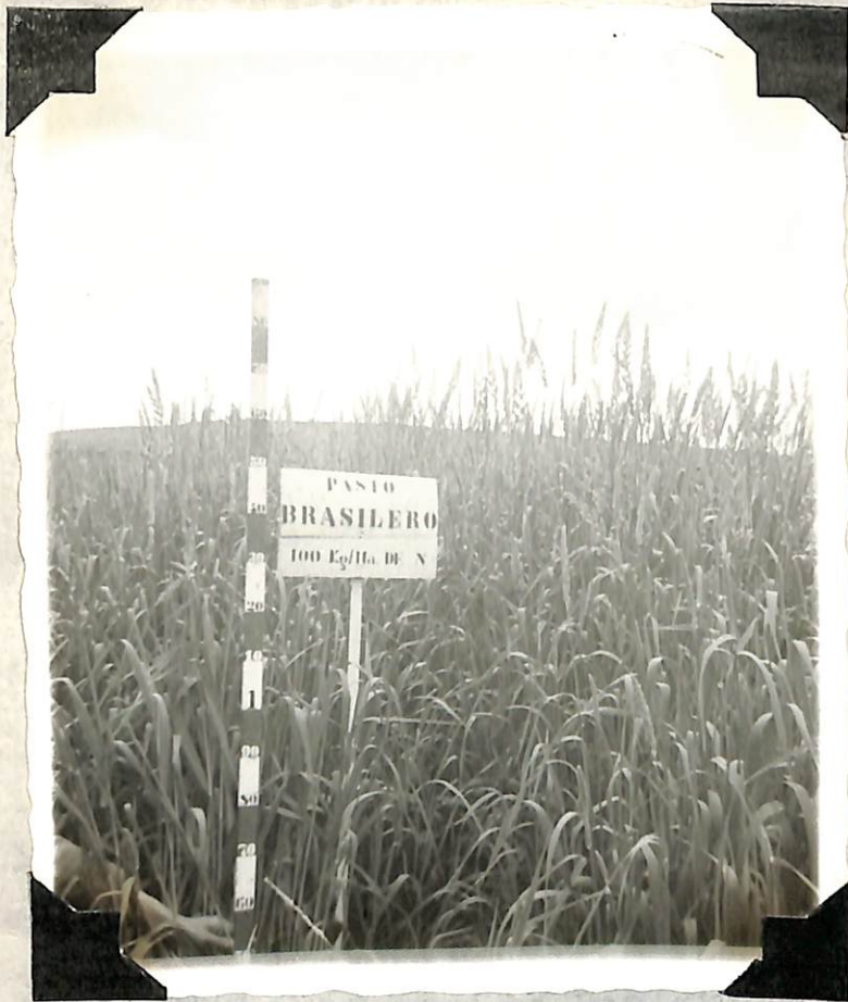
Figura 7. Desarrollo del pasto, con 100 Kg/ Hect de nitrógeno en estado de flo- ración.