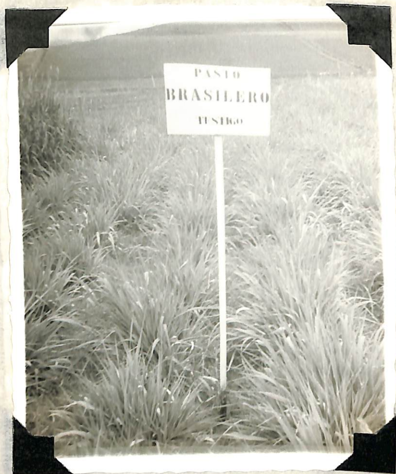
Figura 5. Desarrollo del pasto, con 0 Kg/Hect de nitrógeno en estado de floración, a los 100 días después del primer corte.