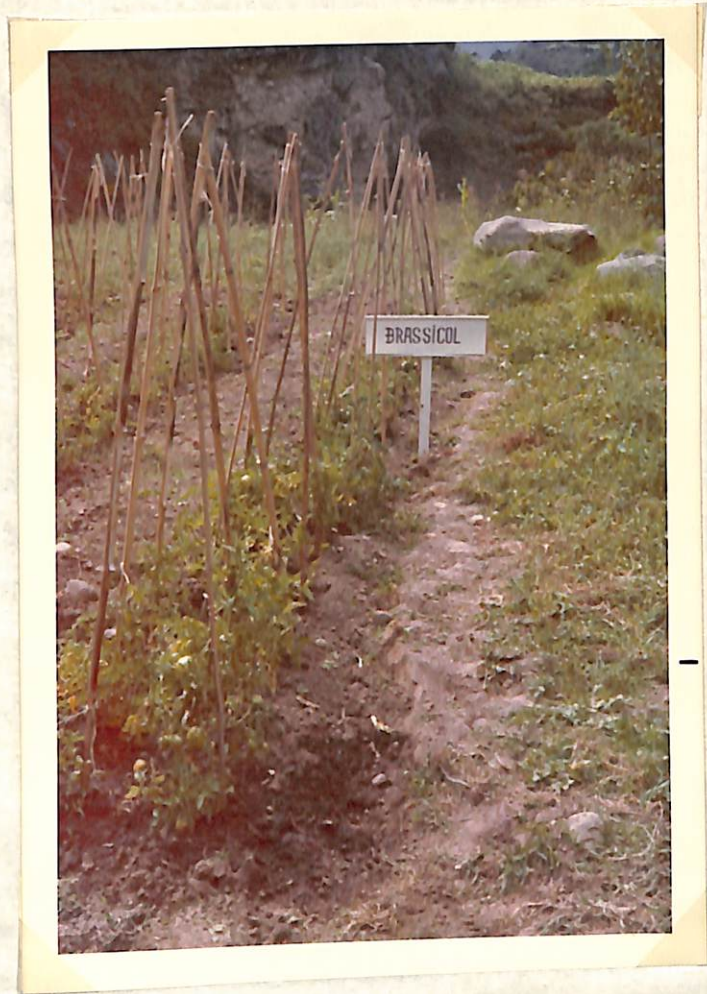
Figura 2. Efectividad del Brassicol, a los 80 días después de la aplicación al suelo, contra el marchitamiento del tomate ( Sclerotium rolfsii Sacc.)