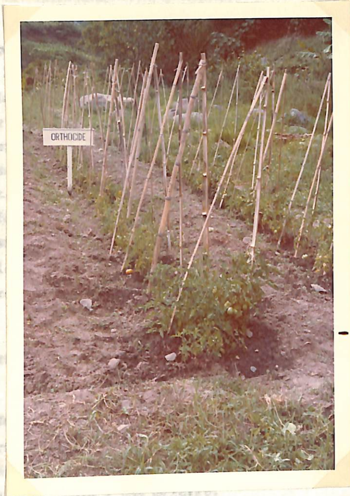
Figura 3. Comportamiento del Orthocida a los 80 días después de apli- cado al suelo, contra el mar- chitamiento del tomate ( Sclero- rotium rolfsii Sacc.)

(Figuras 4 y 5). El Orthocida es aplicado a la vez en varias con el Vitrox - del para desahogado con el Vitrox en forma efectiva ya que el primer produc- to necesita estar en mayor cantidad para controlar los ataques de Sclero- rotium rolfsii Sacc.