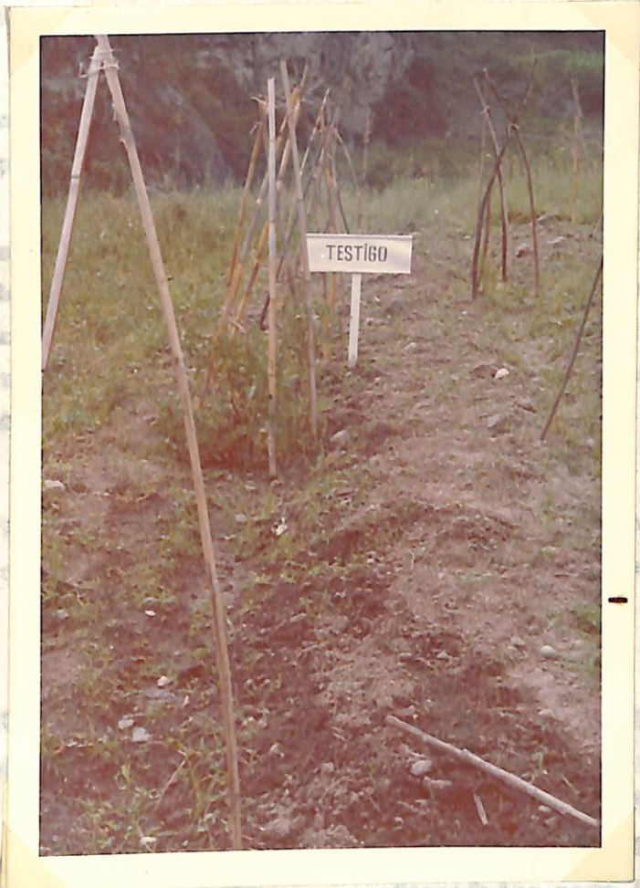
Figura 1. Surco testigo de tomate con pocas plantas no afectadas por Sclerotium rolfsii Sacc.

El Braxicón (FUS) fue superior a todos los productos y sus orga- nismos ya que en sus fructos no se detectó acción alguna de Sclerotium rolfsii Sacc. que se liberaba poco a poco al fragmentarse estos y se en fitotóxicos para el cultivo del tomate.