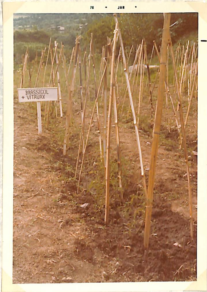
Figura 6. Mezcla Brassicol + Vitavax en el control del marchitamiento del tomate ( Scierotium rolfsii Sacc.), a los 100 días después de hecha la aplicación al suelo.