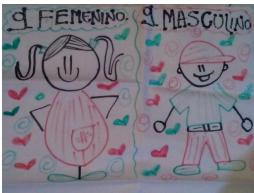
Ilustración 4. Trabajo grupal

La palabra sexualidad no solo encierra el término sexo, que se refiere a la corporalidad y al uso que se le dé a ella, sino también a los procesos histórico sociales de significaciones que se adhieren hacia su cotidiano desarrollo determinado en relaciones de poder y