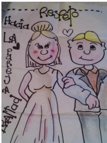
Ilustración 2. Trabajo grupal

Sin embargo al analizar las posturas de la totalidad de los 86 jóvenes indagados mediante los grupos focales, solamente cuatro mujeres dijeron mantener el simbolismo de la “virginidad”. Resultó interesante en el momento que se indaga evaluar la posición de rechazo de los demás jóvenes, en su gran mayoría hombres, respuestas como: “Para mi es algo normal que... la mayoría de personas hacemos o hacen a su debido tiempo, me parece q sexualidad es un acto de amor, o un...o sea en una etapa en el que cada uno lo debe hacer, o es algo es... es el amor a las demás personas o como uno lo demuestra o como uno quiere hacerlo” 19 . La simbología virginidad nos abre las puertas a evaluar la construcción y sostenibilidad de los mandatos socioculturales, en donde los prejuicios y creencias religiosas hacen parte de los factores de machismo, obediencia afiliativa sexual, reconocimiento de autoridad familiar- relacionada con honor familiar, premisas no identificadas en esta pregunta, además 80 de los 86 jóvenes afirmaron haber iniciado su vida sexual.