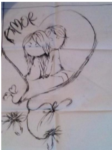
Ilustración 3. Trabajo grupal

“El mecanismo simbólico específico del amor como código comunicacional es la sexualidad; a través de ella, los individuos logran la interpenetración, la fusión” 24 .