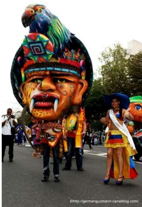
Fotografía 14. Disfraz individual presentado en Paris.2012

No se desprestigia que tampoco, París no tiene unas personas muy queridas, pero es la costumbre también, es cuestión de cultura, por eso para uno tierrita es tierrita y estamos como le digo, en el cielo.