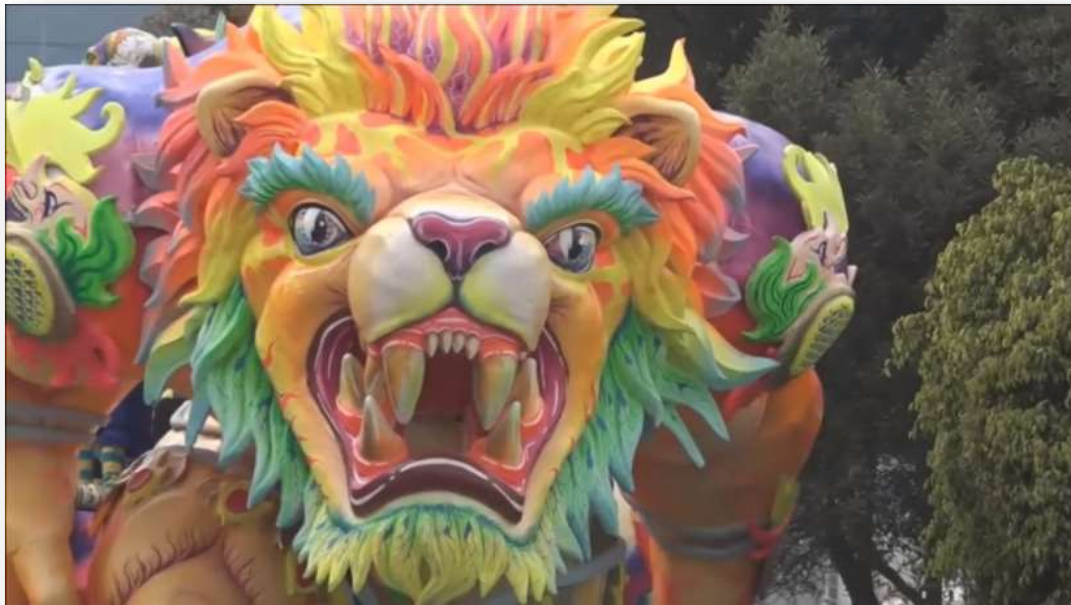
Fotografía 46.. Carroza de Carlos Ruano, El Rey de Carnavales . 2018

Seguimos nuestra escuela en disfraces, murgas, comparsas y años viejos, hasta el momento hemos estado en todas las modalidades de carnaval que hay y nos dedicamos especialmente hoy a la modalidad de carrozas.