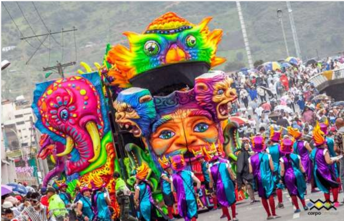
Fotografía 16. Carroza ¡Qué Berraca realeza! 2018

Claro berraco, no ves que es el futuro del carnaval, ¡hola!, porque las coronas son de animales, porque no son de oro, hay el oro no sé come, el oro no es tan importante; como los animales, hasta nuestro dialecto; que bonito, que hablamos no; hay eso es lo que vale; eso es nuestra verdadera realeza, nuestro carnaval, nuestro idioma, hay que bonitos paisanos paisanas, chumar hacen despacitico , no se vayan a desgualangar de la carroza y ¡qué viva Pasto, carajo.”