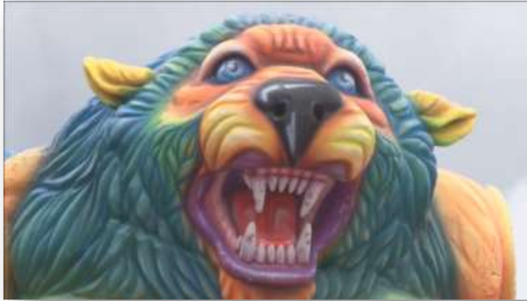
Fotografía 43. Carroza de Carlos Alberto Mena, Espíritus de la selva. 2018

Lo uno, bueno es que a la hora de llevar la carroza a la senda nos quedaron a dar acompañamiento, pero no se sabe ahora este año si irán a dar. Yo al güero que yo tengo acá, aquí unos señores que me van a subir y son de Cedenar y me van a colaborar con las cuerdas, por esa asunto estoy salvado del resto si no se ha sabido todavía como se irá a manejar eso.