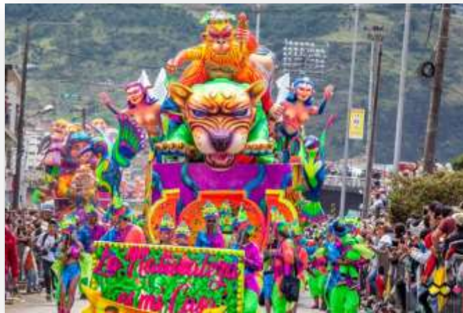
Fotografía 60. Franklin Oswaldo Melo Chávez, desfile magno. 2018

La carroza busca presentar eso fantástico del carnaval, por eso pensamos en hacerle un homenaje a un mago, así que cuentas con dos figuras humanas en la parte frontal de la carroza, los bastidores cuentan con Changó y Santa Bárbara, hay una figura humana que representa el Oggún y que se ubica en la parte trasera de la carroza y para complementarla un mascarón de cabeza de león que va a la espalda y en los bastidores laterales, al igual que figuras de máscaras, es todo esto para representar a la naturaleza, que es nuestra casa.