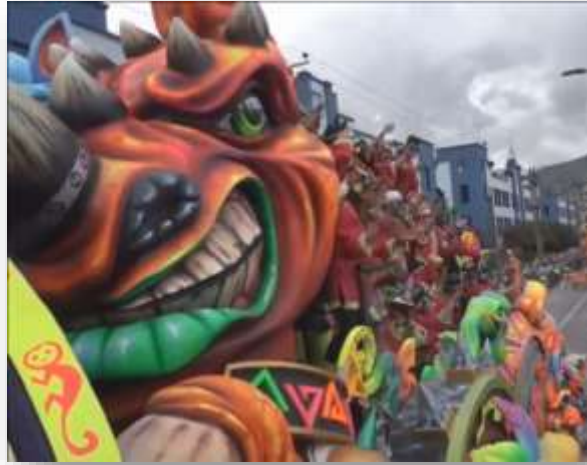
Fotografía 20. Carroza de Freire, Jorge e hijo, “Extinción: el llanto de la tierra.” 2018

de cualquier cosa, y se creó la carroza: Extinción, llanto de la tierra , también como un homenaje a la situación de medio ambiente que estamos pasando en el planeta.