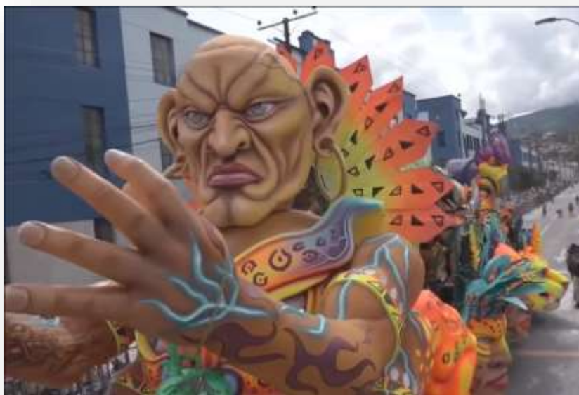
Fotografía 36 Carroza de Albert Rahomir Toro, Yacuruna y los cuatro elementos. 2018

Son anécdotas que han pasado, o sea misteriosas, soy una persona muy creyente, soy entregado al señor, pero, así como existe el bien, también el mal, por eso nosotros prácticamente en este motivo yo utilicé lo que es pues imágenes de santos, trato de apoyarme en el agua bendita, porque el carnaval o sea ustedes bien saben que tiene algo.