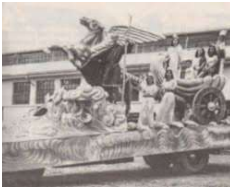
Fotografía 2. Modelo de las primeras carrozas. Autor de la carroza Zambrano, Alfonso

El Carnaval de Negros y Blancos de Pasto tiene dos días en especial para resalta la igualdad de género y etnia, a través de una celebración común y cultural, ya que todos los participantes maquillan sus rostros, un día de negros y el siguiente con talco de blanco , en una fiesta que embellece la ciudad con festones, música, confeti, bailarines y grandes carros alegóricos que presentan la creatividad de los cultores, en el que los hogares se convierten en talleres colectivos para la presentación y transmisión de artes carnavalescas.