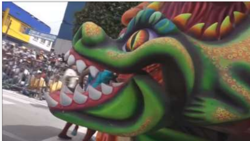
Fotografía 13. Fragmento de la carroza ¡Qué Berraca realeza! 2018

Dese cuenta que hay pocos artistas que muestran su obra como la mostramos nosotros, son poquitos, digo yo, los privilegiados de esta vivencia, de esta catarsis; se puede decir que de este trastoque. Entonces somos muy poquitos los que trabajamos de cuatro a cinco meses, inclusive casi todo el año, porque la maqueta sale más, para ver y votar toda esa carga energética de cuantas personas llevamos en el grupo, para ir a dejarla en doce horas casi en un día que es el desfile magno, que es el jolgorio.