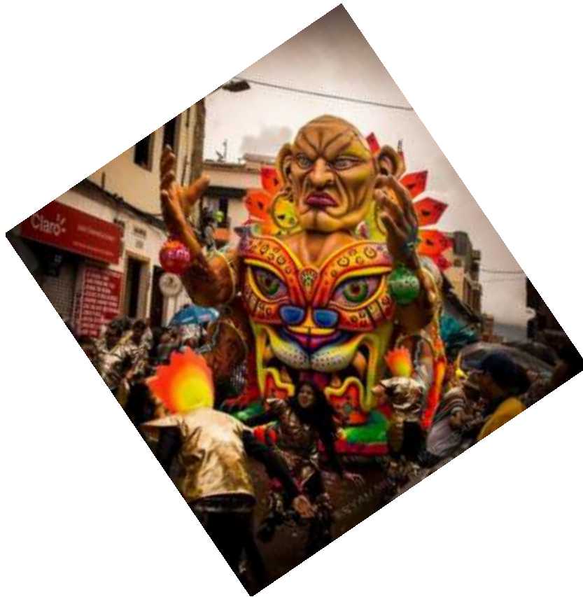
Fotografía 38.. Carroza de Albert Rahomir Toro Coronel. Carnaval de Negros y Blancos. 2018

Esta imagen lleva el espejo porque va a girar y al momento que gire va a mostrar el reflejo del sol, las luces, esto es llamativo, porque eso da esa sensación que el sol proyecta varios rayitos, o sea nos gusta cómo ser curiosos ¿no? O sea, tanto material que se puede utilizar y saberlo utilizar en decoración, como lo pueden mirar ahí ¿no?