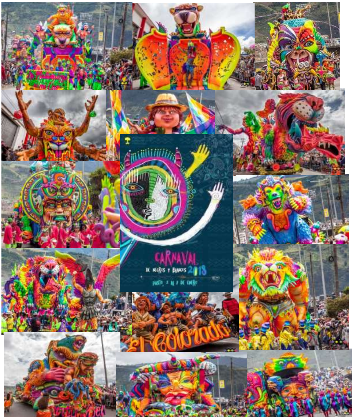
Fotografía 61. Carrozas del Carnaval de Negros y Blancos. 2018