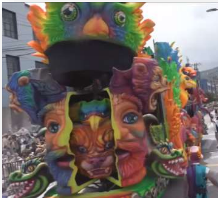
Fotografía 15. Carroza ¡Qué Berraca realeza! 2018

porque no es pavimentado, casi se nos va el letrero, pero ya cogimos pavimentado, listo dos o tres cuadras, con el boqui toqui, mejor dicho, bien coordinado.