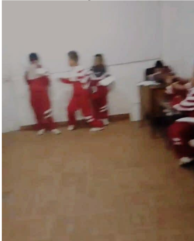
Figura N° 4. Repaso de obra de sainete. Salón grado 4-1. Nuestra Señora de Guadalupe.