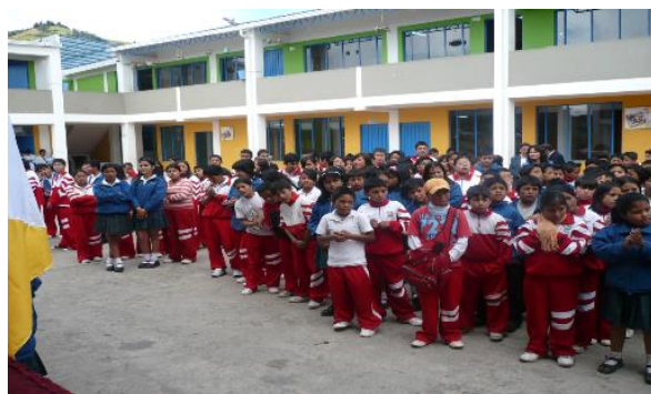
Figura N° 1. Institución Educativa Nuestra Señora de Guadalupe