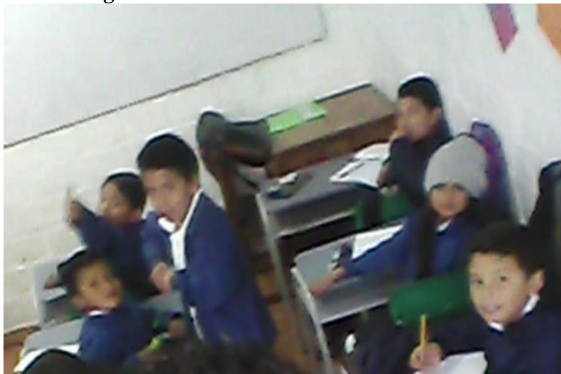
Figura N° 3. Aportes en el guion de sainete.

interacciones, sus borradores de guiones que servirán de base para el sainete. Esta actividad permitió un acercamiento a la escena, estableciendo los turnos de la palabra mediante el guion; al escribir las ideas sobre los temas a desarrollar en la escena también se contribuye al manejo del lenguaje escrito y la importancia de relacionarlo de forma coherente para que el texto representado actoralmente tenga sentido y sea entendible por el auditorio.