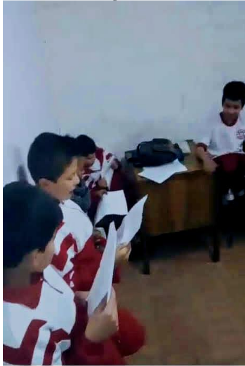
Figura N° 5. Repaso actoral en el salón con guion.