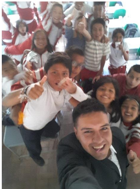
Figura N° 2. Estudiantes grado 4-1. Institución Educativa Nuestra Señora de Guadalupe

Para la observación de las actividades de teatro se utilizaron dos sainetes: el primero un día normal en la escuela, donde la puesta en escena hacía debatir oralmente a los estudiantes, como comúnmente lo hacen en un día normal, con situaciones de interacción comunicativa oral y gestual, además de diferentes aspectos en la expresión oral, como son: gestión del texto, turnos de la palabra, intercambio de roles, pronunciación, cambios de modalidades, usos lingüísticos y lenguaje corporal. En la siguiente fotografía se muestra a los estudiantes del grado 4-1 participando activamente de la motivación previa a la actuación, esta primera interacción ayuda a establecer canales comunicativos de cercanía, confianza y respeto, las cuales son base fundamental para los diálogos en la escenificación.