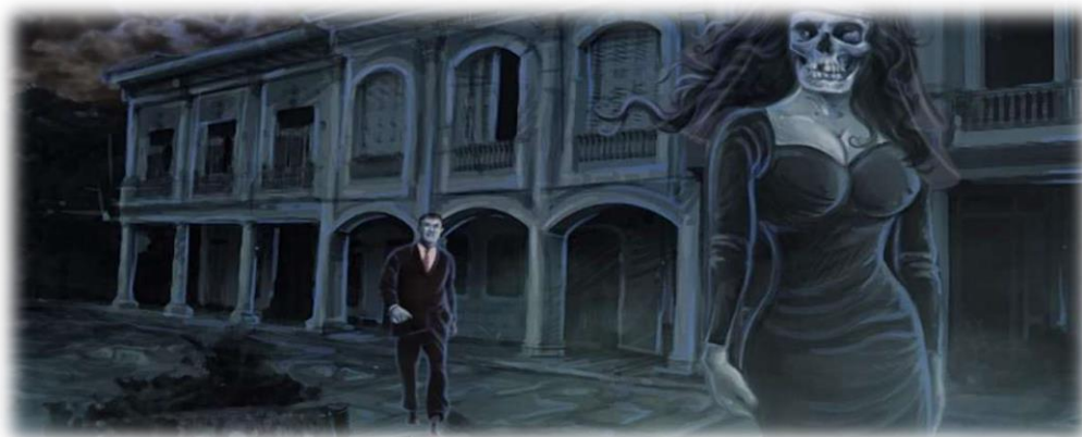
Ilustración 9 Leyendas de Colombia

Al otro día me vine. ¡Un miedo que me dio! Y no la vio el Afranio y yo si la vi. Era entera de negro, con vestido largo y zapatillas. Si no preguntarale al Afranio.