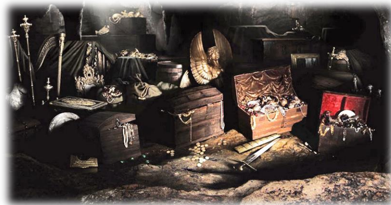
Ilustración 6 Baúles de madera y cofres

Al decir eso se hizo agua y llegó un perro así vea y nos sacó a pura, volamos, eso sí es grave. Ahí sí hay Guacas, en todo ese sector.