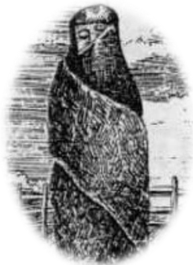
Ilustración 14 La Viuda