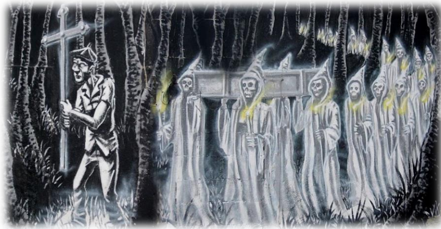
Ilustración 7. Leyenda de la Santa Compañía