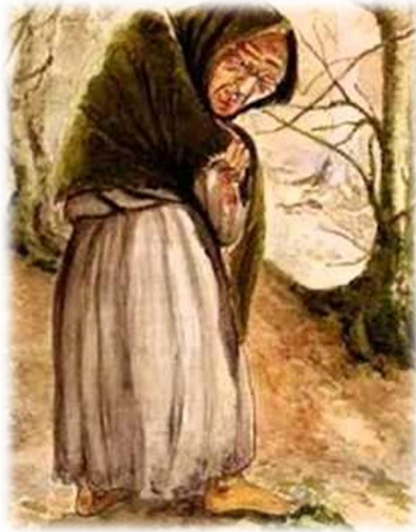
Ilustración 17 Madre Vieja