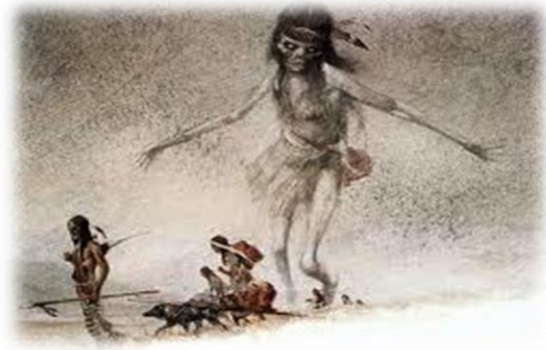
Ilustración 16 El fantasma