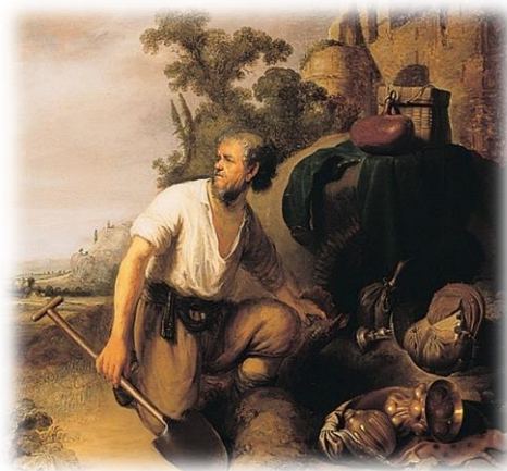
Ilustración 11 Leyenda del tesoro