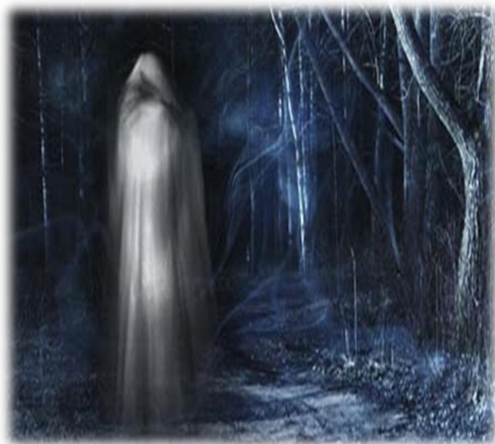
Ilustración 10 Leyendas colombianas