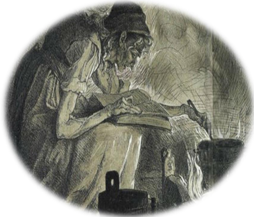
Ilustración 3 Las Brujas