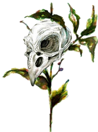
Ilustración 5 Aves misteriosas

Y nos iba llevando más allá al monte, y no podíamos alcanzarla, pues esa era el Ave de la Vieja.