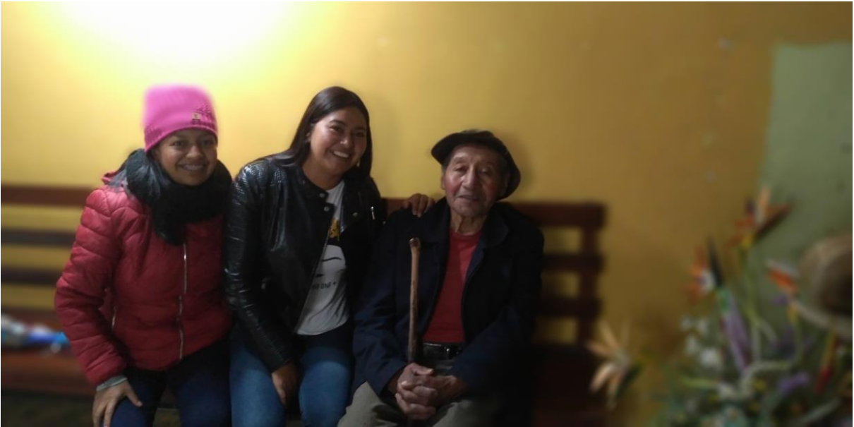
Ilustración 23 Capilla del Niño de los Santos Reyes