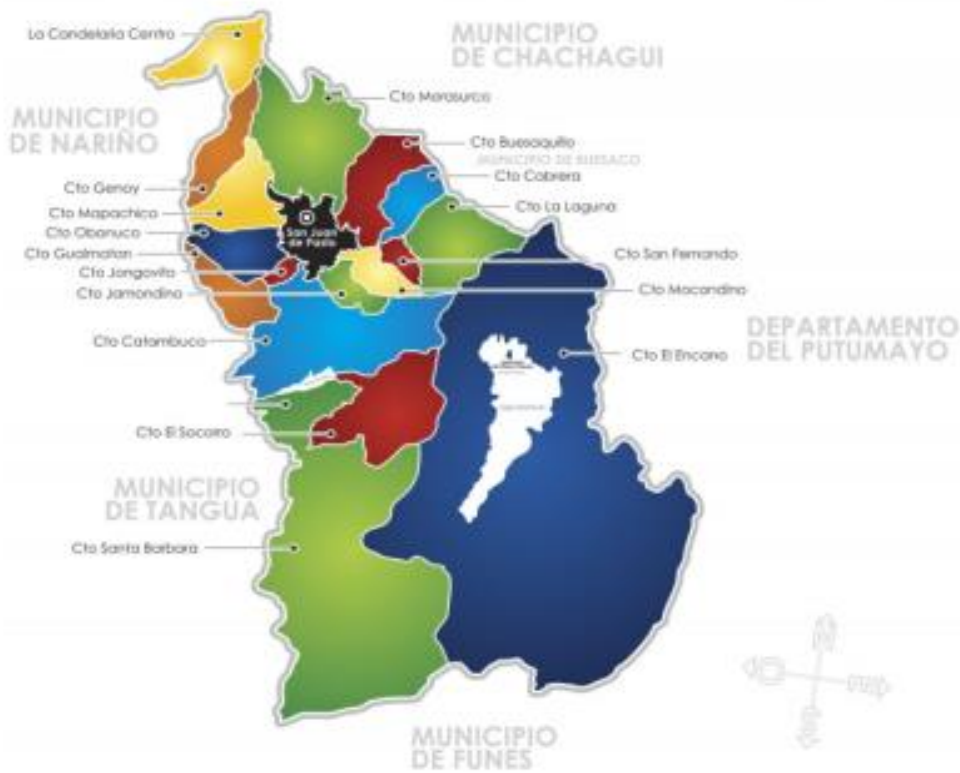
Ilustración 1 Mapa de Pasto