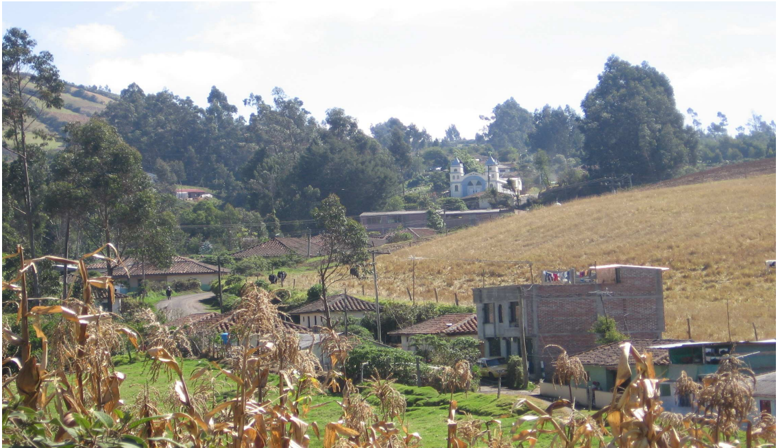
Figura 1. La Aguada- Municipio de Yacuanquer (Nariño)

La Aguada, esta ubicada al noroeste del municipio de Yacuanquer se llega tomando la vía panamericana el Km. 18 a unos 4 kilómetros aproximadamente de la vía que une la ciudad de Pasto con Ipiales, también se llega por el lado sur tomando la vía desde la cabecera municipal a unos 4 kilómetros esta región es de carácter veredal topográficamente la zona es de terreno quebrado limita al norte con la vereda El Tambor al sur con la vereda El Cebadal y al occidente con la vereda Mejía, la región tiene una altura promedio de 2700 metros sobre el nivel del mar lo que determina una zona de clima frío con temperaturas inferiores a los 9 a 10 grados centígrados, hay dos periodos de lluvias y dos periodos de verano en forma alternada, las sequías se caracterizan por vientos muy fuertes y las noches muy frías lo que ocasionan los daños a los cultivos.