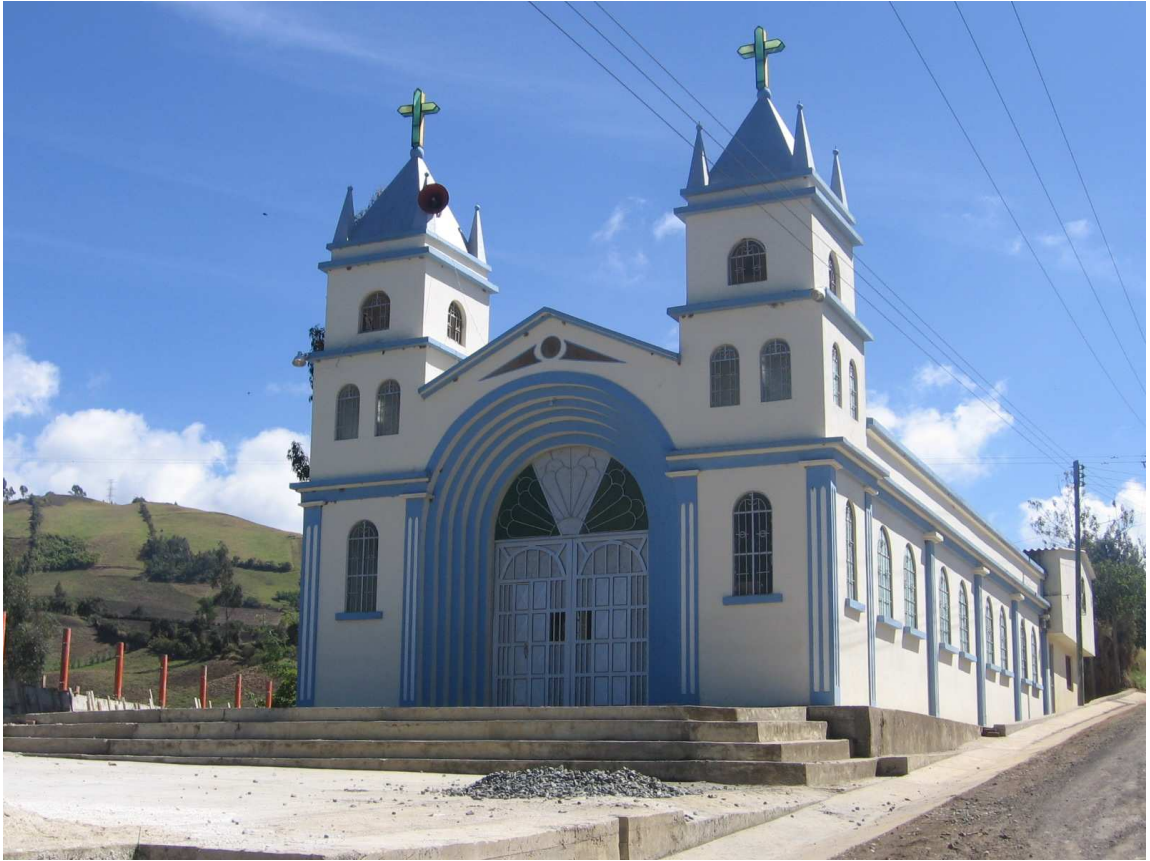
Figura 3. Templo de Nuestra Señora de Fatima