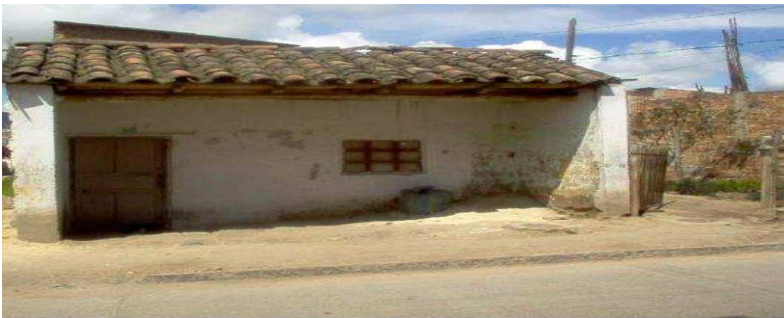
Figura 2. Casa campesina

Los habitantes de esta región son jornaleros en su mayoría, ganándose un jornal que oscila entre $ 4500 a $ 5000 pesos diarios otros buscan otra alternativa de trabajo como empleadas de servicio domestico para ayudar al sustento de la familia.