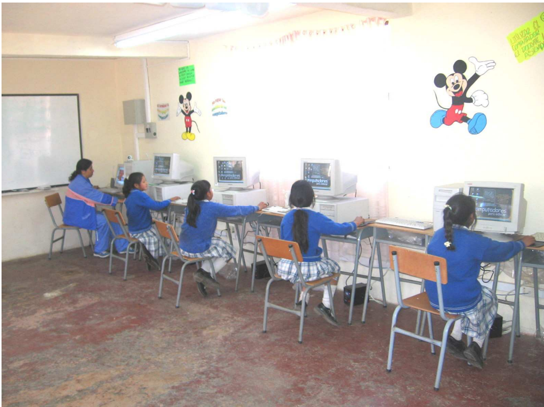
Figura 5. Contexto Escolar

Los niños de 12 años en adelante que por condiciones precarias de la familia tienden a convertirse en mano de obra activa barata, que por derecho y por su edad deberían estar estudiando.