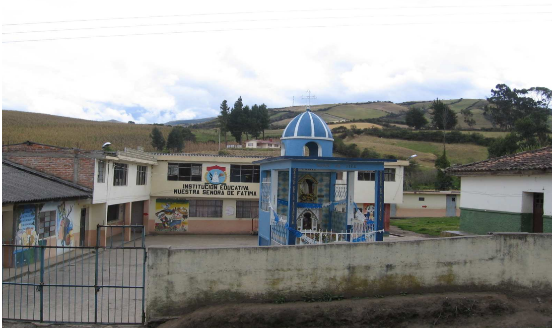
Figura 6. Panorámica Institución Educativa Nuestra Señora de Fátima

Este trabajo investigativo comenzó en las aulas del Centro Educativo de la Aguada, para mayor conocimiento del escenario y sus protagonistas se inicia con una reseña histórica de la Escuela.