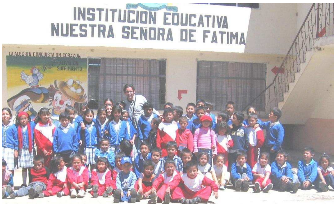
Figura 4. Institución Educativa Nuestra Señora de Fátima

Los estudiantes de la Vereda La Aguada asisten al Centro Educativo, que ofrece el nivel de transición y Básica Primaria; no todos los estudiantes logran terminar el grado 5º, tan solo una minoría siguen estudios secundarios. En la población adulta se encuentra un gran número de padres y madres semianalfabetos según ellos “Saben hacer algunas cuentitas para que la gente no los engañe” y también “Leer y escribir algunas palabritas”.