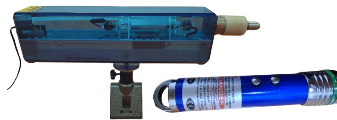
Figure 3: Apuntadores láser

Fotomultiplicador es un dispositivo electrónico capaz de detectar niveles muy bajos de luz y amplificar la señal mediante una cascada de dinodos, lo que los hace ideales para aplicaciones científicas de alta sensibilidad.