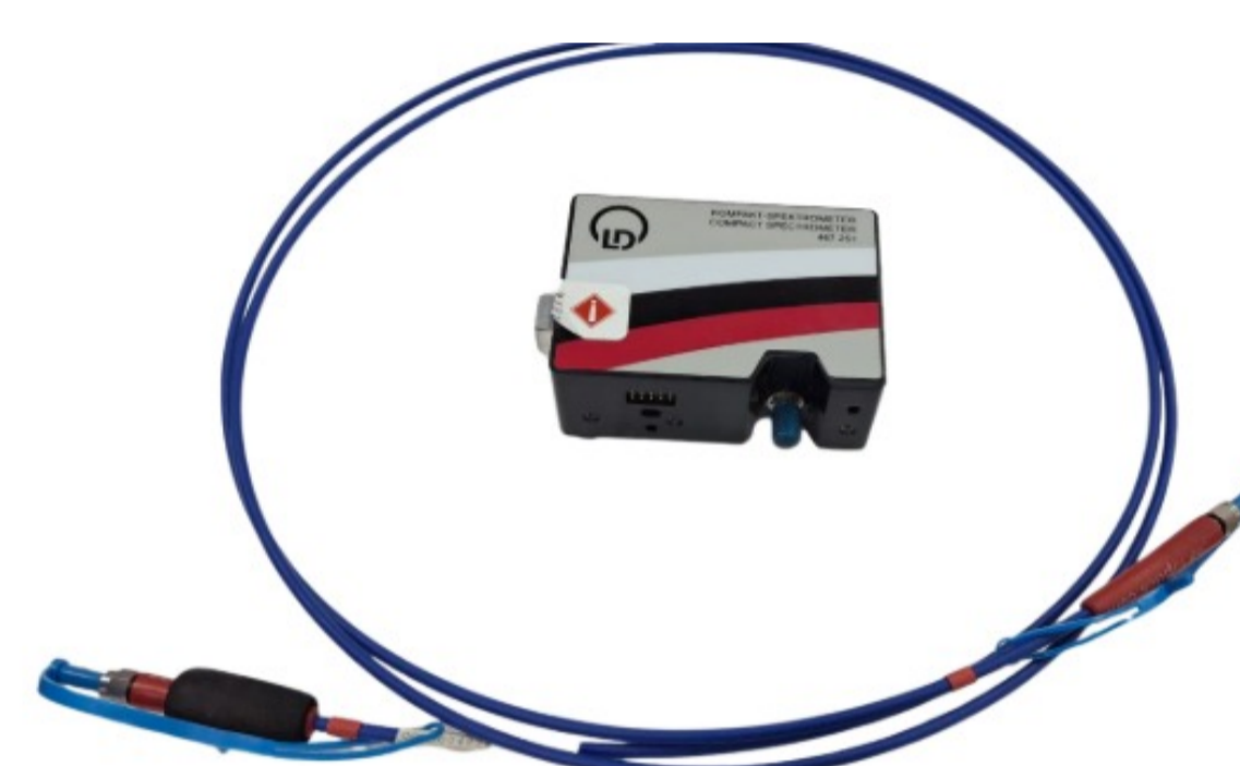
Figure 2: Espectrómetro Compacto