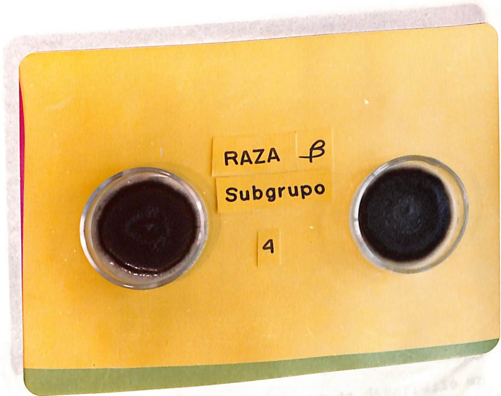
Figura 3. Características de algunos aislamientos del grupo IV de la raza Beta de Colletotrichum lindemuthianum .