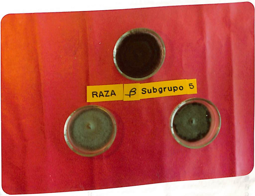
Figura 4. Características de desarrollo en PDA de algunos aislamientos del grupo V correspondiente a la raza Beta de Colletotrichum lindemuthianum .

TABLA IV CANTIDADES DIFERENCIALES Y COMERCIALES DE FRIJOL ( Phaseolus vulgaris L.) A LA RAZA ALFA DE Colletotrichum lin demuthianum