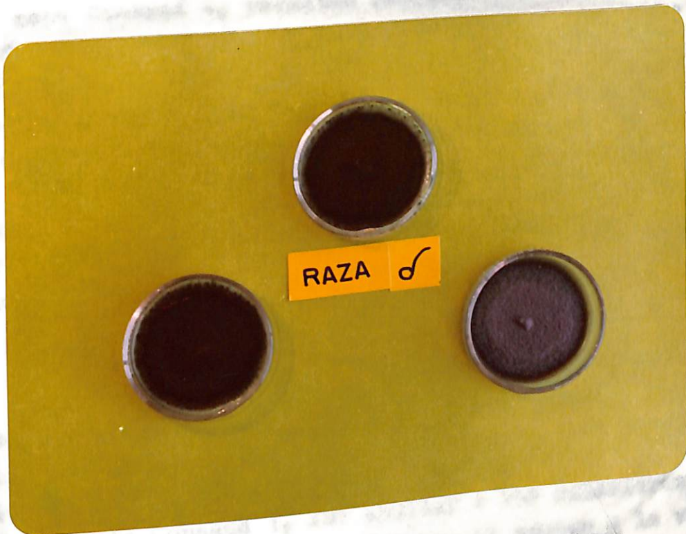
Figura 6. Características en PDA de algunos aislamientos de la raza Delta de Colletotrichum lindemuthianum .