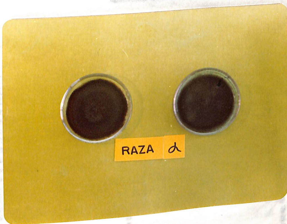
Figura 5. Aislamientos no esporuladas de Colletotrichum lindemuthianum de la raza Alfa.

REACCION DE VARIETADES DIFERENCIALES Y SUBCULTIVAS DE Colletotrichum lindemuthianum L.Ø A LA RAZA ALFA DE Sclerotinia sclerotiorum (Lib.) B. & N.