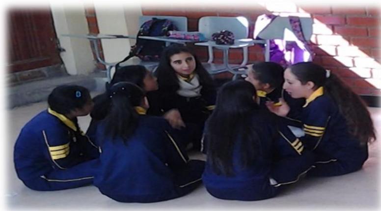
Fotografía 9. Actividad Ampliando mis conocimientos

información en internet si lo considera necesario. Finalmente se presentó una tira cómica donde tenían que responder a la pregunta ¿cuál es tu opinión al respecto?