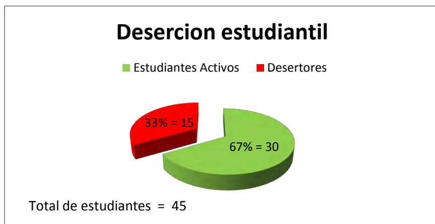
Grafica No. 1 Deserción Estudiantil

fueron encuestados 10 estudiantes que representan el 66.6%. Todos fueron encuestados cara a cara y 5 estudiantes no fueron encuestados debido a la imposibilidad de ubicarlos de alguna forma los cuales representan al 33.3% de la totalidad de desertores. Los datos presentados anteriormente se pueden observar de mejor manera en las siguientes graficas. (Graficas 1 y 2)