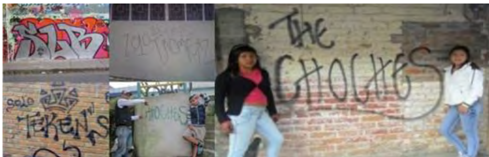
Foto 6. Grafiti.