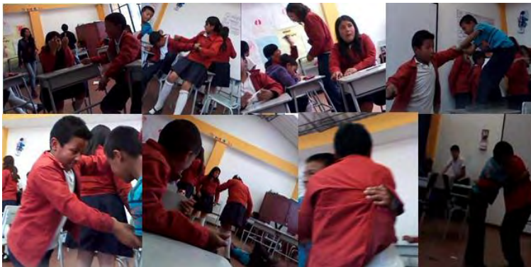
Foto 9. Comportamientos agresivos en clase