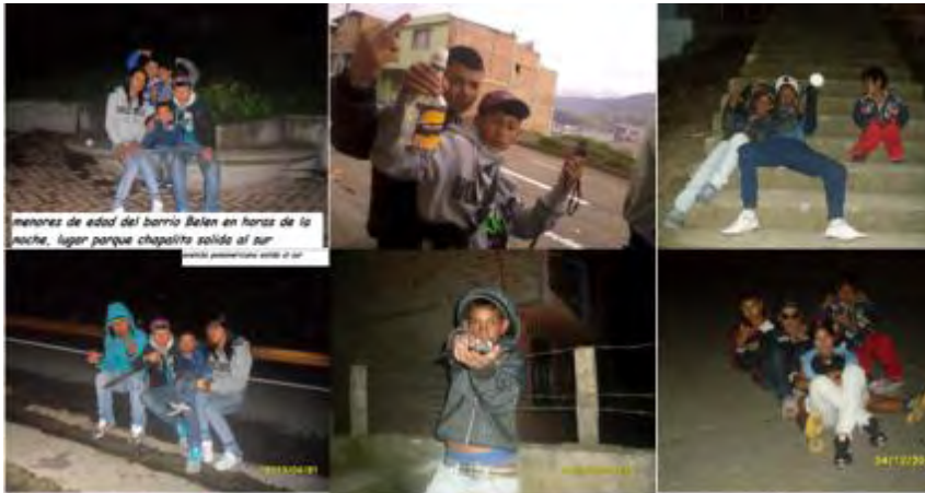
Foto 4. Menores de edad sin supervisión familiar.