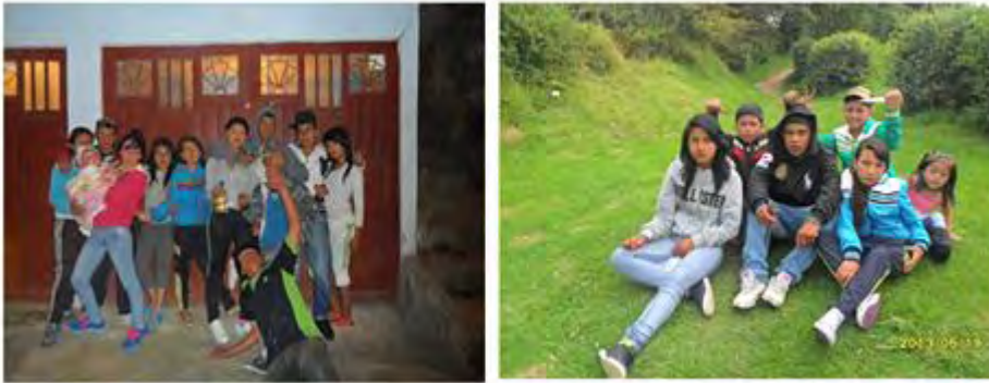
Foto 2 y 3. Escenarios de socialización