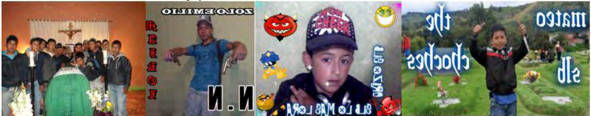
Foto 8. Identidad simbólica y poder en la red