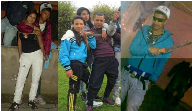
Foto 7. Interacción social aprendida, el entorno y formas de imitación