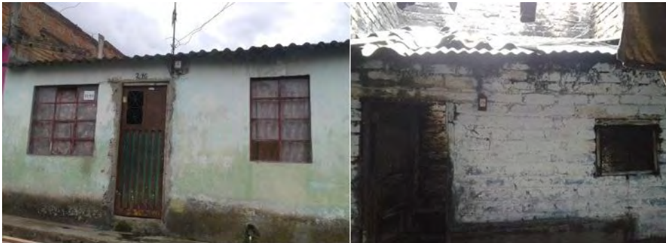
Foto 1. Casas barrio belén, doce de octubre