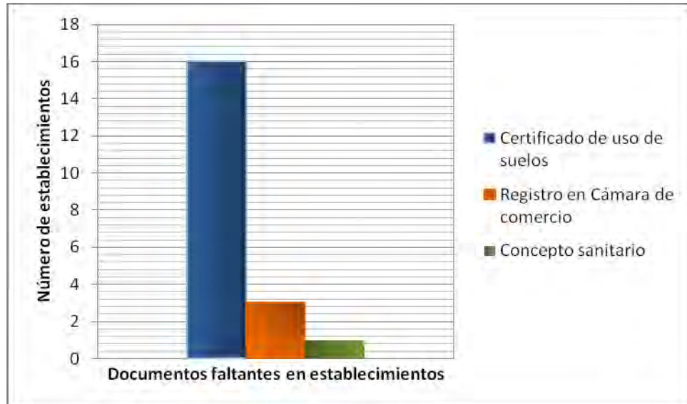
Gráfica 2. Documentos faltantes o desactualizados en los establecimientos

En la gráfica, se puede observar que los propietarios que aun no han tramitado el registro ICA, es porque tienen inconvenientes con algún documento, y en la mayoría de los caso es el certificado de uso de suelos, el trámite que más demora tiene y que retrasa la entrega puntual de los papeles.