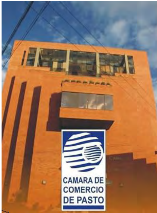
Figura 2. Cámara de Comercio de Pasto