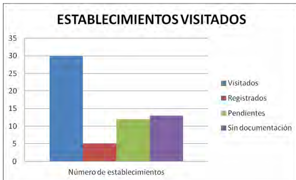
Gráfica 1. Distribuidores visitados, distribuidores registrados, distribuidores con documentación pendiente, distribuidores que no se presentaron.

Las visitas realizadas a los establecimientos distribuidores de insumos pecuarios, fueron treinta, de los cuales, cinco ya se encontraban registrados ante el ICA en años anteriores; doce de los treinta establecimientos, están con documentación pendiente y trece no se han acercado a la oficina del ICA con ningún tipo de documento. Lo que nos demuestra que solo un 16,66% se encuentra dentro de la norma.