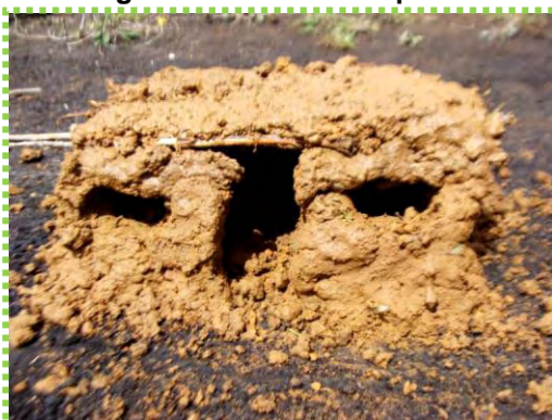
Figura 41. Casa de Tapia