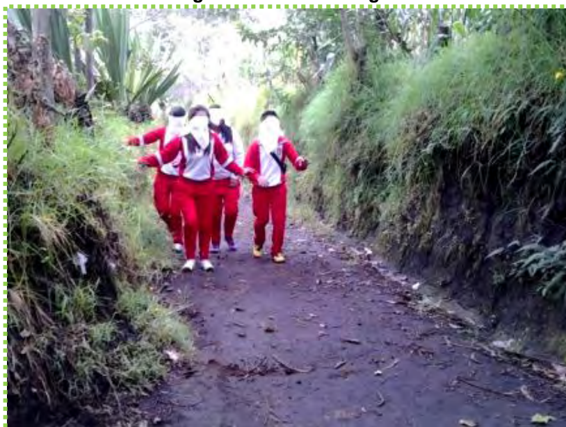
Figura 9. Belleza a ciegas