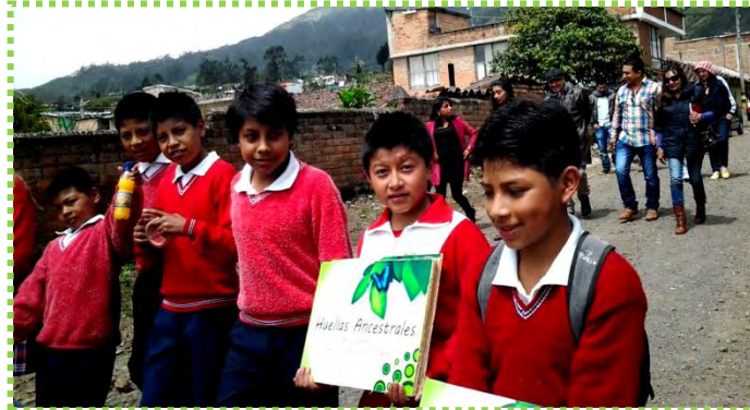
Figura 46. Protagonistas en el Sendero