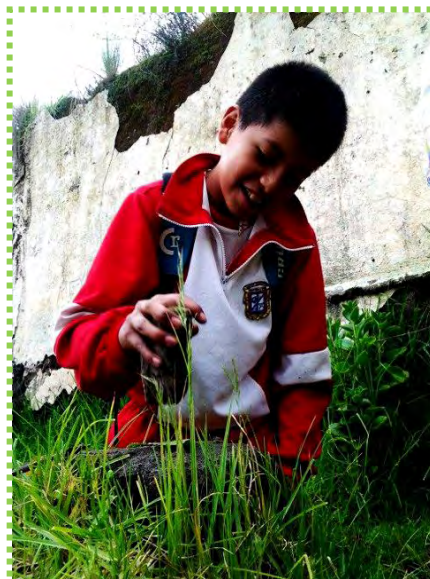
Figura 26. Como lo hace mi abuela

Fuente: Fotografía visita casa abandonada