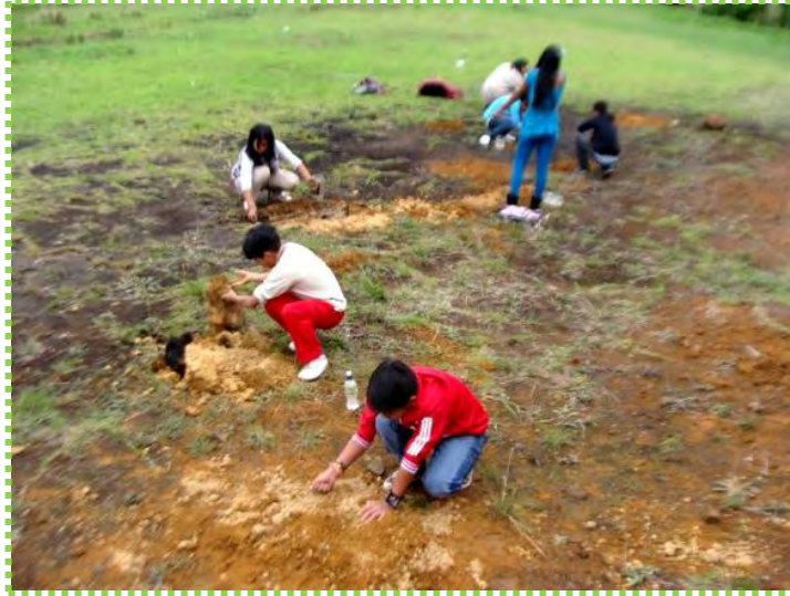
Figura 11. Tierra húmeda