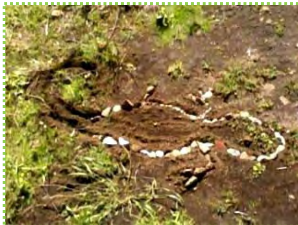
Figura 45. Huellas