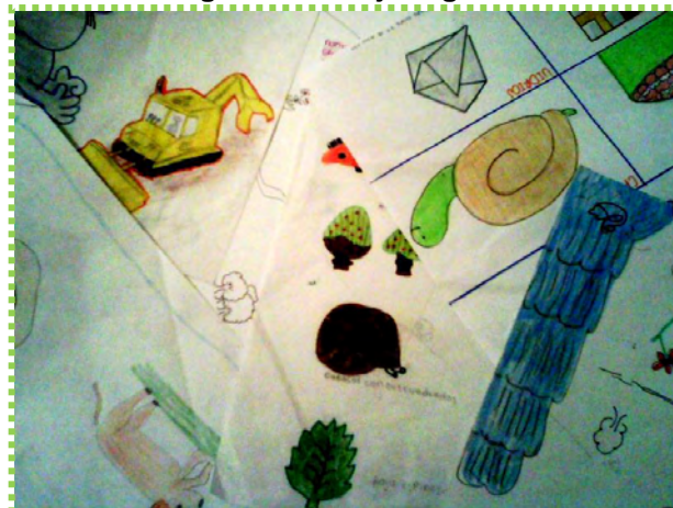
Figura 3. Dibujo Gigante