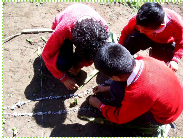
Figura 21. Creativos