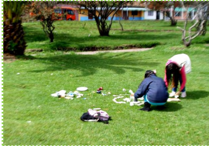
Figura 17. Espacios Cotidianos

del sabio “bricoleur”: con medios artesanales confecciona un objeto material que es al mismo tiempo objeto de conocimiento”. 19