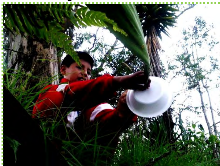
Figura 20. Travieso