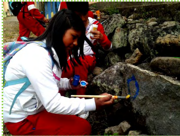
Figura 25. Señales en mi Camino

Fuente: Fotografía Pintura sobre piedras