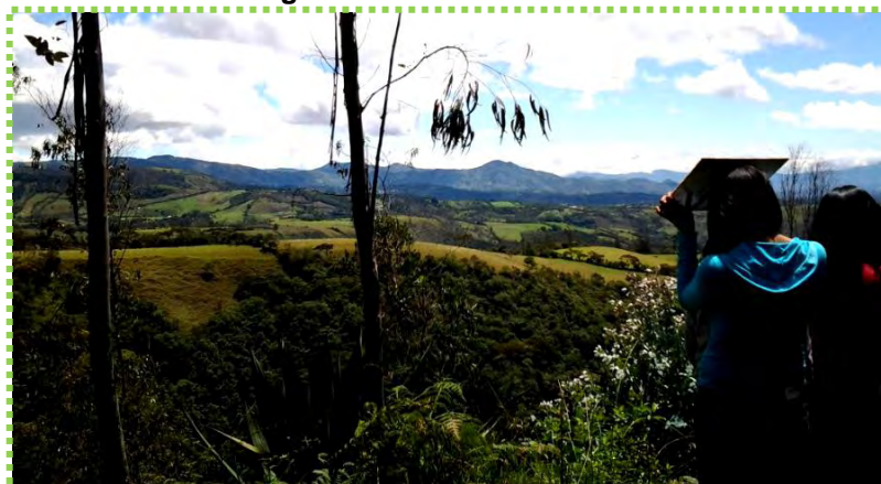
Figura 52. Vista al horizonte