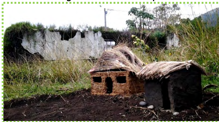
Figura 47. Casitas en Tapia