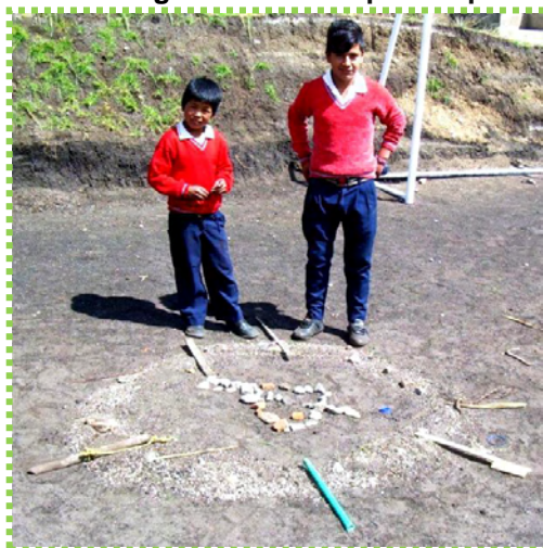
Figura 31. Libres para expresar