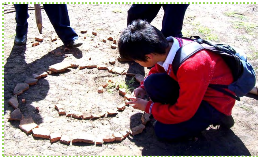
Figura 30. Vestigio