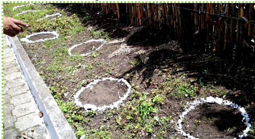
Figura 58. Aromáticas