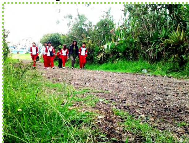
Figura 36. Confianza