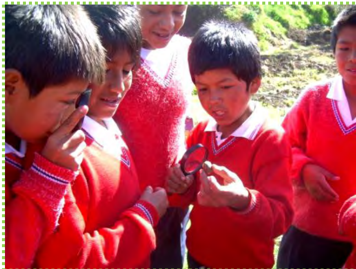
Figura 15. Niños Observadores

Fuente: Fotografía de observación detallada