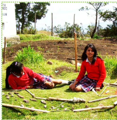
Fuente: Clases sobre la hierba

El enfoque pedagógico Waldorf ofreció un importante aporte en el sentido de que concibe las expresiones artísticas como un recurso didáctico fundamental. De acuerdo a esta perspectiva, en el proceso de formación de los niños y niñas, se debió considerar la observación como un elemento esencial dentro de la percepción a partir de las vivencias y experiencias de los estudiantes en su entorno natural.