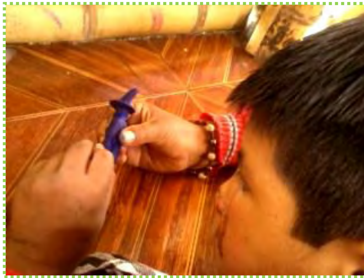
Figura 14. Manos Creativas

A causa de ello, tocar, ver, oír, oler y saborear como acciones derivadas del uso natural de los sentidos, implicaron que los niños y niñas participen de manera activa en estos procesos; más que los procesos directos de captación sensorial, es la interacción del niño con el medio natural lo que fomentó el interés por su región, por su creación y por supuesto por la vida.