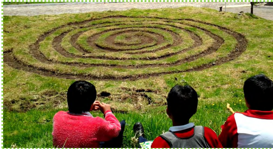
Figura 57. Huellas