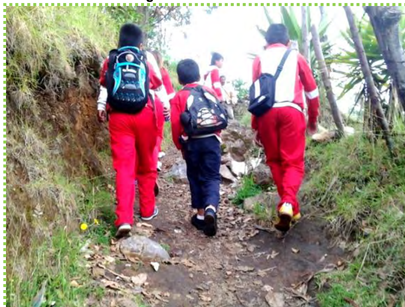
Figura 19. Caminantes