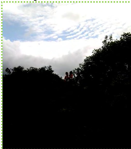
Figura 16. Frente al Cielo

Al mismo tiempo al salir del aula los estudiantes encontraron dicha relación en las nubes, el cielo, el agua, las montañas entre otros. Denotaron una actitud pasiva; quizá fue normal encontrarse frente a ellos pero antes tuvieron la oportunidad de observar y más aun apropiarse de lo observado. De esta manera representaron a través del dibujo algunos elementos de la naturaleza. Por ejemplo: dibujaron una hoja aplicando detalladamente su color, forma, tamaño y textura visual.