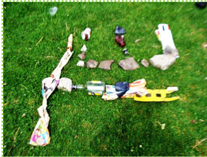
Figura 29. Instalación

Fuente: instalación con elementos arrojados en la plaza