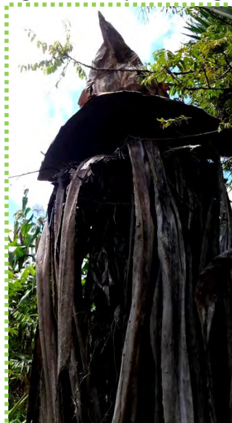
Figura 51. Pequeño Amigo

Cuidador, amigo del viento, el sol y el agua