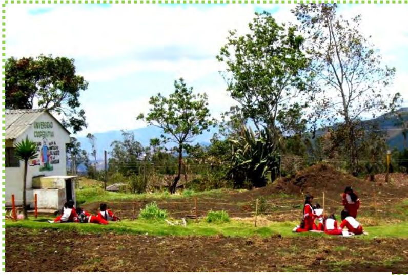
Figura 8. Día Soleado