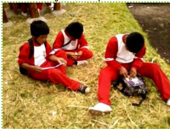
Figura 18. Tranquilidad