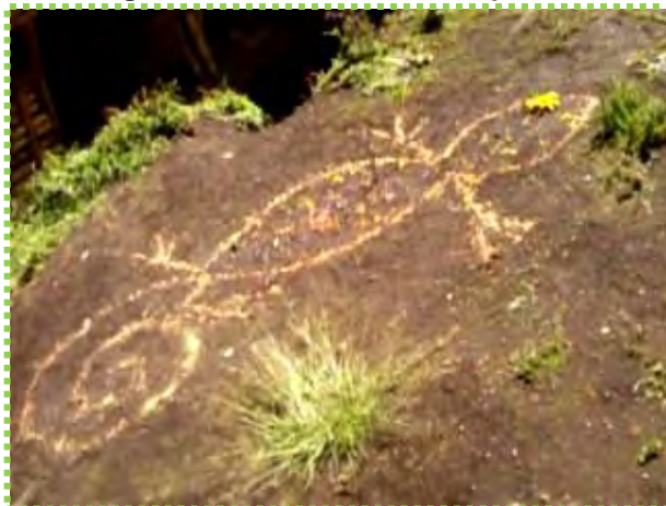
Figura 43. Acontecer de Sorpresas