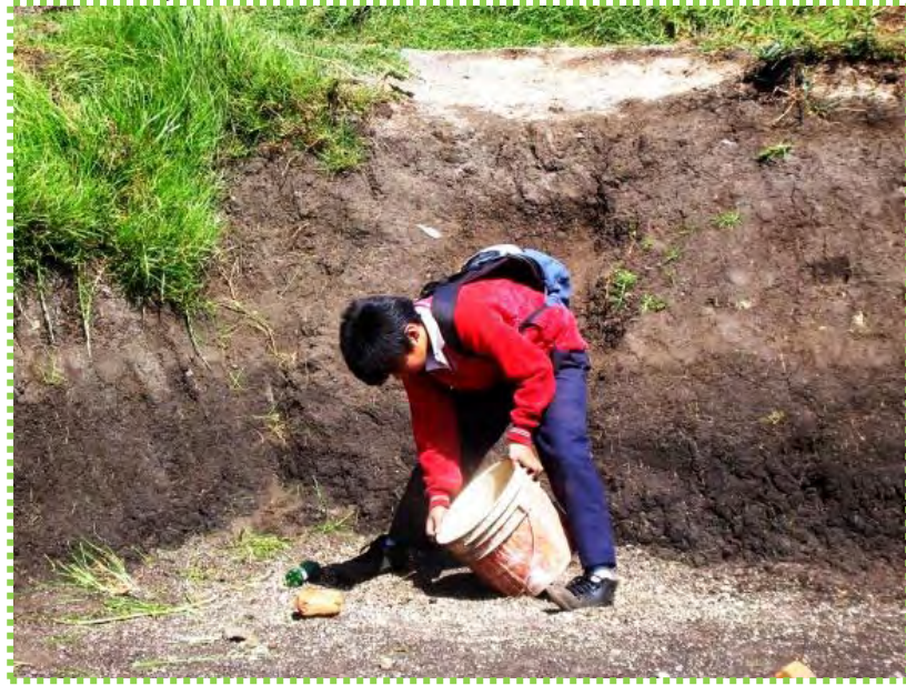
Figura 7. Cuando en mis bolsillos no alcanza

Fuente: Fotografía recolección de elementos