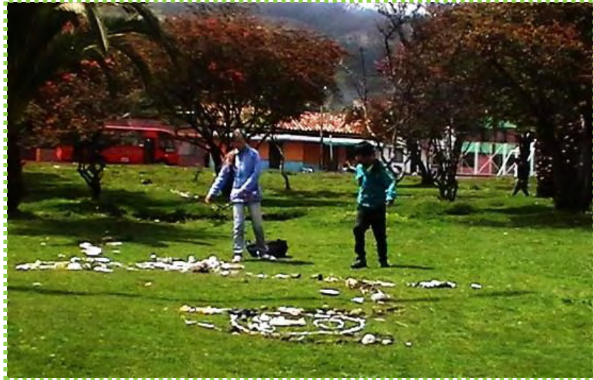
Figura 22. Intervención