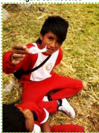
Figura 35. Insectos