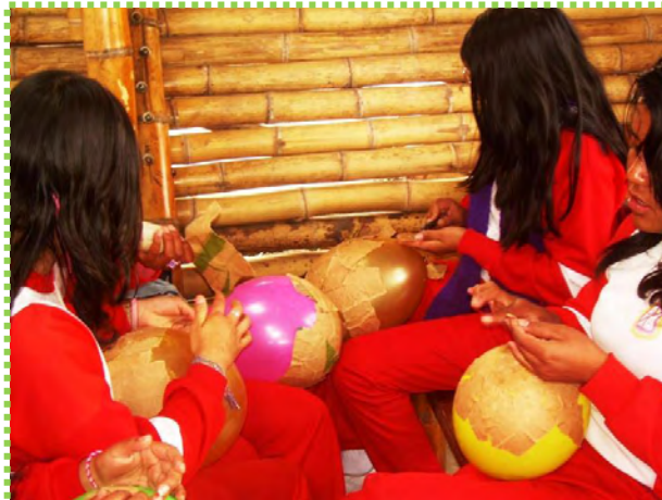
Figura 34. Destino, Rostro Ovalado