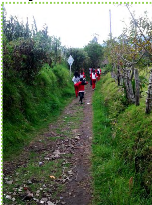
Figura 13. Camino Cotidiano