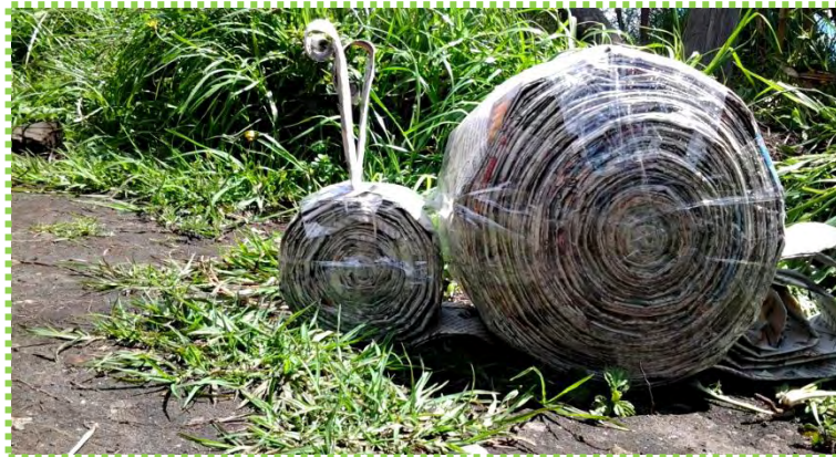
Figura 48. Caracol de Papel