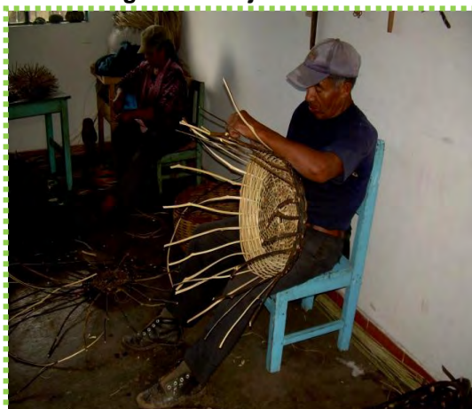
Figura 38. Tejido familiar