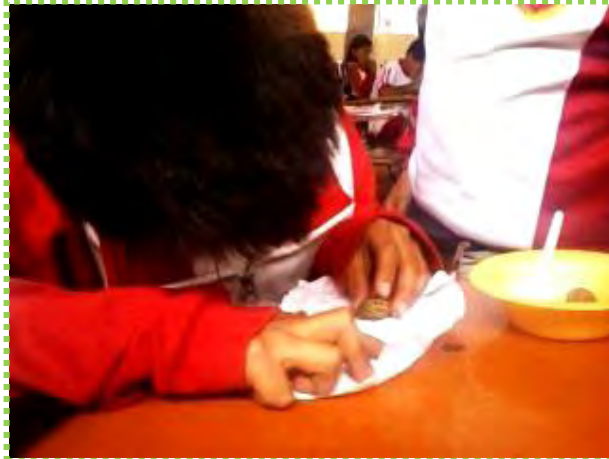
Figura 33. Semillas

naturaleza, llevando a los niños a efectuarlo posteriormente sobre la superficie de la tierra, la corteza de los árboles y en hojas de eucalipto, recurriendo a colorearlos a través de la extracción de pigmentos con distintas gamas provenientes de los tallos, semillas y flores.