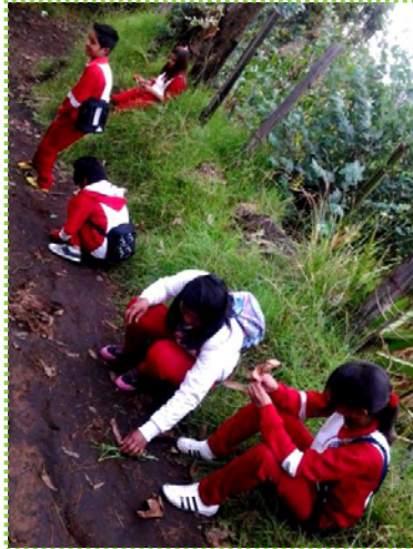
Figura 4. Entretenidos en el camino

Fuente: Fotografía recogiendo piedritas antes de clase