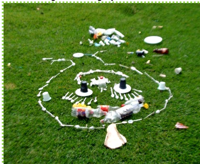
Figura 23. Lenguaje Plástico

Fuente: Fotografía Composición con material desechable en la plaza