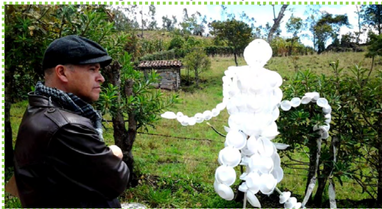
Figura 56. Mujer trabajadora