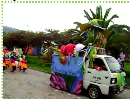
Figura 40. Fiesta de los Pueblos