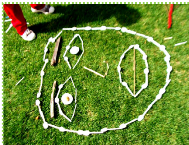
Figura 42. Gestos