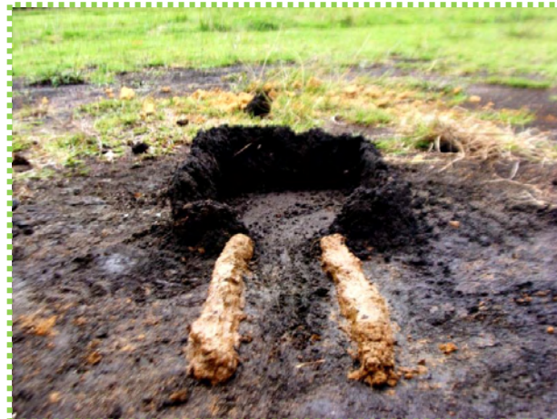
Figura 44. Casita de Colores