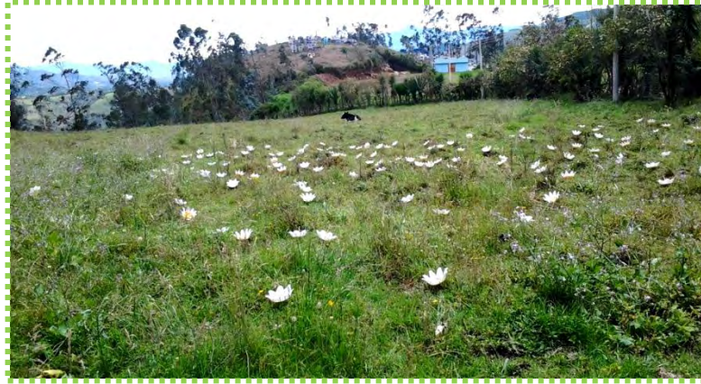
Figura 55. Flores de Plástico