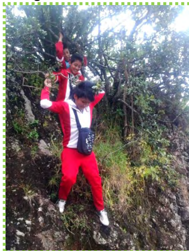
Figura 5. De risa en risa