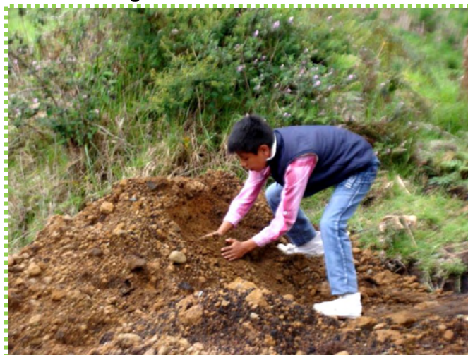
Figura 32. Tierra de colores.