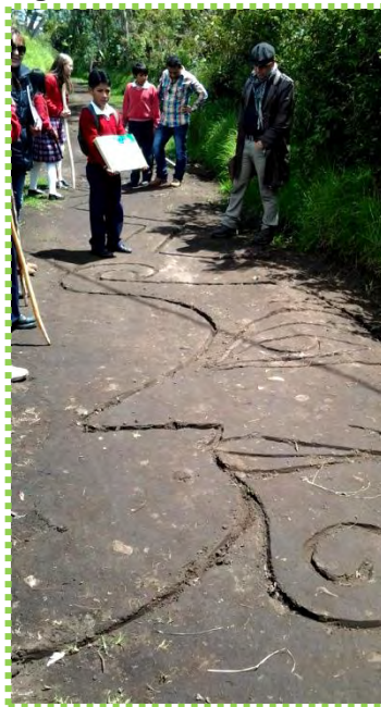
Figura 48. Hilos en la Tierra