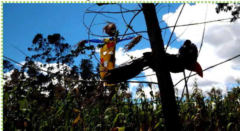
Figura 53. El Cuidador