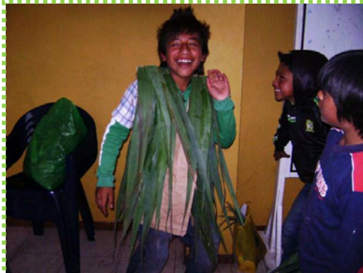
Figura 39. Imagen Natural