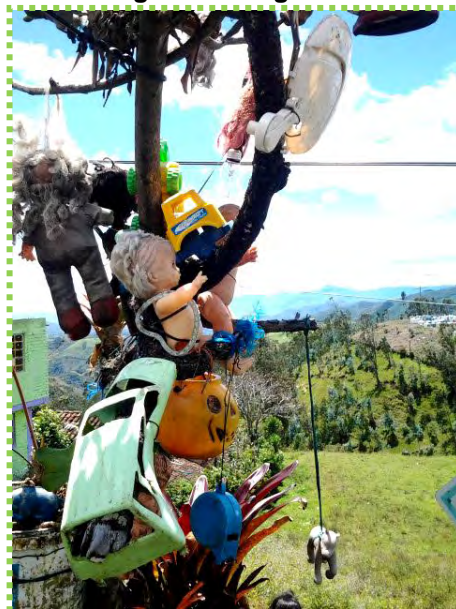
Figura 54. Juguetes