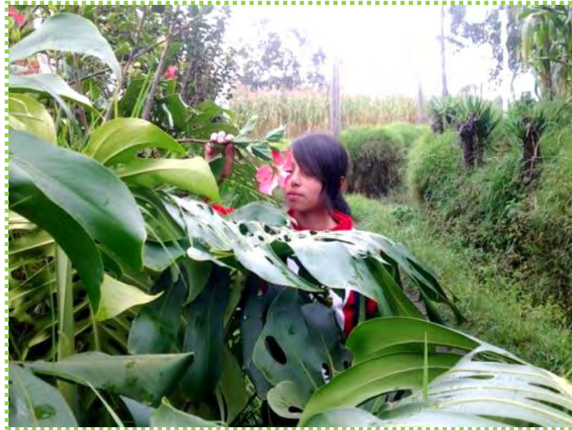
Figura 10. Perfume Natural