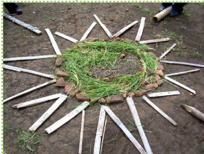
Figura 27. Dios Sol