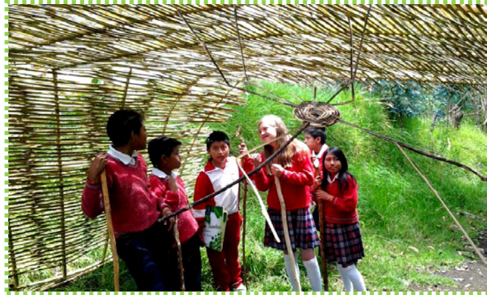
Figura 50. Tejiendo diálogos