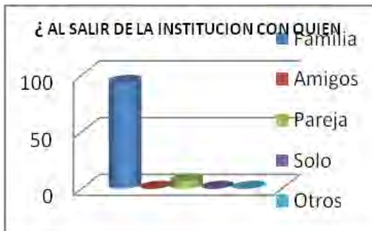
Figura No 2. Preferencias de apoyo

La mayoría de los adolescentes realizó un gran reconocimiento y considero la importancia de la presencia de la familia y vivir con ella en cuanto haya concluido su término de sanción.