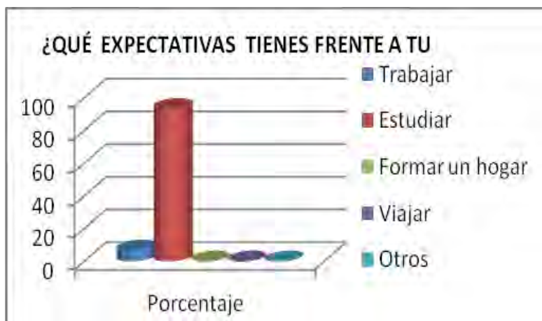
Figura No 1. Expectativas de proyecto de vida

Estudiar: Los resultados frente a esta expectativa son muy altos, no obstante se evidencia que.