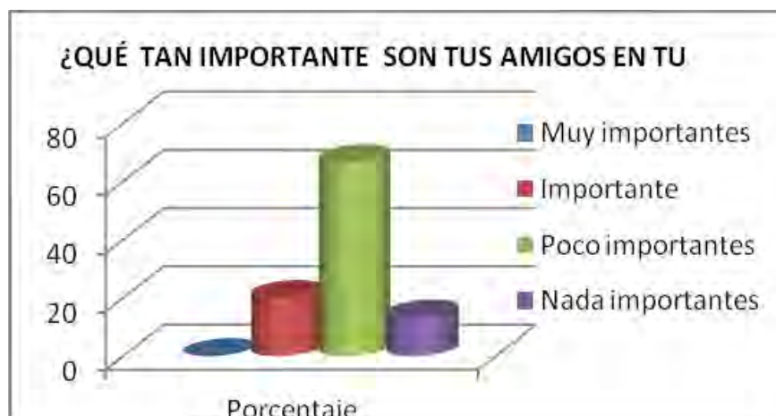
Tabla No 4. Importancia del grupo de amigos