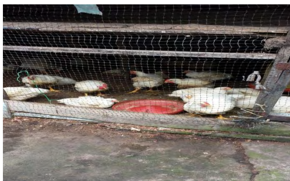
Figura 1. Unidad de negocio de venta y cría de gallina y marrano