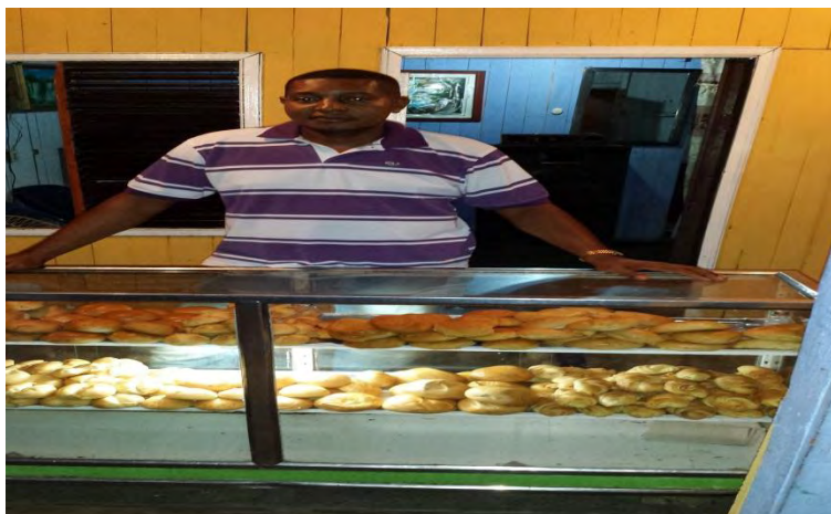
Figura 2. Unidad de negocio panadería

Para terminar este apartado es muy importante resaltar que todas las unidades de negocios mencionadas anteriormente, están totalmente legalizados ante cámara de comercio, al igual que sus asociaciones, lo que genera, una mayor facilidad, para el fortalecimiento de las mismas, ya que al solicitar ayuda a las diferentes entidades, este no sería un problema y se facilitaría todo el proceso.