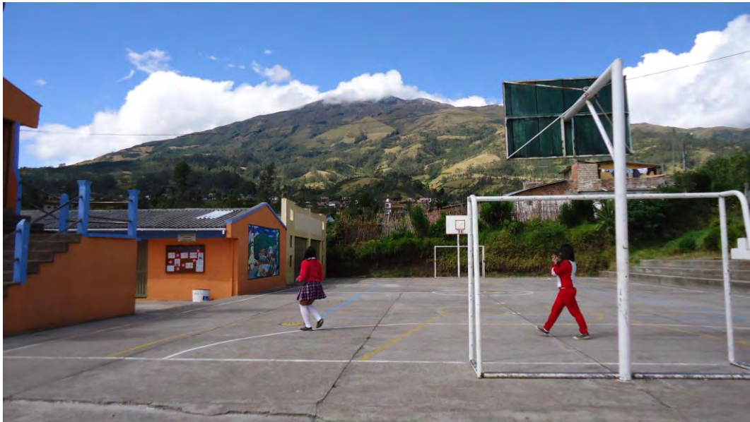
Figura 1. Institución educativa municipal Francisco de la Villota