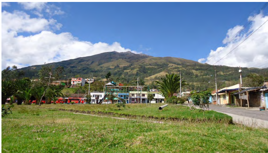
Figura 16. Plaza del corregimiento de Genoy

En este aspecto el 100% los docentes y directivos de la institución Educativa Municipal Francisco de la Villota afirman que los proyectos de este tipo de investigación por la complejidad del proceso, son a largo plazo y de los pocos resultados visibles afirman que su impacto trascendió solo a la población estudiantil en proyectos de vida.