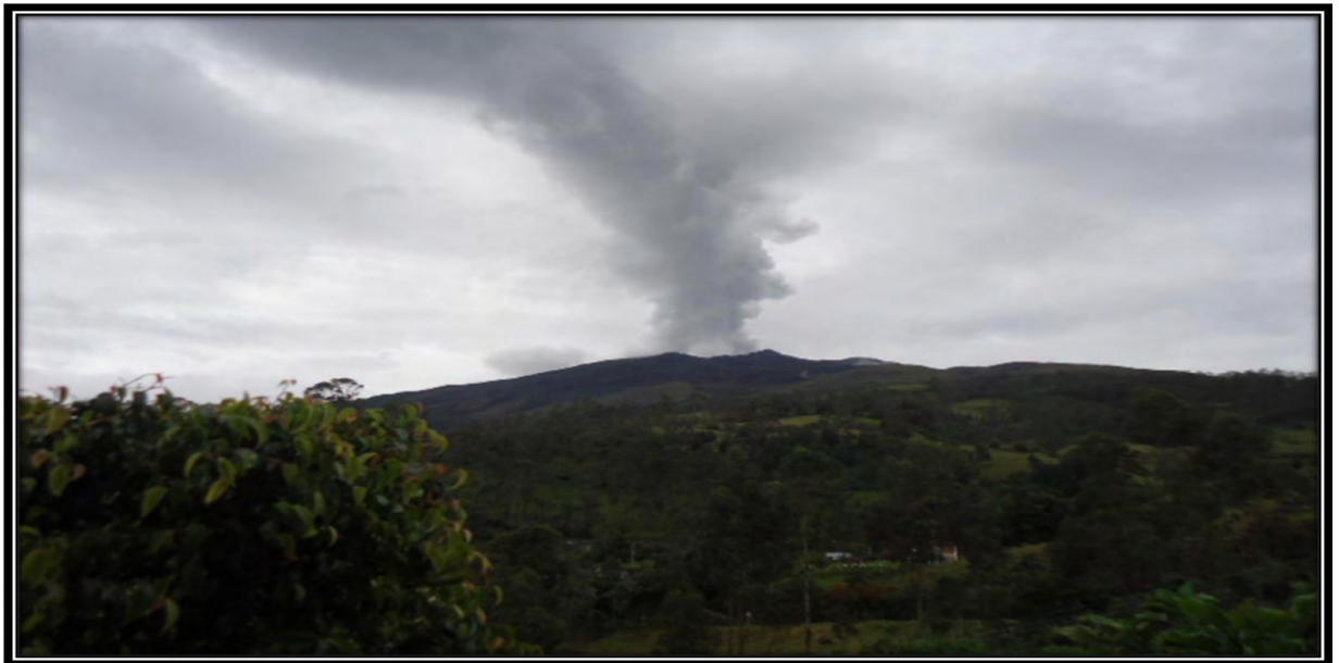
Figura 18. Planeación en gestión del riesgo para la IEM Francisco de la Villota, primaria

De acuerdo con todos los aspectos que se tuvieron en cuenta para plantear la cartilla que permita la iniciación de una cultura integral en gestión del riesgo.