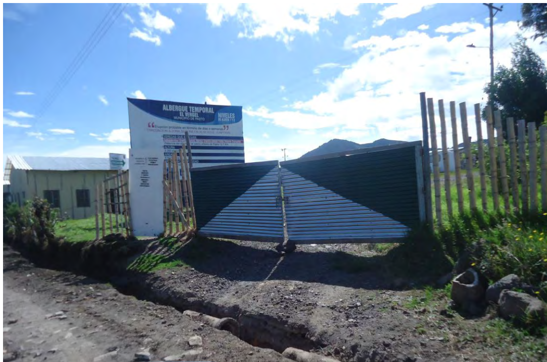
Figura 4. Albergue del corregimiento de Genoy el VERGEL

En este aspecto los estudiantes del grado quinto, un 100% están dispuestos a conocer más del tema; los estudiantes del grado noveno, un 90% están de acuerdo en conocer mucho mas del tema mientras un 10%, no, ve conveniente la importancia de la problemática, evidenciándose una negación de la amenaza en la región. Los estudiantes del grado once un 100%, creen importante conocer a profundidad del tema, para convivir con el fenómeno sin poner en peligro su vida y la de quien los rodea, es notorio que los últimos encuestados serán dentro de poco tiempo, los nuevos ciudadanos de la comunidad y saben que su territorio enfrenta graves conflictos, de igual manera no son ajenos de conocer que con el tiempo estarán al frente de una familia y buscarán lo mejor para ella. Sin tener la necesidad de generar incentivos para que se concienticen a la hora de salvaguardar la vida de la familia en los albergues.