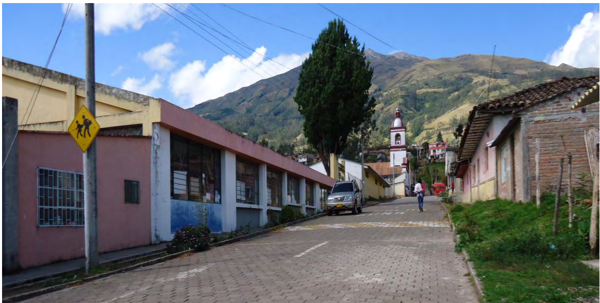
Figura 10. Institución Educativa Municipal Francisco de la Villota primaria

“No, porque yo he vivido muchos años en Genoy no ha pasado nada el volcán, hace muchas erupciones sin dañar a nadie y nosotros tranquilos” 13