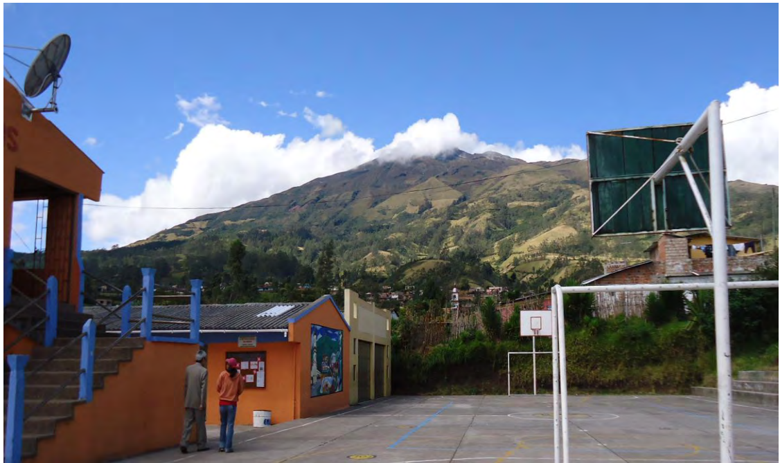
Figura 8. Institución Educativa Francisco de la Villota