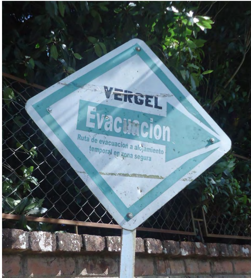
Figura 13. Señalización de evacuación hacia el albergue el Vergel