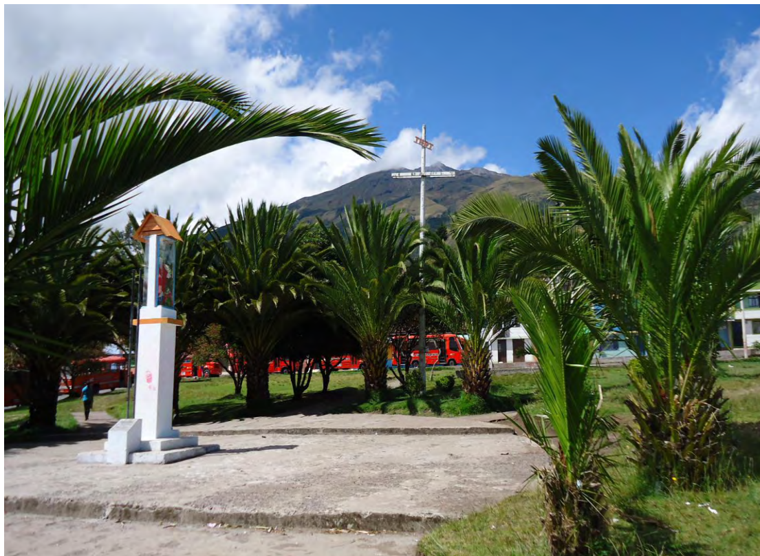
Figura 2. Plaza principal del corregimiento de Genoy