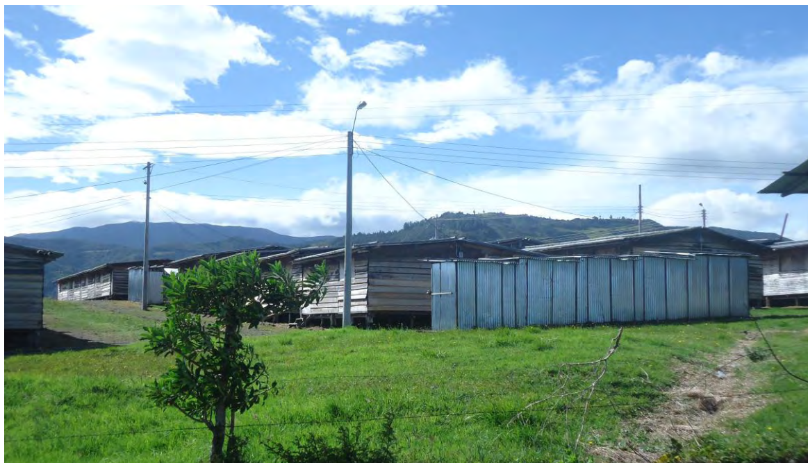
Figura 14. Vista interna del Albergue el Vergel

En el aspecto 5 con un 100% de los encuestados afirman que las capacitaciones recibidas por directivos docentes y docentes, se enfatizan en la reacción en caso de un evento volcánico, en efecto la reacción ante un evento volcánico está bien, pero hace falta más inversión para promover capacitaciones que permitan concertar problemáticas con la comunidad, como seminarios de resolución de conflictos o capacitaciones encaminadas, a encontrar soluciones de la creación de una cultura en gestión del riesgo, que hasta la fecha ninguna entidad no ha realizado. El primer pasó para la construcción de cultura en gestión del riesgo con enfoque prospectivo concertado las soluciones con la comunidad.