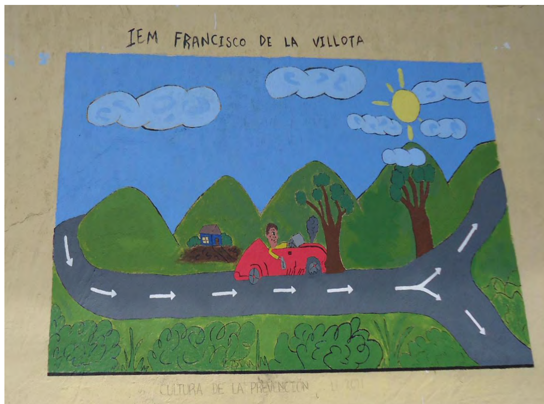
Figura 7. Mural pintado por los estudiantes del grado once en la casa del cabildo.