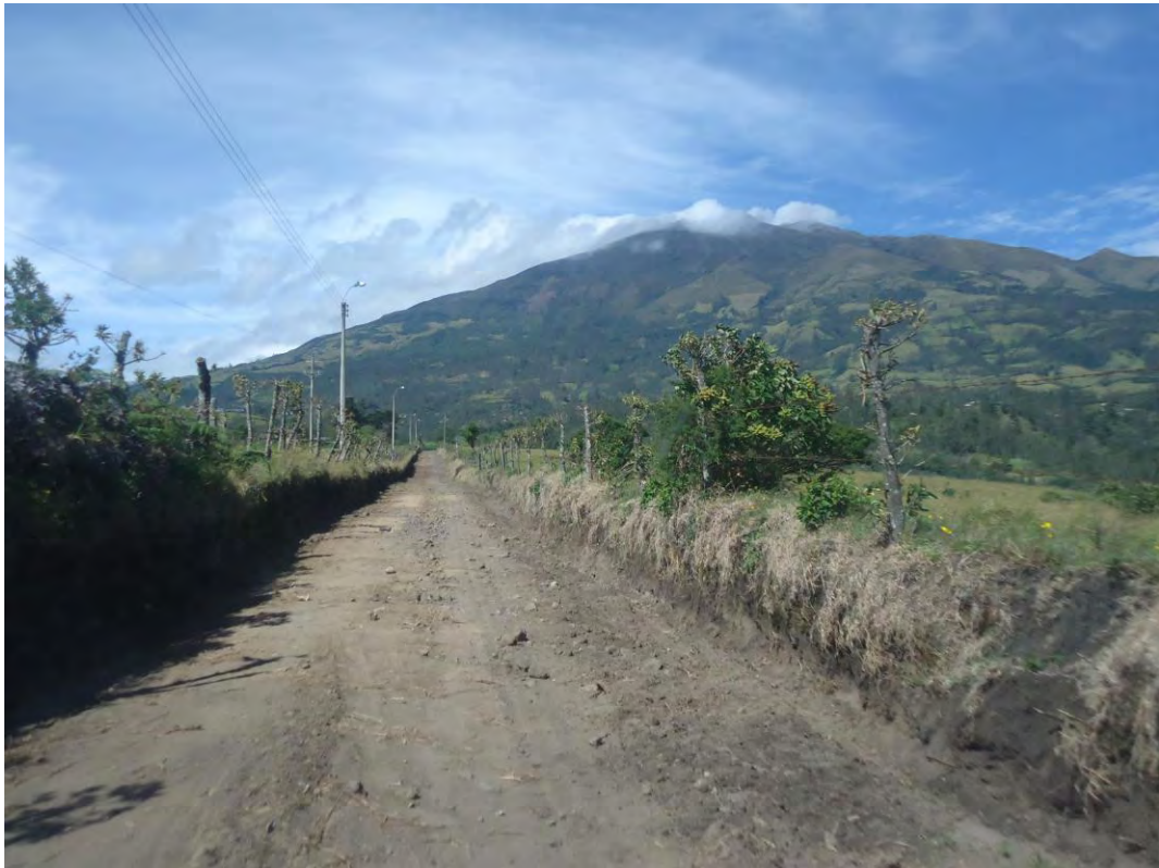
Figura 17. Vista del Volcán desde el Albergue el Vergel