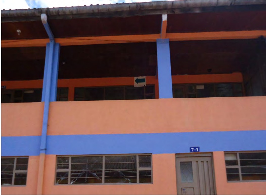
Figura 5. Institución Francisco de la Villota secundaria Genoy