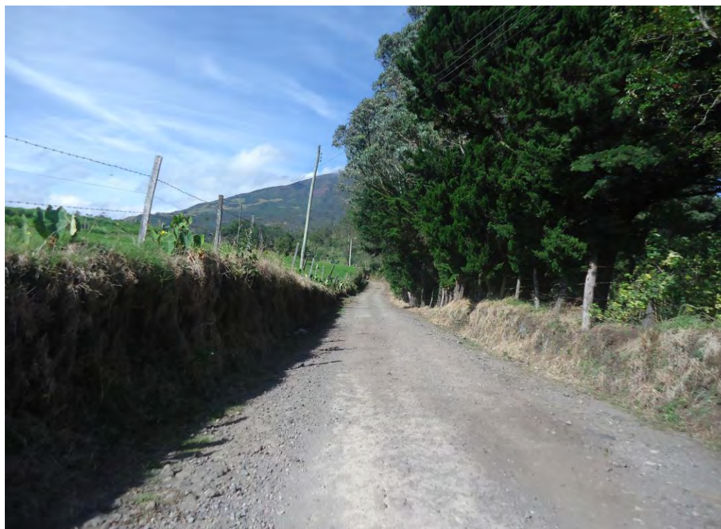
Figura 6. Camino Principal hacia el albergue el VERGEL