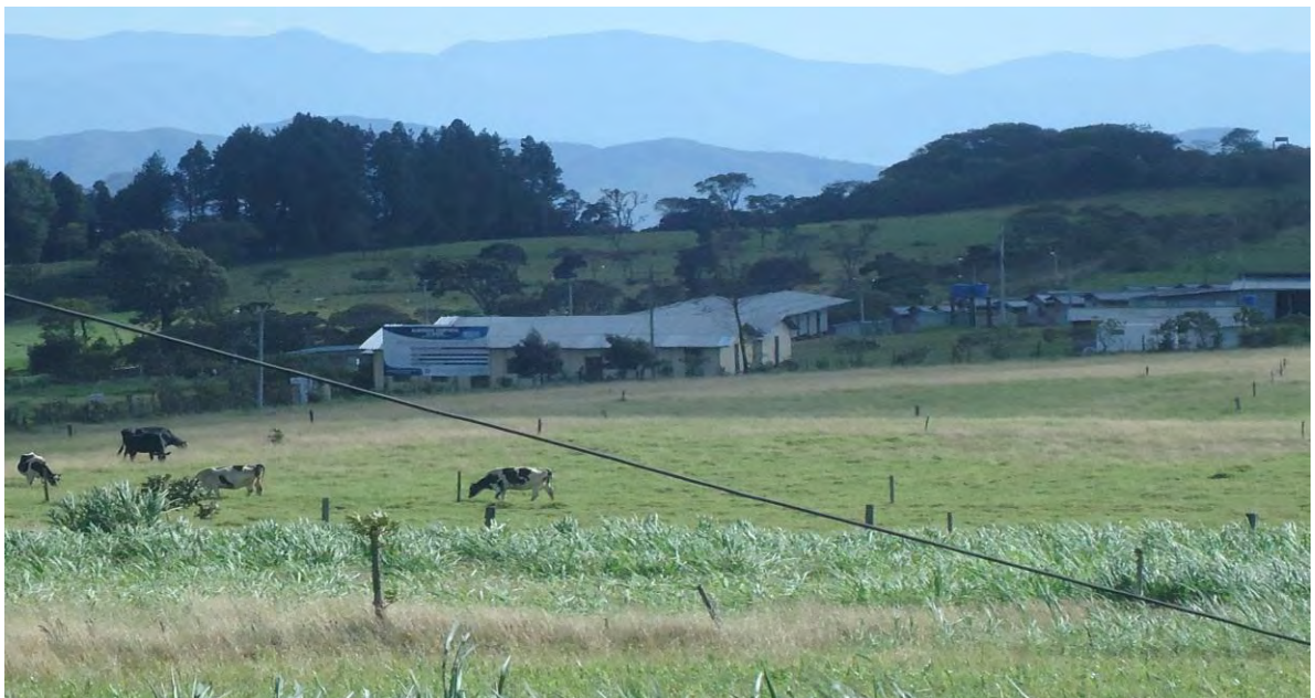
Figura 15. Albergue el Vergel