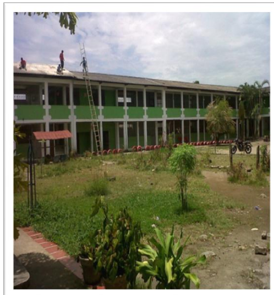
Grafica 4. Institución Educativa la Libertad