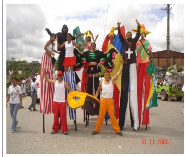
Grafica 3. Encuentro cultural colombo Ecuatoriano