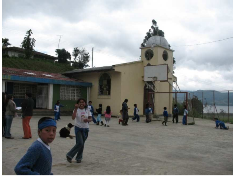
Figura 21. Escuela Rural Mixta Romerillo