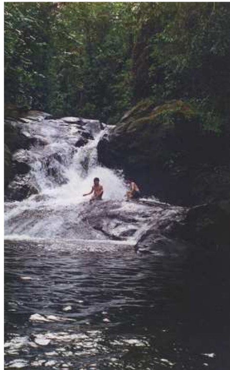
Figura 26. Simbología.

golpeando de puerta en puerta pedían se les regalase un pilche (totuma o mate) con agua, nadie respondía a su llamado hasta cuando se encontraron con un niño a quien engañaron con la entrega de un pedazo de pan, logrando el pilche con agua. Los dos enamorados, amancebados según el decir de las gentes del sector, se acostaron para hacer el amor en un potrero cercano y dejando el pilche con agua a sus pies, en el clímax de su emoción, el hombre rego el agua.