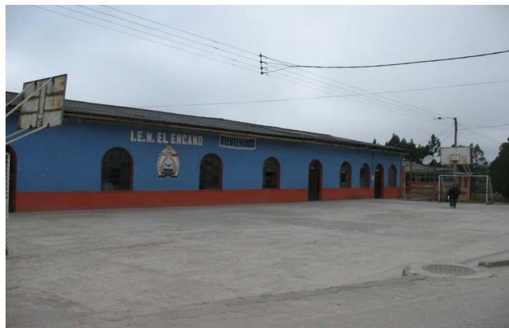
Figura 16. IEM El Encano

De las diferentes escuelas del Corregimiento egresaban muchos estudiantes que terminaban sus estudios de básica primaria, pero por falta de recursos económicos no podían continuar sus estudios secundarios ya que debían desplazarse hasta la ciudad de Pasto o a la localidad de Sibundoy, sólo unos cuantos lo podían hacer.