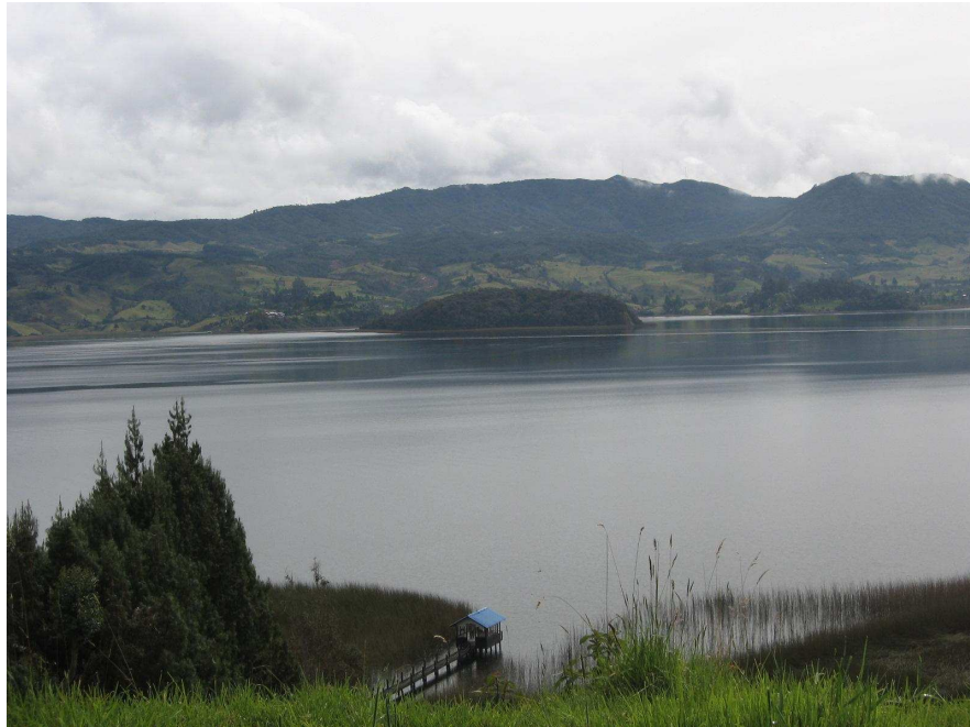
Figura 1. Panorámica de La Cocha.

“El alma no puede pensar sin imaginarios” ARISTOTELES