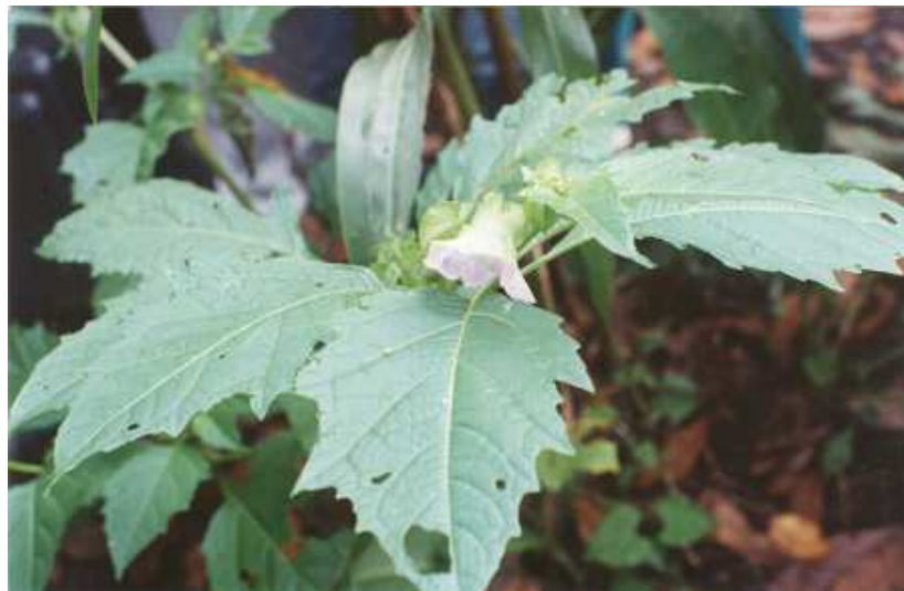
Figura 11. Flora de La Laguna.

El mirador, camino de la Danta, los Helechos, Floralia, Casa del Búho, Refugio Cristalino, Buena Vista, El Vicundo, Casa del Duende, Altamira, Rumi-Indi, Frailejón, La Campiña, La fauna, La Esperanza, Arrayanes, Los Laureles, Planada del Guamuez, Betania, Colombia Verde, Las Palmas, Tunguragua, El Salado, Encano Andino, Bellavista, Camino del Viento, El Rinconcito y Renacer.