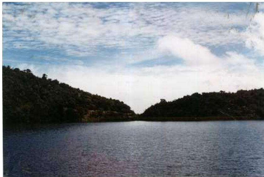
Figura 28. Vertiente natural.

Sin hablar del aspecto recreativo, cultural y lúdico que representa el agua de La Cocha, sin embargo esta es la que sostiene y alimenta a muchas familias de la región. El origen de la vida fue en el agua, y dentro del mar como seres anaeróbicos ya que en principio no había aire respirable. Aun cuando se viva fuera de ella todos consumimos agua a diario, sin detenernos a pensar de la importancia para nuestro organismo. Nada menos que el 80% es agua. En un principio, nuestro planeta estaba constituido solo por agua, que cubría las masas de la tierra. La vida, entonces, surgió del agua. El agua es la sustancia más abundante sobre la tierra y constituye el medio ideal para la vida. Cada océano, laguna, río, posee su propia flora y fauna adaptada a vivir ahí. El agua es esencial para todos los seres vivos que habitan este planeta, porque forma parte, en mayor o menor proporción de la constitución de cada uno de ellos.