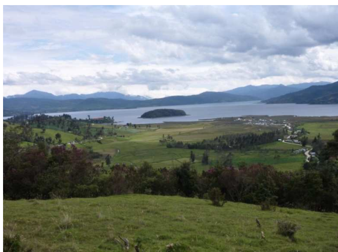
Figura 5. Perfil de La Cocha.

El Encano por poseer La Laguna o Lago Guamuez y por sus propias características, es considerado reserva ecológica e hídrica, además está formado por zonas de pantano o turberas y páramo azonal.