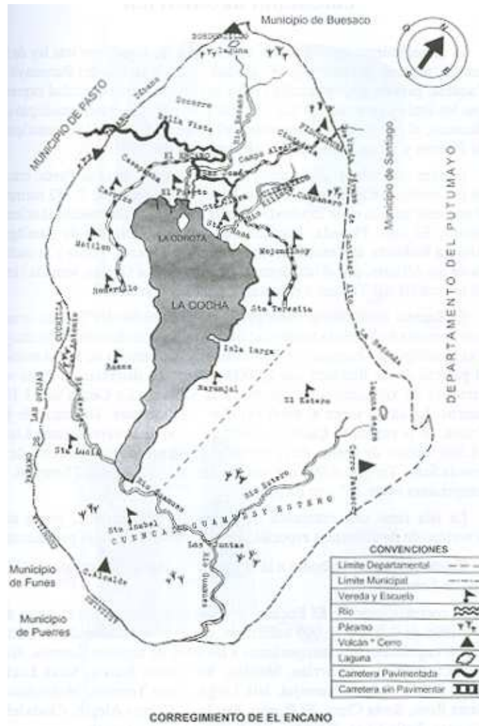
Figura 4. Mapa corregimiento de El Encano