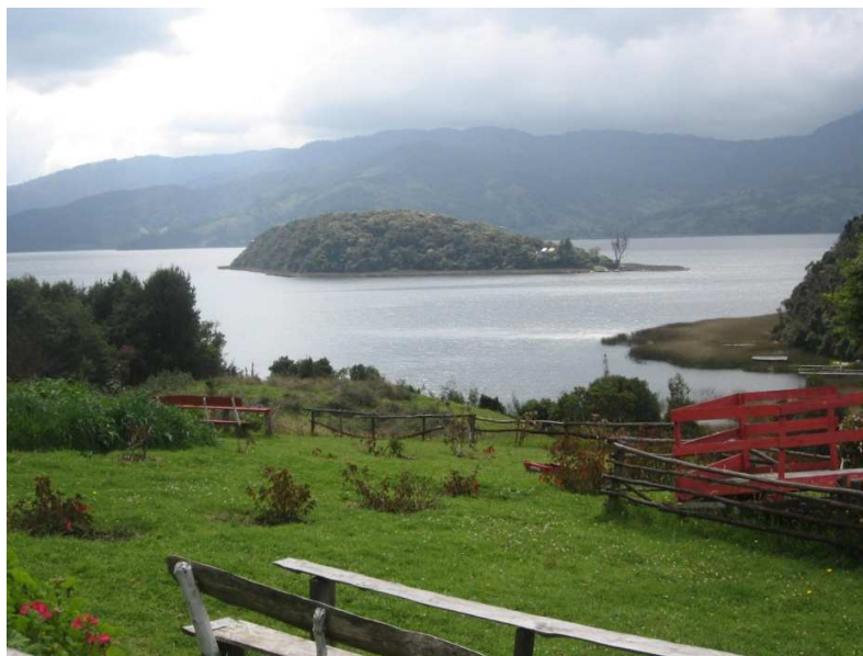
Figura 12. Capilla en La Corota.

Cabe destacar que la capilla, para la Virgen fue construida en un lugar sagrado para los indígenas: La Corota, siempre fue un lugar de adoración y de veneración por parte de los Mocoas, e igualmente Heriberto Hidalgo Meza señala: