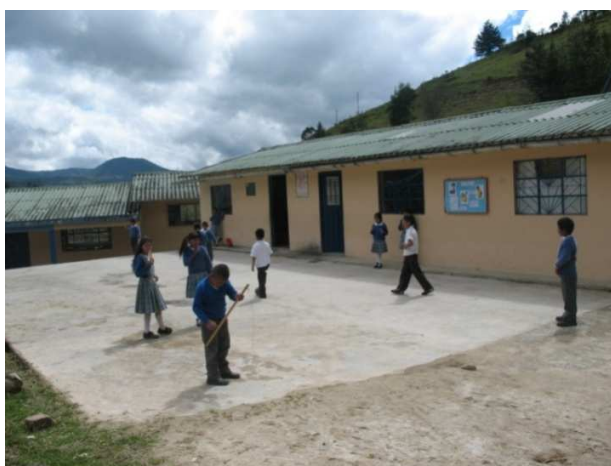
Figura 18. Escuela Rural Mixta El Carrizo