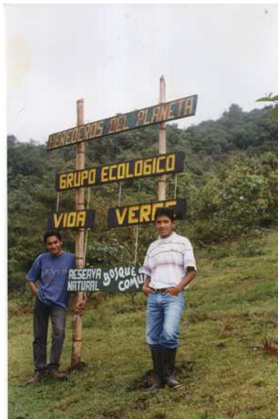
Figura 30. Proyectos de la región.

Cuando se dialogó con estudiantes, padres de familia y habitantes de la región en referencia al agua y otros recursos, ellos coincidían en afirmar que desde 1980, la Asociación para el Desarrollo Campesino (ADC), ha gestado un proceso de defensa y apropiación del territorio para familias campesinas en el corregimiento El Encano, municipio de San Juan de Pasto, capital del Departamento de Nariño en Colombia; proporcionando soluciones a los problemas agrícolas de la región para mejorar su comprensión acerca de los principios ecológicos y agro ecológicos de la agricultura, estableciendo áreas exclusivas para la protección de ecosistemas estratégicos en el pie de monte Andino amazónico conformada por selva húmeda alto andino, páramo zonal y páramo azonal, contribuyendo a la conservación tanto de fuentes hidrográficas que surten la cuenca alta del río Guamuez como al espejo de agua que se forma sobre la cuenca conocida como Lago Guamuez o Laguna de la Cocha. La Cocha ha sido declarada Humedad de Importancia Ramsar por iniciativa popular. Además argumentan que los nacimientos de agua presentes en las Reservas han sido protegidas mediante iniciativas de reforestación y regeneración natural, haciendo que las reservas cuenten con una fuente de agua abundante, gratuita y limpia para el consumo humano y para apoyar sus sistemas de producción.