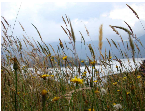
Figura 32. La Cocha, paraíso terrenal.

La mitocrítica persigue, el ser mismo de la obra mediante la confrontación del universo mítico que forma el “gusto” o la comprensión del lector con el universo mítico que emerge de la lectura de una obra determinada. Evidencia, en un autor, en la obra de una época y de un entorno determinado, los mitos directos y sus transformaciones significativas. Permite mostrar cómo un rasgo de carácter personal del autor, pero también a alcanzar las preocupaciones socio histórico – culturales.