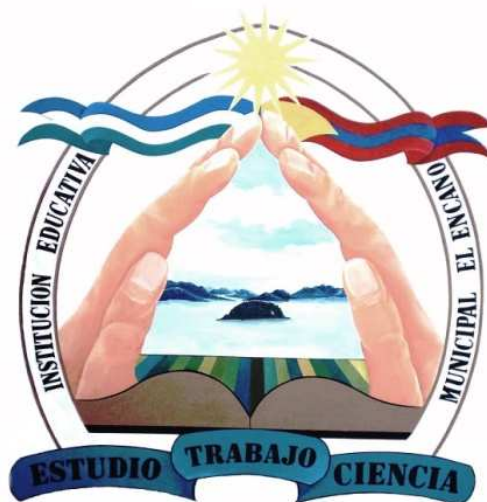
Figura 14. Escudo IEM El Encano