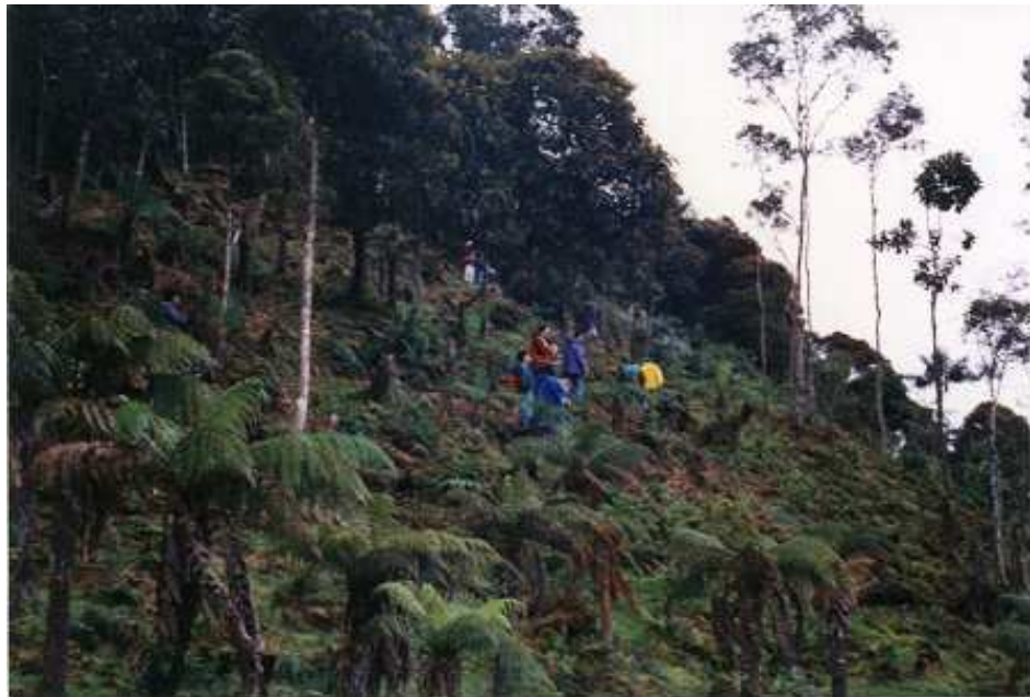
Figura 2. Humedales de La Cocha.

Paulatinamente, se va percibiendo la trascendencia cultural y socio histórico de La Cocha y de todo el entorno que conforma el corregimiento de El Encano.