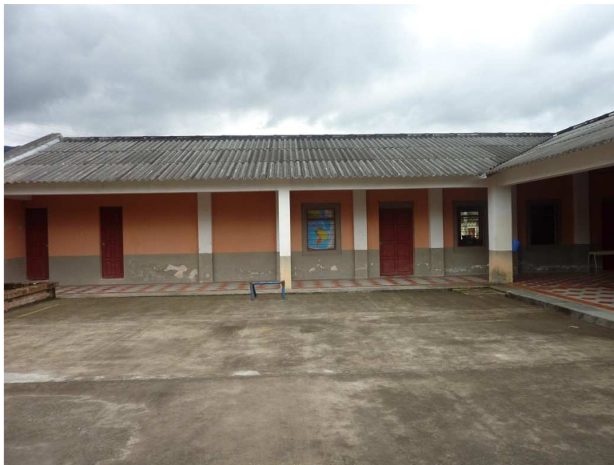
Figura 22. IEM El Encano

El mundo educativo, es el espacio donde la institución escolar y los educadores proponen a los alumnos diferentes metas hacia la actividad intelectual, esta distinción es fundamental, porque la presencia de la fantasía apoya la construcción de proyectos académicos. La representación mediante teorías compete con todas las demás creaciones de la imaginación; es una entre las muy diversas formas de imaginar y representar.