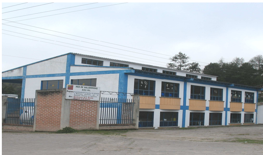
Figura 17. Escuela Integrada El Encano