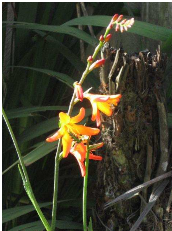
Figura 8. Flora de La Cocha.

Esta isla fue declarada por el gobierno nacional en 1.977 como “santuario de flora y fauna”. Es un pequeño paraíso de bosque nublado donde en tiempos milenarios fue sitio de adoración de los indígenas quillacinga y hoy se conservan especies de flora y fauna de gran importancia. La Corota cuenta con un sendero de 500 metros de largo que atraviesa la isla de lado a lado entre el denso bosque. Bajo una bóveda de árboles simétrica como un rompecabezas, se encuentran plantas de arrayán, anturios, caucho, el paloerosa, sietecueros, motilones silvestres, tinto cuyos frutos se utilizaban para teñir telas, orquídeas y helechos que completan un hermoso cuadro natural.