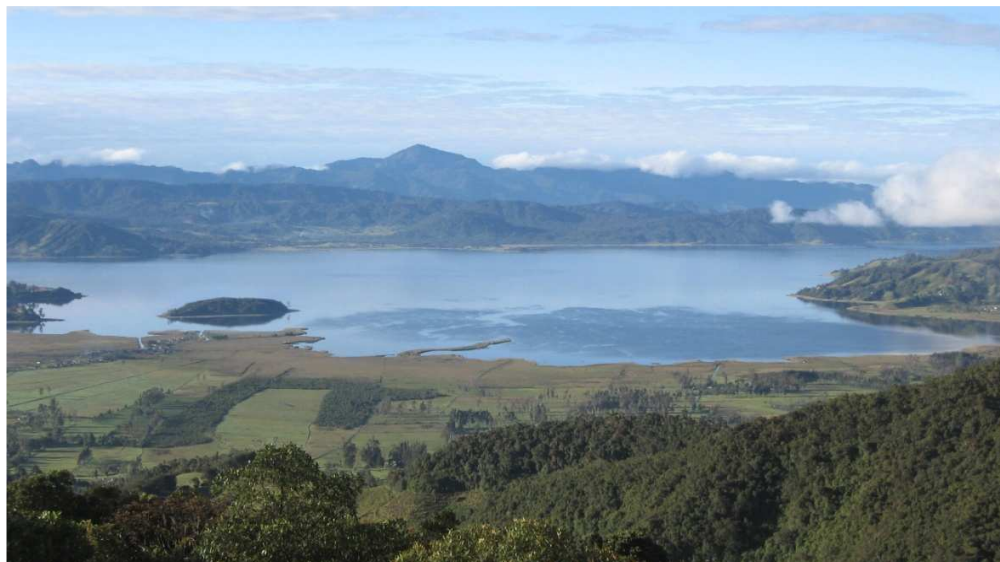
Figura 27. El agua y su creación.

Se dice que el agua es el componente más abundante de la superficie terrestre: ocupa aproximadamente sus tres cuartas partes, y constituye entre el 50 y el 90% de la masa de los organismos vivos, se le considera el disolvente universal.