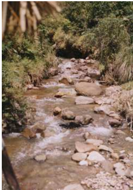
Figura 29. Aguas cristalinas.

El uso que se hace del agua va en aumento en relación con la cantidad de agua disponible. Los seis mil millones de habitantes del planeta ya se han aducido del 54 por ciento del agua dulce disponible en ríos, lagos y acuíferos subterráneos. En el 2.025, el hombre consumirá el 70 por ciento del agua disponible. Esta estimación se ha realizado considerando únicamente el crecimiento demográfico. Sin embargo, si el consumo de recursos hídricos por cápita sigue creciendo al ritmo actual, dentro de 25 años el hombre podría llegar a utilizar más del 90 por ciento del agua dulce disponible, dejando solo un 10 por ciento de especies que pueblan el planeta.