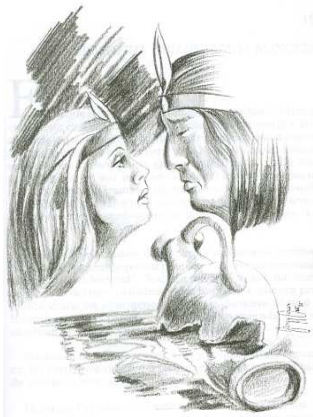
Figura 24. Mito y agua templos de vida

El Cacique Pucara (Fortaleza) enamorado como estaba de la princesa Tamia (Lluvia de estrellas), logro por fin conquistarla y formar con ella un lindo hogar donde nacieron tres preciosos párvulos: Chasca (Lucero), Coyllur (Estrella) y Waira (Viento). Los cinco vivían muy felices en ese Valle de los Andes que albergaba a siete descollantes ciudades, según testimonio tradicional de los viejos pobladores del sector.