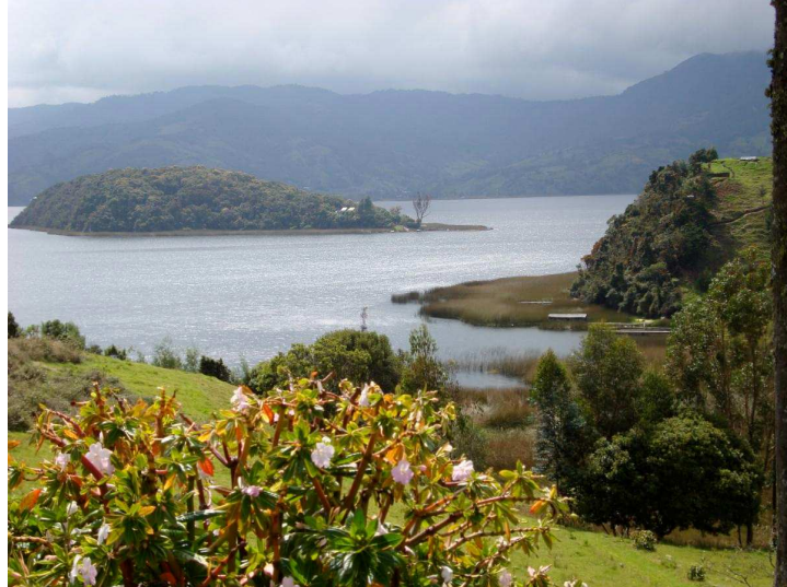
Figura 9. Biodiversidad de La Cocha.

El Encano es uno de los lugares privilegiados en cuanto a lo ambiental se refiere, puesto que hace parte del ecosistema andino amazónico del Guamuez y por tal razón posee una gran biodiversidad que se manifiesta en: La Laguna del Guamuez; (Cocha); los páramos a sonales a 2.700 m.s.n.m, siendo los únicos que están a esta altura, ya que: