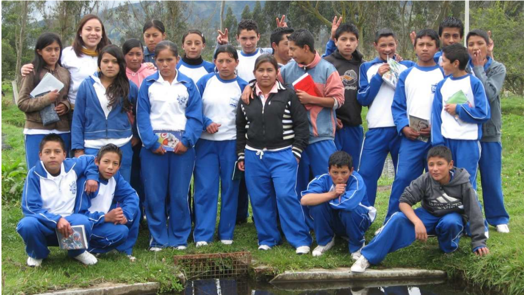
Figura 23. Estudiantes gestores del proyecto.

El trabajo como investigadores en el campo de la etnoliteratura, fue crear espacios en la institución educativa que permitan generar otros conocimientos acerca del mundo ancestral realizando un intercambio cultural entre generaciones para que se desarrollen y fortalezcan los imaginarios etnoculturales; permitir que los niños desarrollen habilidades para la vida, para la convivencia democrática y la solución pacífica de conflictos, de gestión escolar basada en la participación comunitaria, orientarlos hacia la importancia de la lectura, la escritura, la oralidad, la interpretación de los mitos, las leyendas, los cuentos tanto del pasado, como del presente, para que se fortalezcan y se proyecten hacia los nuevos senderos de la literatura del mañana.