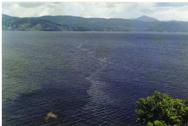
Figura 6. Rio Guamuéz

La capacidad del Lago Guamuez se estima en 1554 millones de metros cúbicos, cantidad que ubica a La Cocha como una de las mayores reservas hidrológicas del país. La Cuenca del lago hace parte de la vertiente amazónica, destacándose los páramos: Bordoncillo, Tábano, Campanero, Motilón, Patascoy, Casanare y Siquitan o Chimbalan. En las depresiones de estas elevaciones paramunas y montañosas se originan numerosos desagües, ríos y quebradas; vertientes que alimentan el lago. El río El Encano que nace en el páramo de Bordoncillo es el más importante por su caudal y por cruzar una zona poblada que lleva su nombre. El río Santa Lucía nace en las montañas de Casanare y desemboca en el lago, cerca al río Guamuez, este último recorre el sur y se convierte en el más grande afluente del río Putumayo. Las quebradas son: Quilinsiyaco, Santa Rosa, Mojondinoy, Laurel, Funduyaco, Jalupamba, Llanupamba, Corral, Afiladores, Ramos, Romerillo, Turupamba, Motilón y Estero.