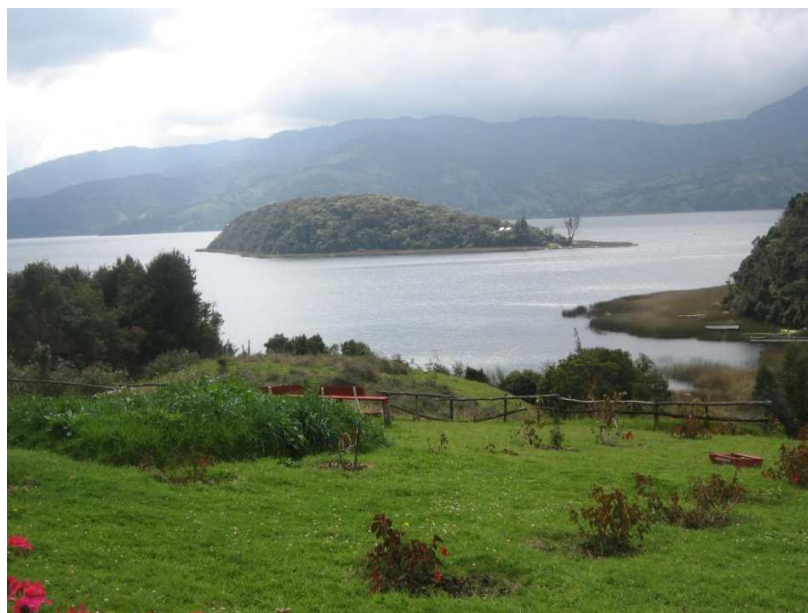
Figura 7. Imponente Laguna de La Cocha.

También se constituye en el lugar apropiado para especies de aves residentes y migratorias provenientes del norte y del sur del continente. Cuenta la Cocha con una diversidad florística y además sus páramos y humedades son captadores y reguladores del caudal del rio Putumayo. De igual manera las culturas indígenas de la región y las comunidades campesinas, consideran a La Cocha como el principal elemento del paisaje de la región y como fuente que aprovisiona alimentos.