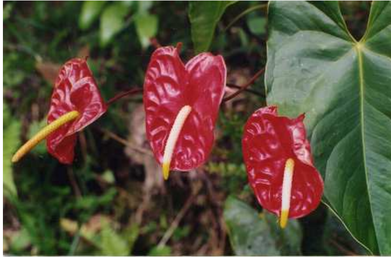
Figura 10. Encanto floral del Encano.