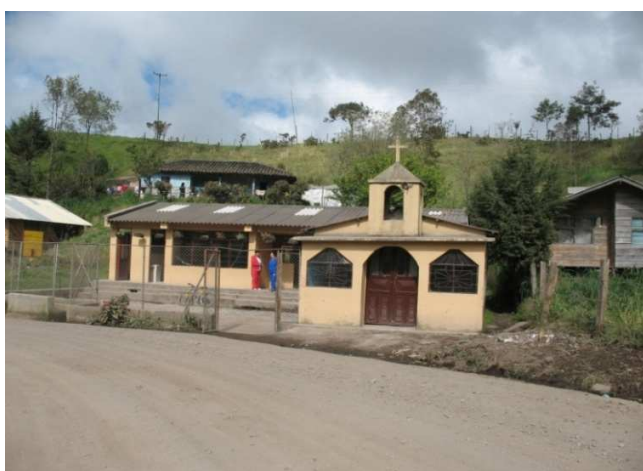
Figura 19. Escuela Rural Mixta Campo Alegre.