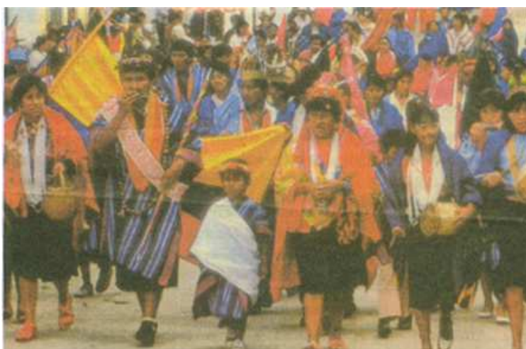
Figura 3. El Encano su historia, testimonios y leyendas.

“el vocablo Quillacingas parece que fue impuesto a estos habitantes por los conquistadores incas y quería decir, según la relación, oro en las narices, y según otros, narices de luna por su adorno en forma de luna, parecido al yacametzli de los mexicanos, que se ponían en la nariz” 3