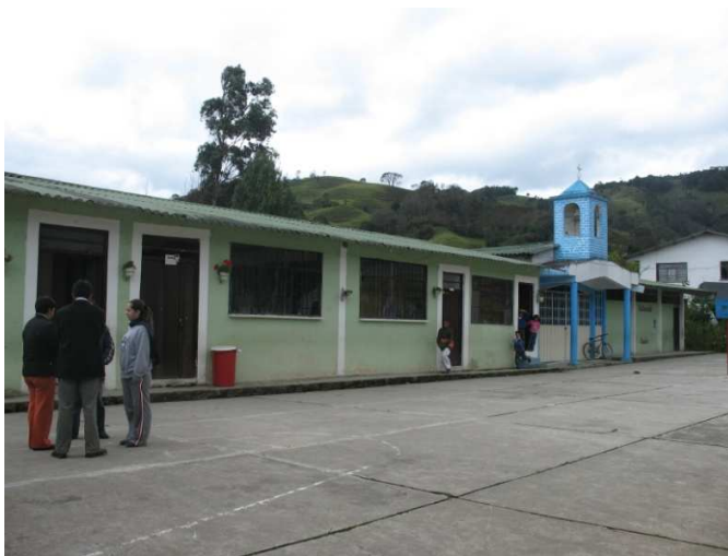
Figura 20. Escuela Rural Mixta El Motilón