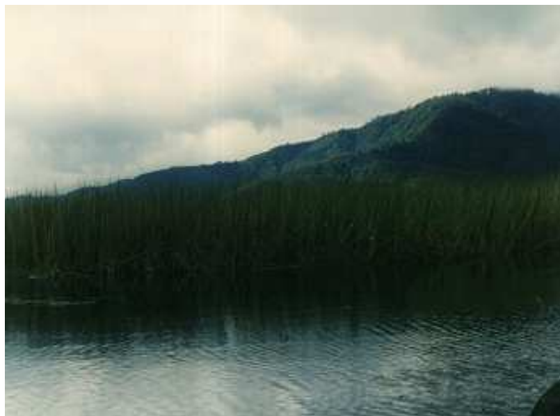
Figura 31. Recursos innatos.

Los habitantes, decían -nos hemos unido mancomunadamente para proteger, cuidar y prevenir nuestros recursos; por ello, son nuestros, nos pertenecen y no vamos a dejar que nadie se apodere, o se los lleve como el caso de el agua, que tanto trabajo nos ha costado para conservarla, y no sería justo que políticos oportunistas que ni siquiera han colaborado en los proyectos de la región, hoy se acuerden que existimos y que tenemos una importante reserva; que la catalogamos como el más grande patrimonio que Dios nos regalo: La Cocha-