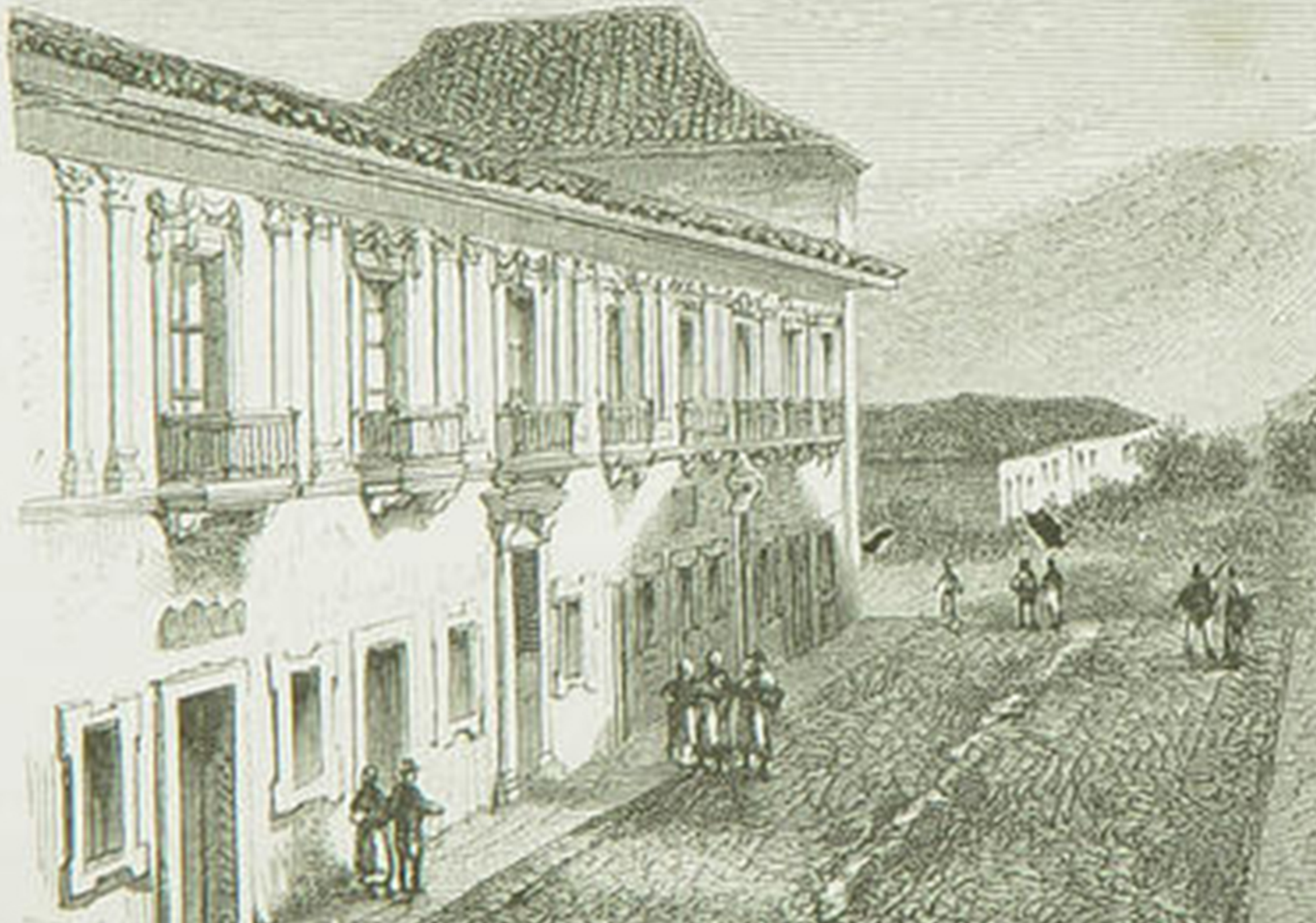
Una calle de Pasto. Edouard André, 1876.