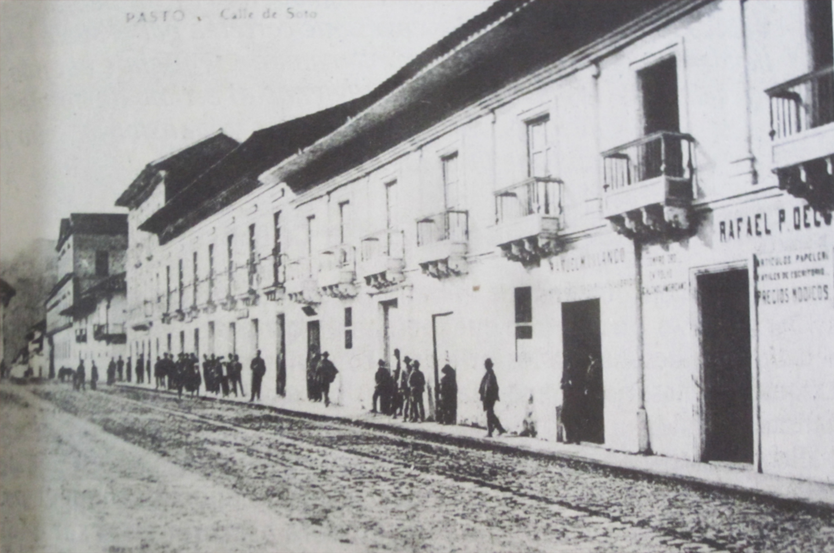
Calle de Soto, frente a la Plaza de la Constitución, Pasto, finales siglo XIX