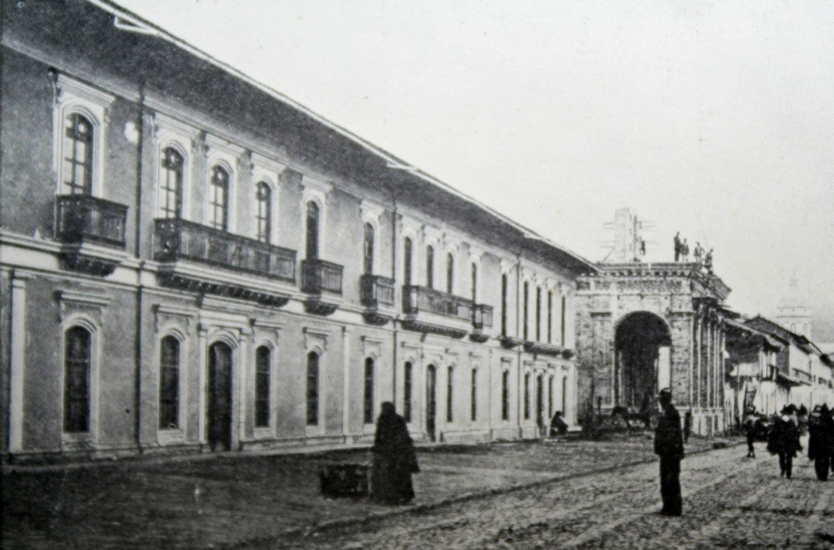
Calle de La Merced y reconstrucción del Templo de La Merced.