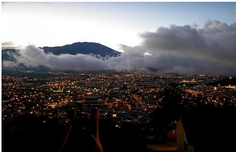
Figura N° 2 Panorámica de la Ciudad de Pasto

El nombre del municipio y de la ciudad se origina en el nombre del pueblo indígena Pastos, Pas=gente y to=tierra o gente de la tierra, que habitaba el Valle de Atriz a la llegada de los conquistadores españoles.