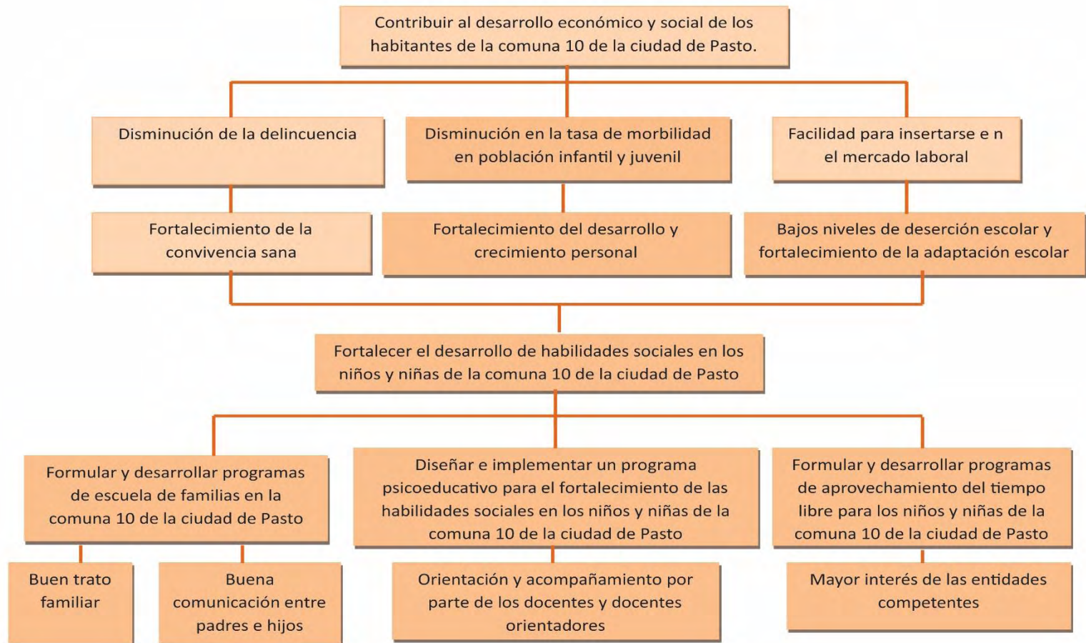
Grafico 2. Árbol de objetivos