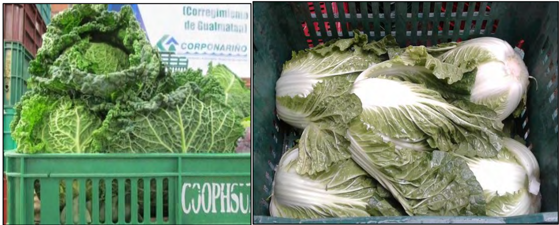
Fotografía 26: Repollo creso y Colchina, empacados en canastillas