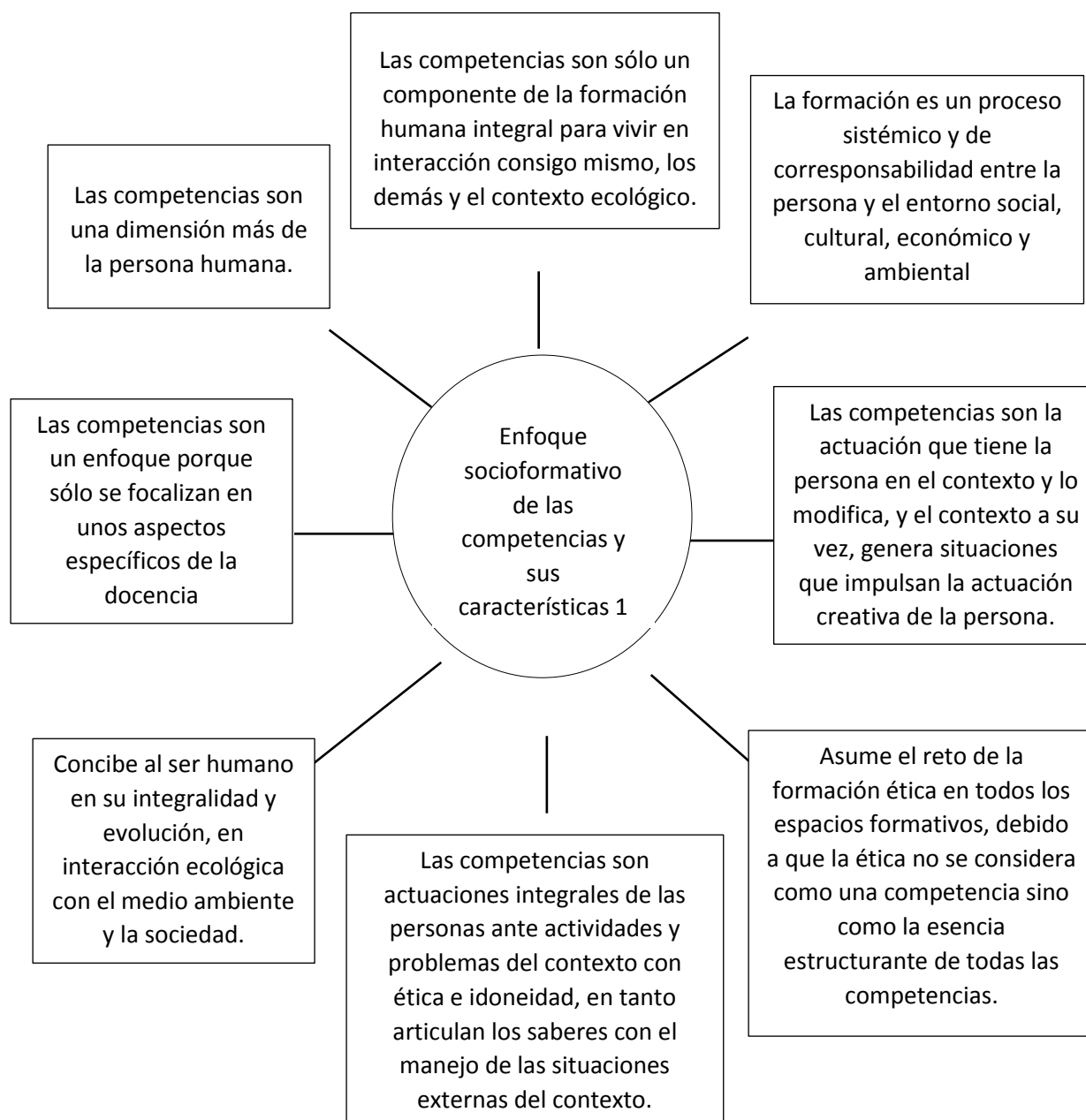
Figura 1. Enfoque socioformativo en la formación por competencias

Fuente: Tobón Tobón, S. (2010). Formación integral y competencias. Pensamiento complejo, currículo, didáctica y evaluación . pp. 31 -33.