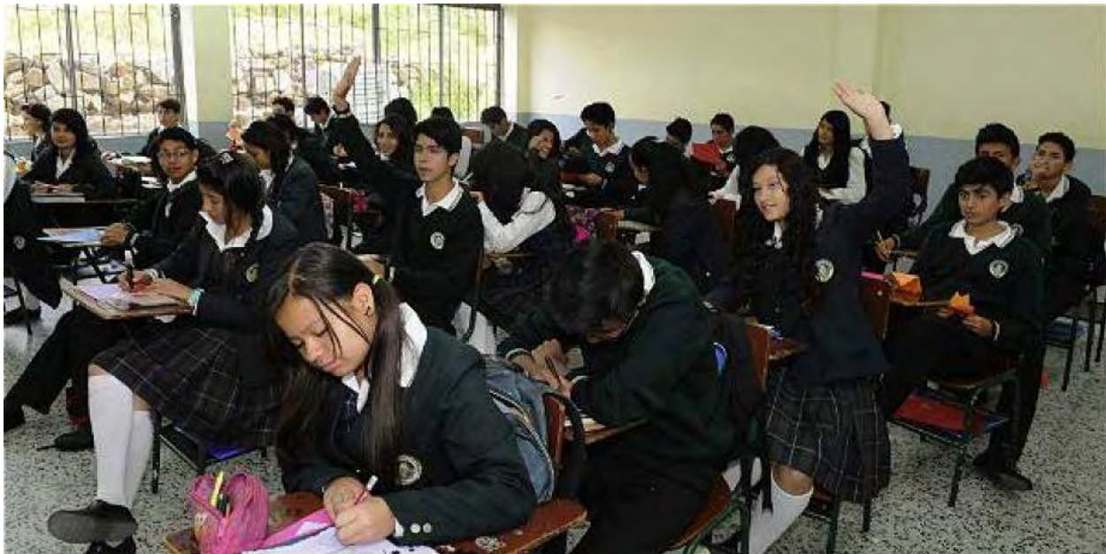
Figura 2. Alumnos de séptimo grado de la I.E.M. INEM Luis Delfín Insuasty Rodríguez.

Con relación a la composición familiar se evidencia que las familias son numerosas, están conformadas por padre, madre y en la mayoría de los casos 3 o más hijos; en algunos casos también existe la compañía de un abuelo o abuela como integrante del núcleo familiar. Al interior de estas familias ocasionalmente se presentan conflictos y situaciones de violencia, pero en algunos casos los hijos pasan tiempo solos o en otras actividades que poco favorecen el desarrollo de sus actividades académicas.