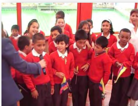
Figura 2. Estudiantes del grado 3-2

de futbol. Anexo a esto se tiene una gran extensión para las prácticas agrícolas del futuro que hoy son utilizadas como espacios de recreación. Existen tres bloques con terrazas para recreación que hasta ahora son subutilizadas por los estudiantes. Está diseñada arquitectónicamente con una riqueza de luces y espacios que permiten una zona amable, propia para posibilitar territorios educativos de libertad. Posee una Aula de informática, un espacio- salón amplio donde funciona el Restaurante Escolar.