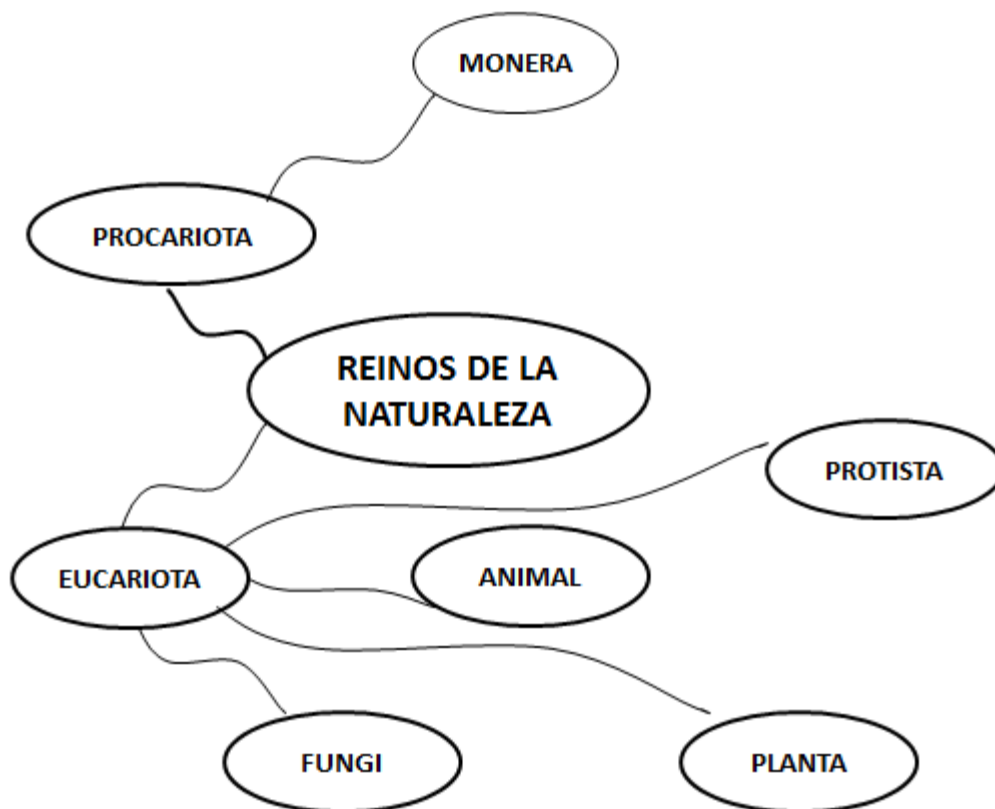
Figura 5 ejemplo de mapa mental 3