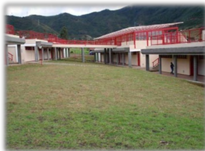
Figura 1. Instalaciones de la institucion