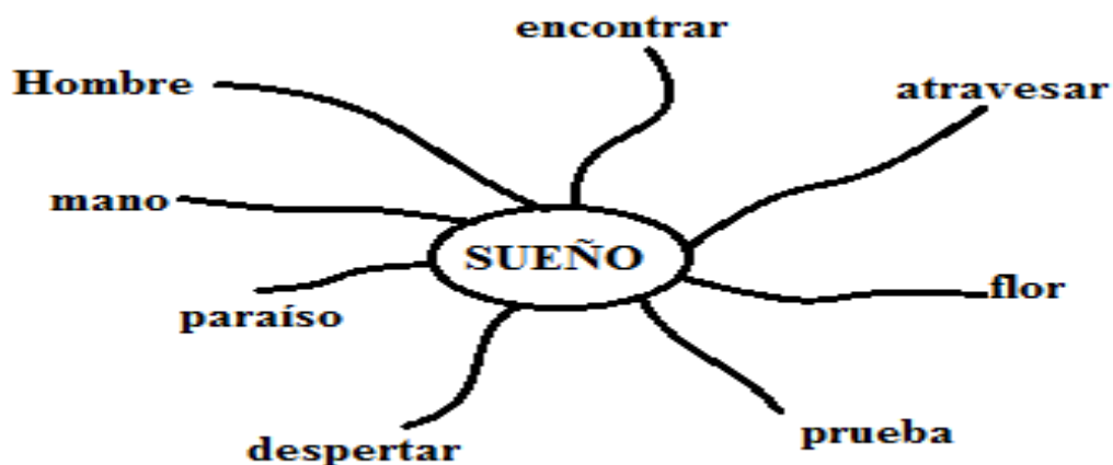
Figura 3 ejemplo de mapa mental 1

Reflexiona con tus compañeros sobre lo que quiso decir el escritor, o sobre lo que piensan respecto a este sueño en el paraíso.