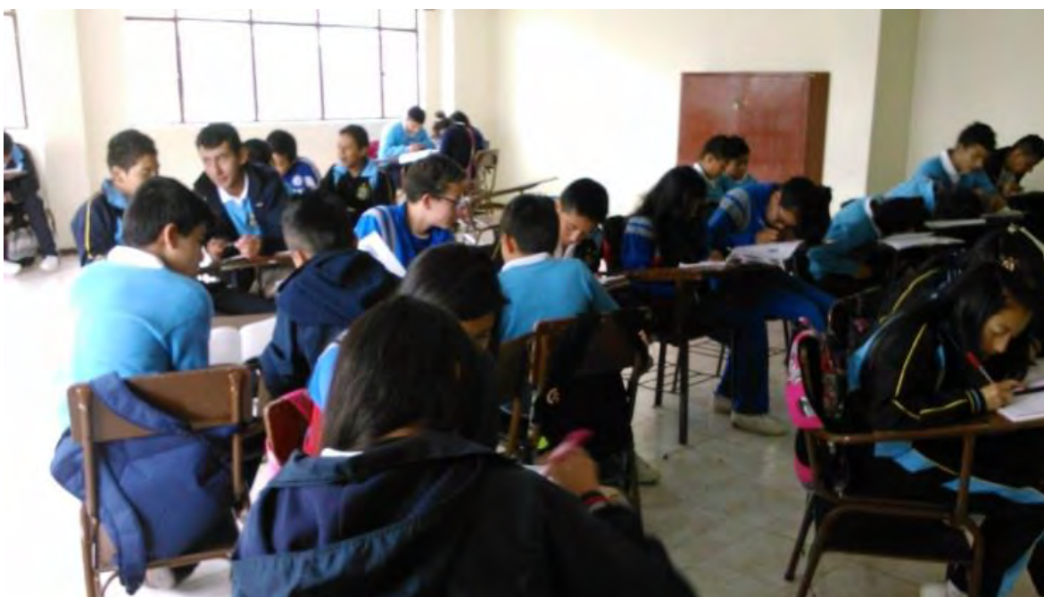
FIGURA 2. Estudiantes de grado 7-2

Visión. La IEM la Rosa, se proyecta como una comunidad educativa que ofrece un servicio de calidad en todas las dimensiones del ser, fundamentado en los principios del evangelio y en los principios de la educación personalizada con enfoque humanista, para que sus estudiantes sean agentes portadores de paz comprometidos en la humanización de la sociedad.