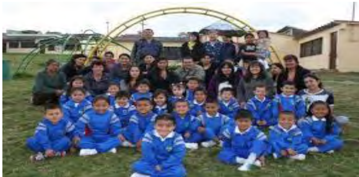
FIGURA 1. I.E.M La Rosa

Institución Educativa Municipal la Rosa. Se encuentra ubicada en la carrera 3b # 13 a - 08 de la ciudad de Pasto. Esta institución fue creada en 1968 por un grupo de voluntarias, se organizó en una de las casitas en construcción del Barrio La Rosa, recibió del grupo "Residencia Social Corazón de María", del Barrio Obrero, la escritura de los terrenos señalados dentro de los planos de la urbanización para el desarrollo social, y se conformó una Fundación sin ánimo de lucro llamada desde ese momento "Centro Comunitario La Rosa".