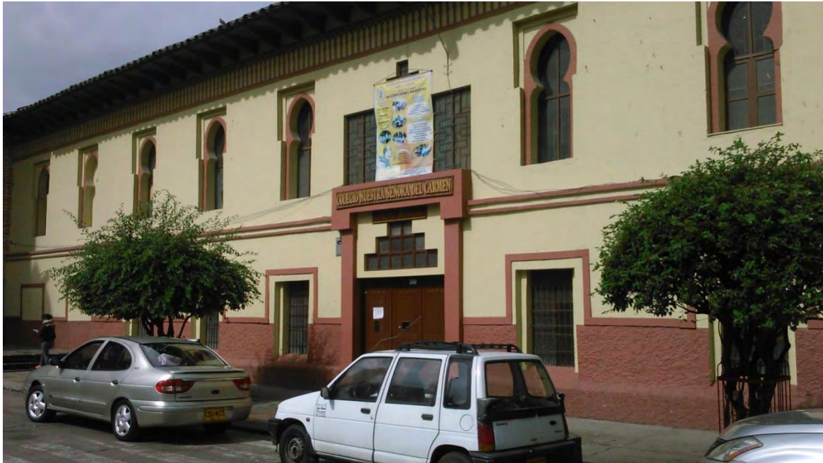
Figura 3. Entrada del Colegio Nuestra Señora del Carmen