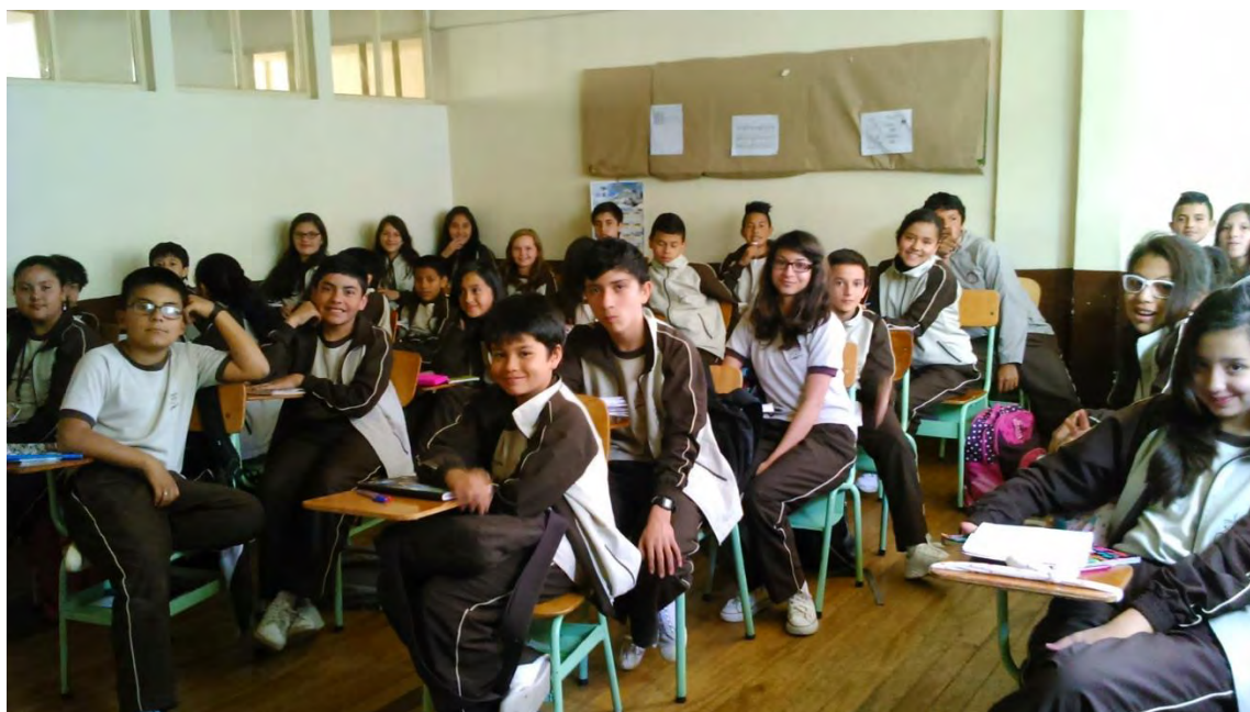
Figura 4. Estudiantes del grado 7-B

Visión. En el año 2016 los Colegios de las Carmelitas Misioneras de la Provincia de Santa Teresa del Niño Jesús, serán reconocidos a nivel nacional como líderes en la formación en valores, el cuidado del medio ambiente, el alto nivel de inglés y la excelencia académica, en coherencia con los avances de la ciencia, la tecnología, la cultura y el arte.