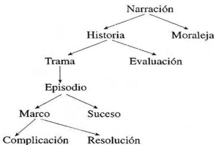
Figura 2. Diagrama de la superestructura narrativa (van Dijk 1992:156)

Todo texto narrativo presenta una superestructura global, un esquema que adopta y que determina el orden entre las partes del texto, el cual lo distingue de los otros tipos de textos. A continuación se presenta el esquema de la superestructura del texto narrativo según Van Dijk, por medio de categorías formales de organización.