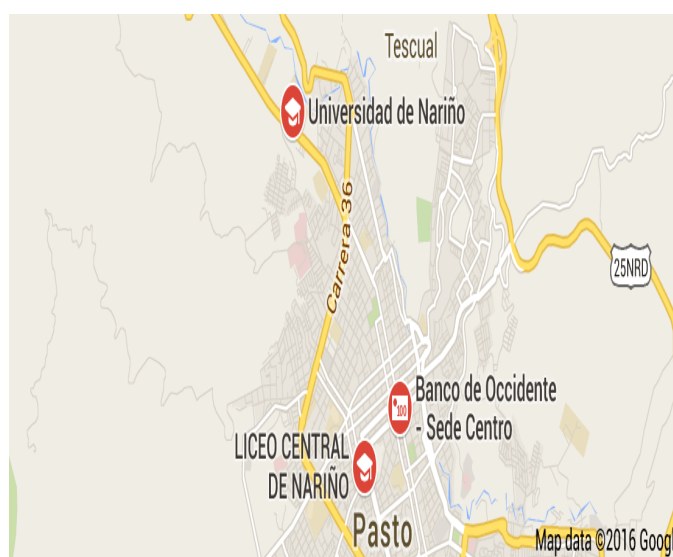
Figura 1. Ubicación de la IEM Liceo Central de Nariño sede 3