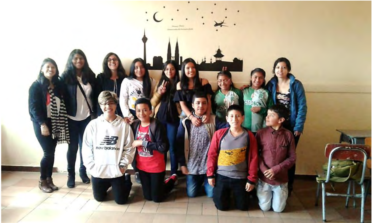
Fotografía 1. Grupo de estudiantes.