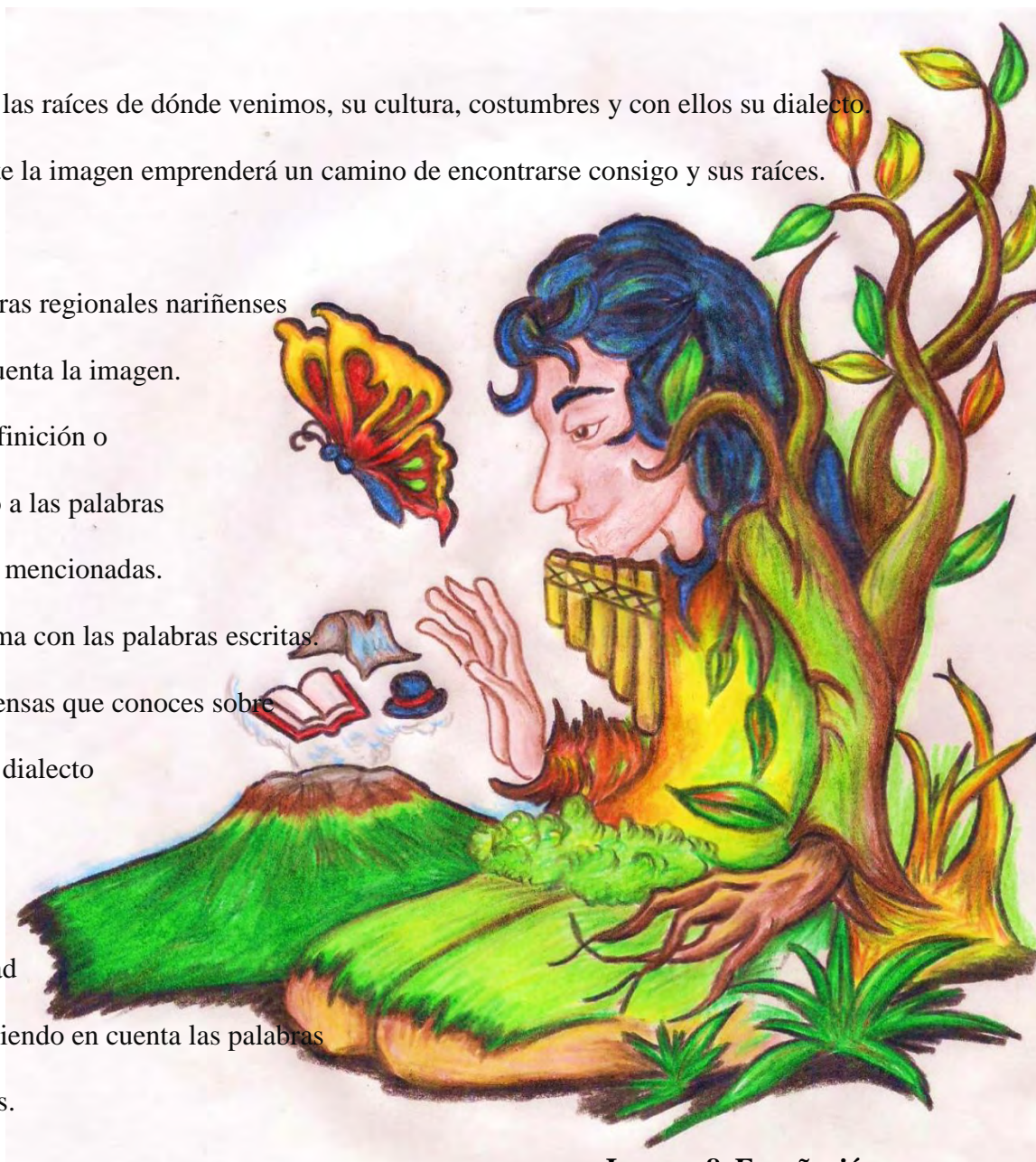
Imagen 8. Ensoñación

A partir de la actividad realizar un escrito teniendo en cuenta las palabras Regionales nariñenses.