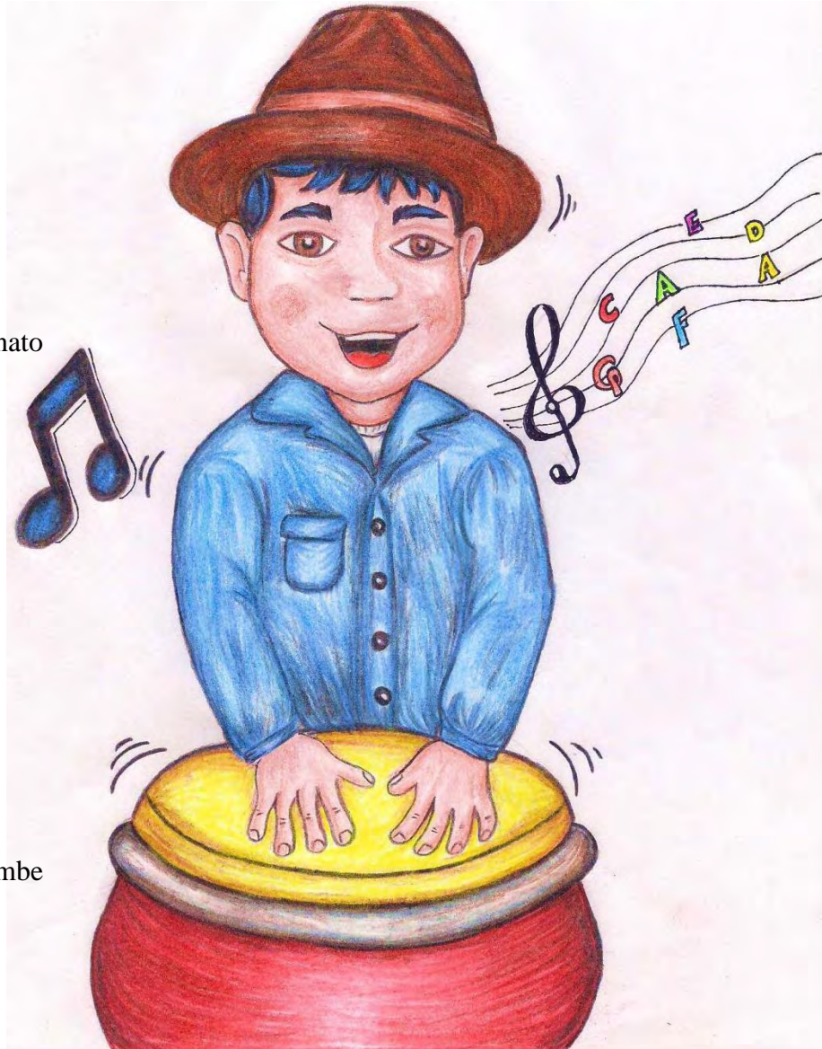
Imagen 2. Armonía