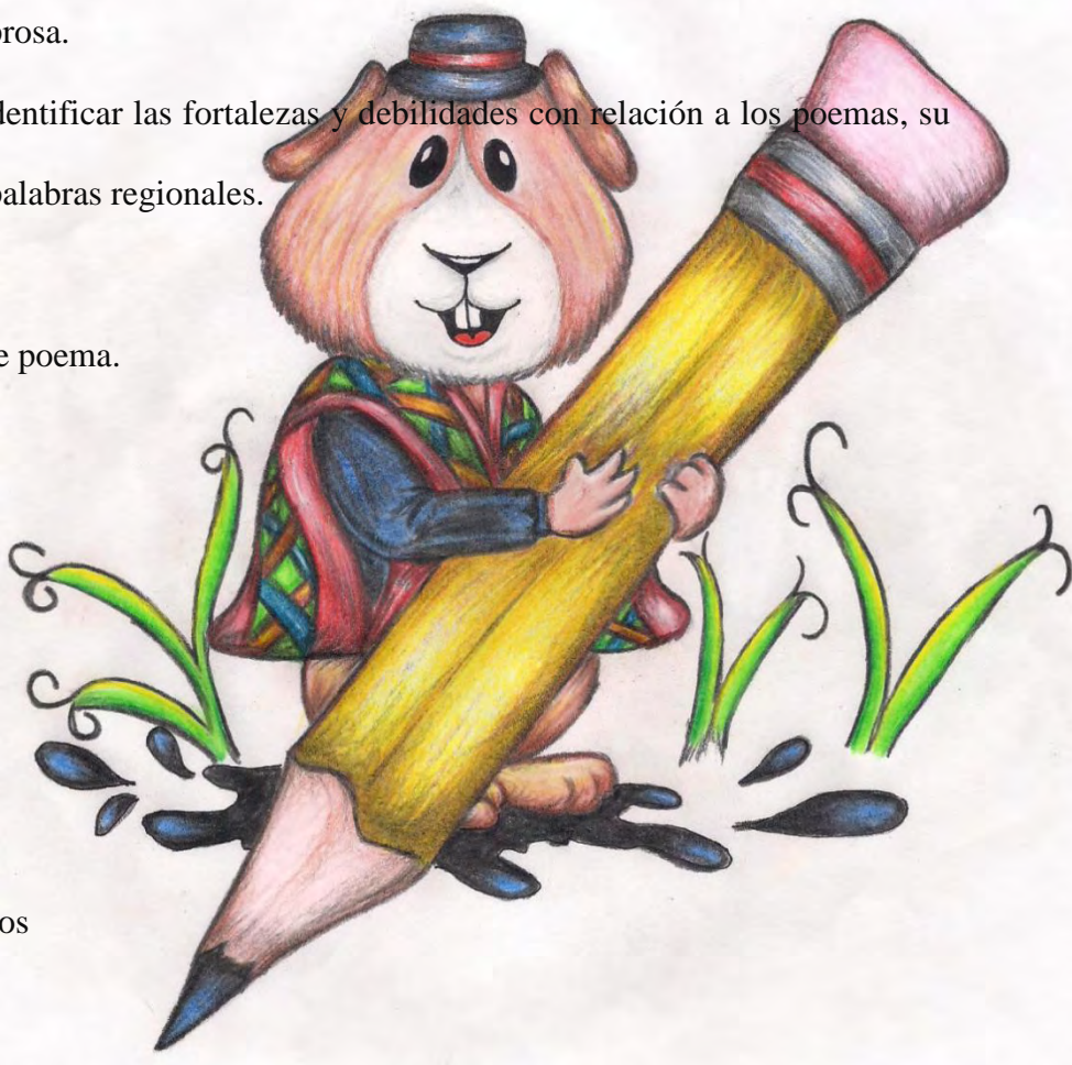
Imagen 4. Cuy

Cuando me sirven en cruz dos cuyes atravesados con dos papas curipambas y ají con zungos picados, me acuerdo de aquellos tiempos que por poco nos casamos; tocándote la viandita