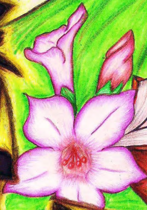
Imagen 1. Tierra de amores