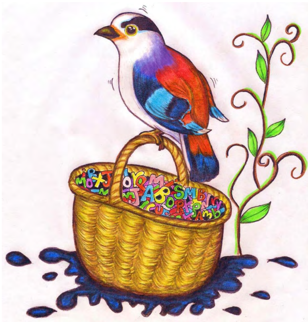
Imagen 5. Arrullo de letras

El cuento es una obra de ficción que se desarrolla con ciertos seres y acontecimientos. Además, un narrador es quien presenta a los personajes, los puntos de vista, los conflictos y el desenlace. Básicamente, un cuento se caracteriza por su