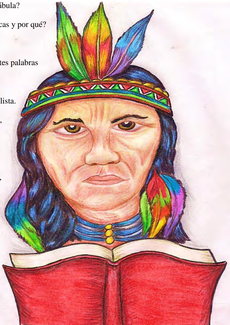
Imagen 6. Saber ancestral