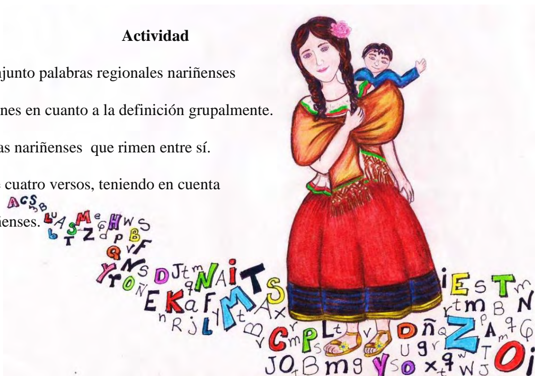
Imagen 9. Ñapanguita