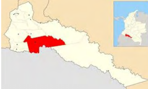
Imagen 1. Municipio del Putumayo