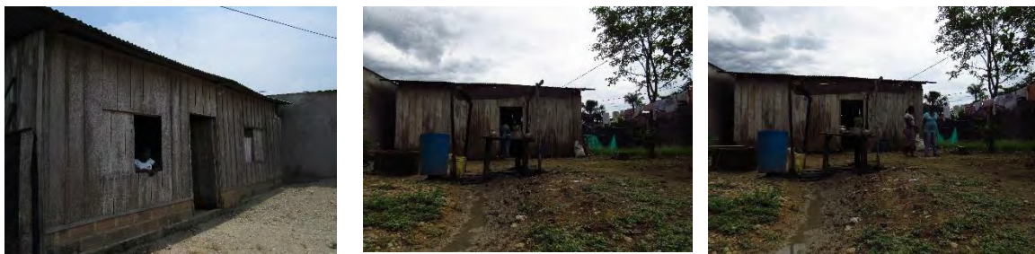
Ilustración 4. Casa de Luz