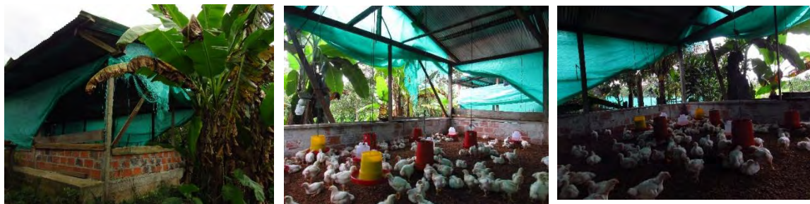
Ilustración 13. Galpón de pollos de engorde del grupo AMUDESPU