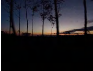
Ilustración 2. Panorámica de atardecer en la entrada de Puerto Asís