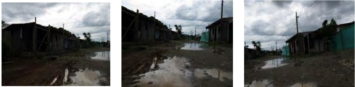
Ilustración 6. Entrada a las viviendas de Karen y Teresa