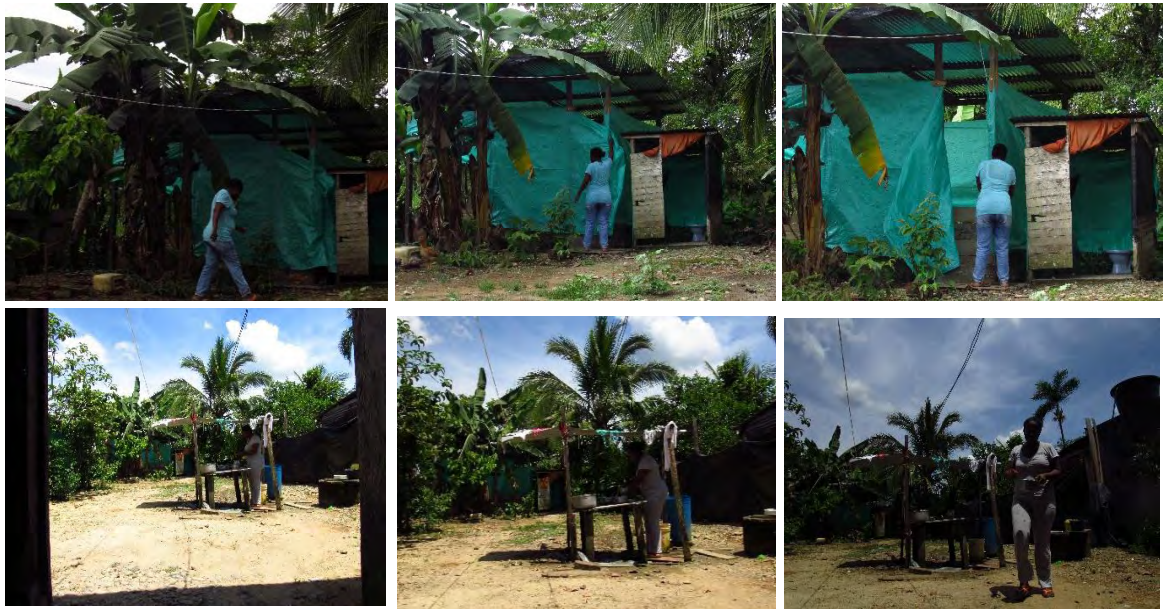
Ilustración 10. Luz en su trabajo