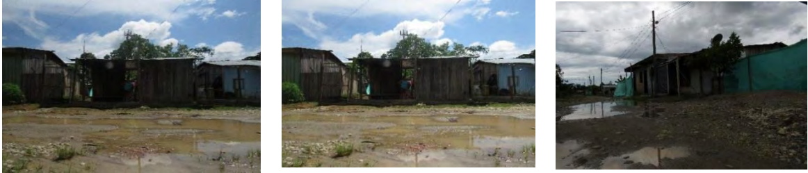
Ilustración 5. Casa de Karen

importante al mostrar texto visual y relato es que el lector, que a su vez es el espectador, al mismo tiempo construye a partir de ello sus propias imágenes. “textualidad y visualidad son dos formas de informar y narrar la experiencia humana.” 122 Se debe trabajar tanto con lo que se ve, como con lo que no se puede ver