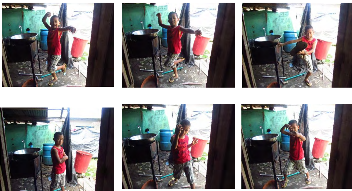
Ilustración 9. Hija de Teresa