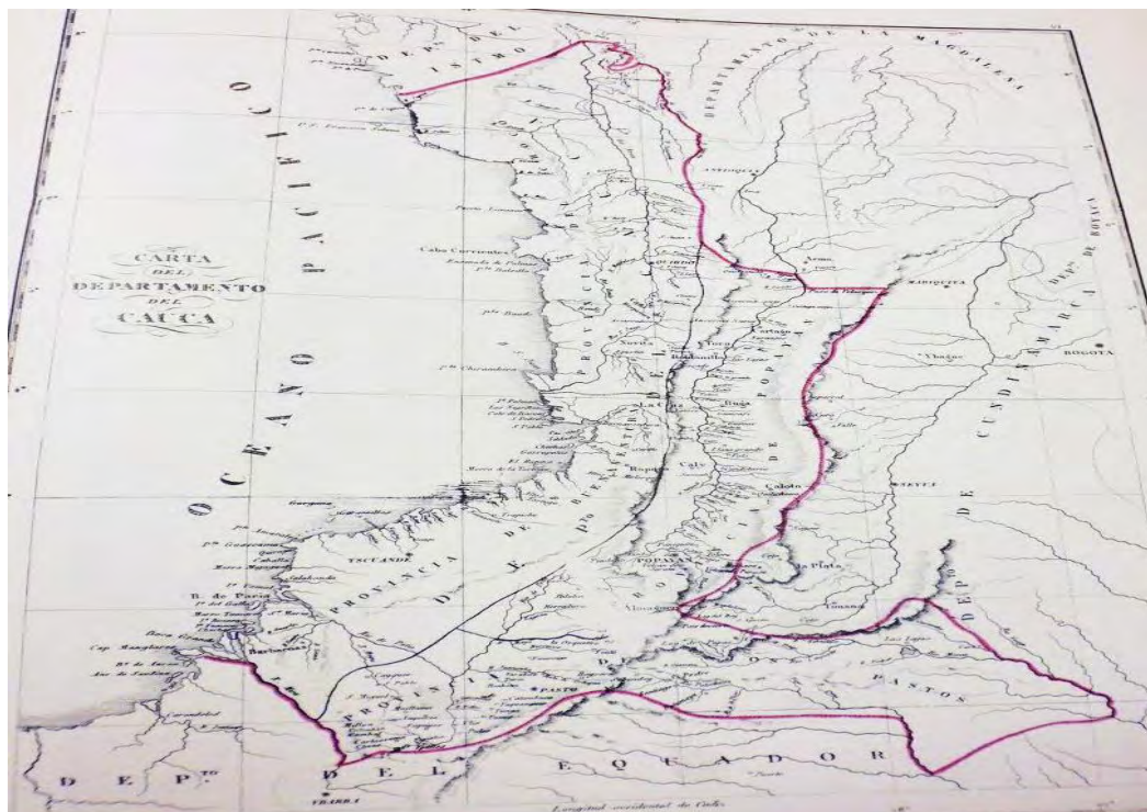
Mapa 3: Mapa de la Provincia de Pasto 1827

Fuente: Atlas de mapas antiguos de Colombia siglos XVI a XIX. 3 ed. Bogotá: Editorial litografía arco, 1827. p.153.