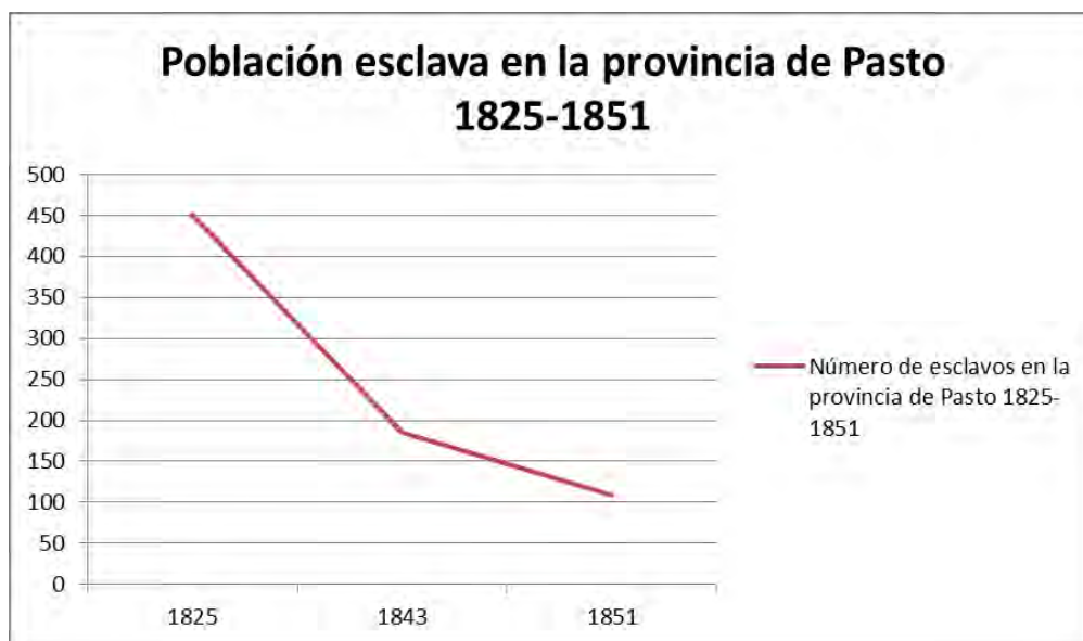
Gráfico 1. Población esclava en la provincia de Pasto 1825-1851