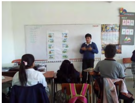
Exposiciones de ciencias sociales en L.S.C