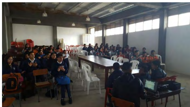
Autor Fotografía 7: Stephanny Ordoñez Ordoñez Curso lengua de señas taller estudiantes oyentes y sordos