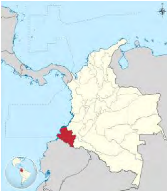
Imagen 1. Ubicación de Nariño en Colombia.