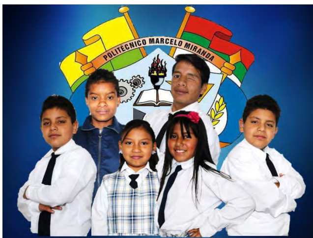
Autor Fotografía 6: Stephanny Ordoñez Ordoñez Estudiantes Ecuatorianos (Carchi) y Colombia (Ipiales)