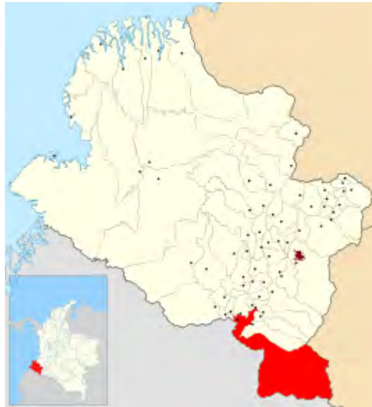
Imagen 2. Ubicación de Ipiales en el departamento de Nariño.