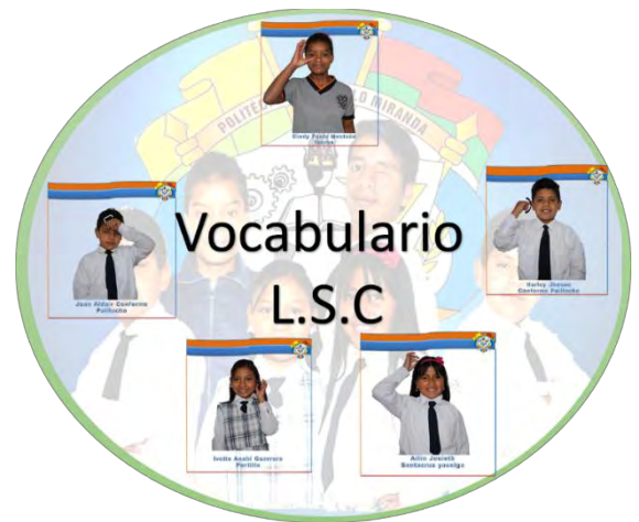
Autor Fotografía 15 : Stephanny Ordoñez Ordoñez Vocabulario pedagógico en L.S.C desarrollado en el colegio politécnico