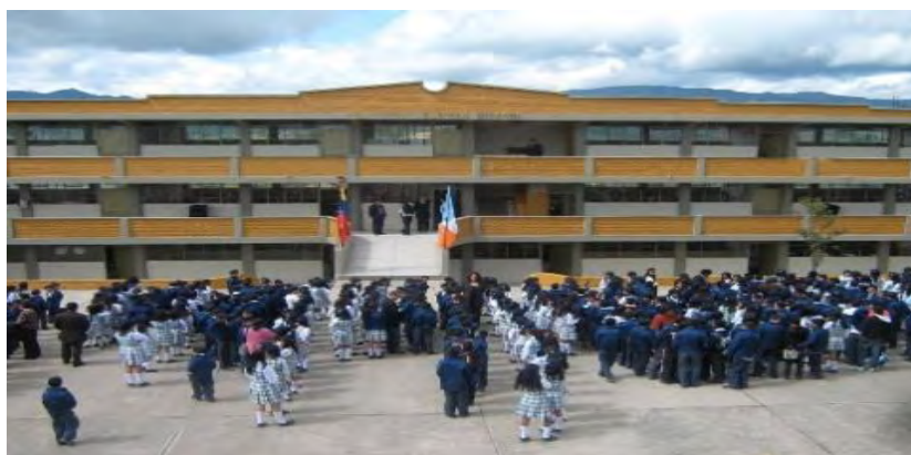
Imagen 3. Institución Educativa Politécnico Marcelo Miranda.

La ocupación que desempeñan son oficios domésticos, amas de casa, modistas, comerciantes informales, conductores, lavanderas, barrenderas, albañiles y oficios varios. La formación académica de los padres no sobrepasa los estudios primarios en la totalidad de los entrevistados, en el transcurrir del tiempo su población ha crecido por la inmigración de habitantes de origen rural quienes llegan del interior del país y últimamente del pie de monte costero de Nariño, llegan en calidad de desplazados o a causa de la violencia vivenciada en nuestro país. La situación socioeconómica de los pobladores es crítica adoleciendo carencia de protección estatal, expuestos a situaciones de riesgo y falta de oportunidades educativas, de salud y laborales 4 .