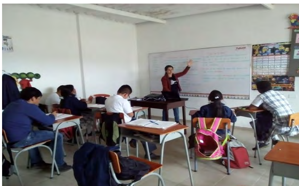
Autor Fotografía 10 : Stephanny Ordoñez Ordoñez