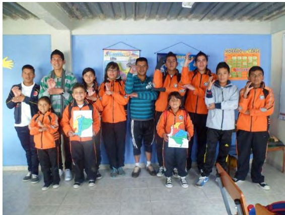
Autor Fotografía 14 : Alexander yela Rodríguez Estudiantes Sordos “Ecuador –Colombia”.