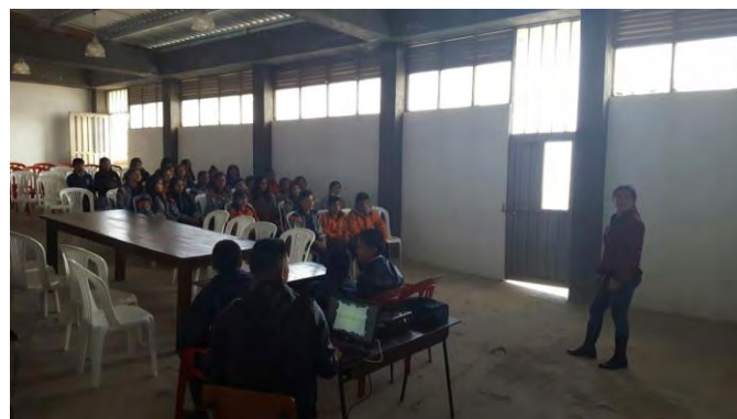
Curso lengua de señas taller estudiantes oyentes y sordos