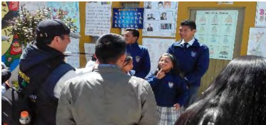
Imagen 4. Evento presentación afiche de historia persona sorda y enseñar L.S.C con oyentes en la Institución Educativa Politécnico Marcelo Miranda

A través del ejercicio práctico del desarrollo del proyecto, se posibilitó la organización de talleres de sensibilización, permitiendo dar a conocer aquellas particularidades de la persona sorda, su historia, cultura e identidad, las cuales consientan el diseño, implementación y evaluación de estrategias que mejoren los procesos de enseñanza-aprendizaje de la persona Sorda. Permitiendo así, la construcción de espacios de sana convivencia, con la participación de cada uno de sus integrantes, “oyentes y Sordos”. Al interior de la Institución Educativa Marcelo Miranda, se posibilitó desarrollar este tipo de espacios, donde los estudiantes pueden intercambiar ideas, opiniones, por medio de entrevistas, noticias, en las cuales los estudiantes pueden expresar los diversos problemas que se ve enfrentada la comunidad educativa.