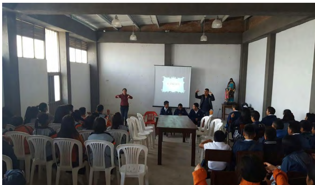
Autor Fotografía 9 : Stephanny Ordoñez Ordoñez Curso lengua de señas taller estudiantes oyentes y sordos