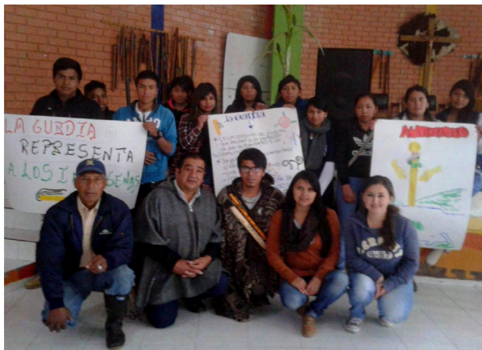
Imagen 6. Autoridades mayores y jóvenes de la comunidad Quillasinga.

Todo lo anterior, permite entender la importancia del rol que cumplen los jóvenes tanto hombres como mujeres de la población indígena Quillasinga del Encano, en la construcción social de su comunidad, el rol designado a los jóvenes, está orientado específicamente a la preservación, trasmisión y prevalencia de la cultura indígena Quillasinga a las nuevas generaciones, a través del conocimiento que adquieren a lo largo de su vida cotidiana, información que está dirigida desde la infancia por los taitas mayores, de tal manera que los jóvenes indígenas son representantes indispensables de su cultura, quienes interiorizan los conocimientos que su familia, los mayores y demás integrantes de la comunidad que comparten proximidad con los jóvenes les brindan, con la tarea posterior de transmitir esta cosmovisión Quillasinga de generación en generación.