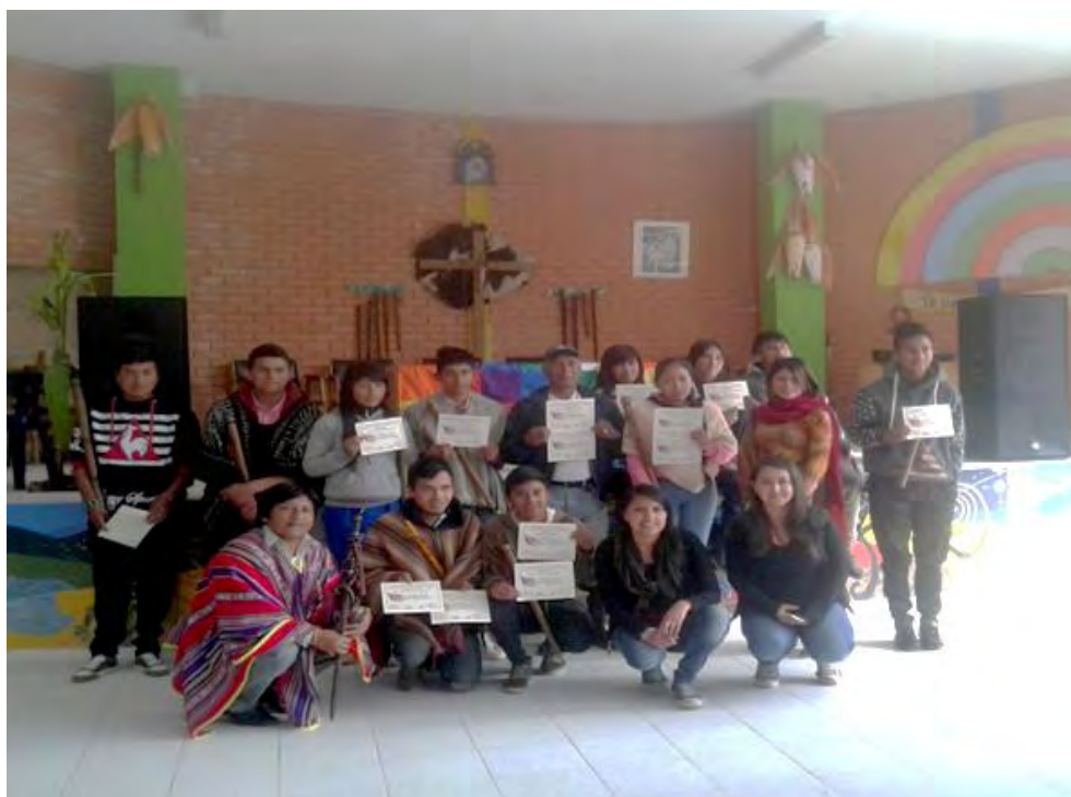
Imagen 9. Proceso Guardia Indígena.