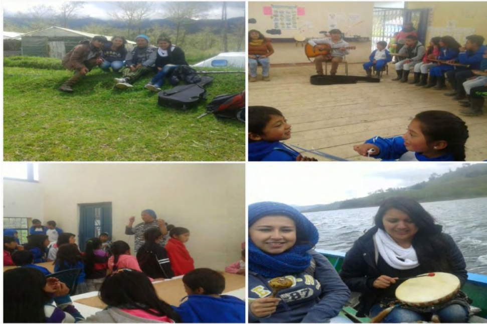
Imagen 34 Acompañamiento escuela de música ancestral y latinoamericana Guaguasquilla, vereda Santa Lucia

Fuente esta investigación. Jueves 11 agosto 2016.