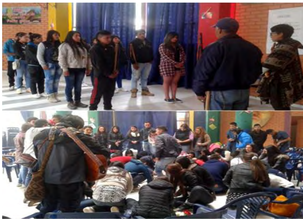
Imagen 3. Jóvenes de la Guardia Indígena y Visita de estudiantes de la U. Cooperativa Pasto.

Después de realizar una caracterización del resguardo indígena Quillasinga y definir la categoría de juventud, partimos analizar a los jóvenes que hacen parte de esta comunidad y las relaciones que se forman en torno a ellos, relaciones familiares, relaciones entre personas que comparten proximidad en el territorio (vecinos), amigos y personas externas a la comunidad, con las que tienen algún tipo de relación, que de uno u otra manera insertan nuevas ideas, pensamientos y formas de vivir que comienzan a influir en diversos aspectos en los jóvenes, como: las formas de expresión, formas de vestir, música, interacción virtuales, entre otros. Lo anterior no quiere decir que la juventud Quillasinga pierda su identidad indígena, por el contrario,