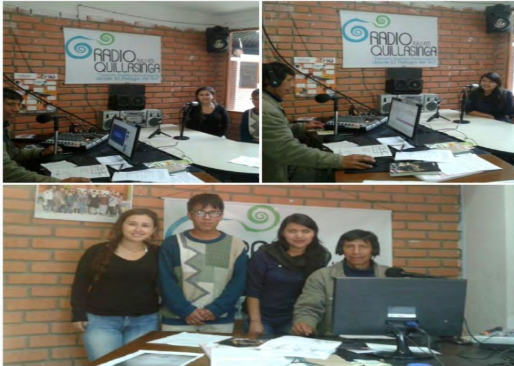
Imagen 12 Convocatoria Radio Quillasinga 106.1.

Fuente esta investigación. Jueves 14 abril 2016