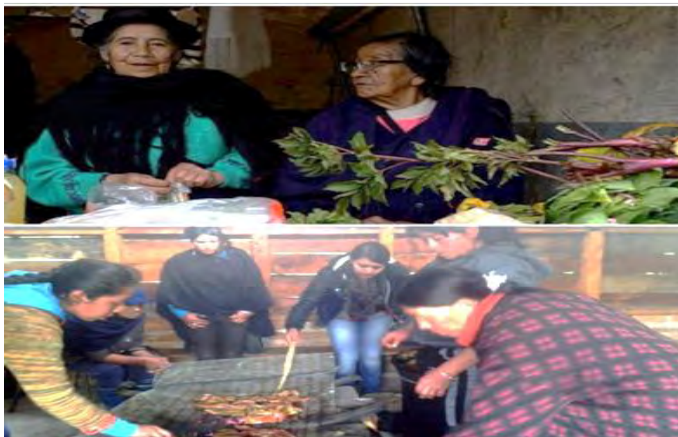
Imagen 4. Mujeres comunidad Quillasinga.