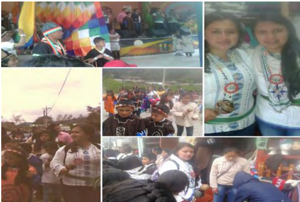
Imagen 37 Acompañamiento a la celebración ancestral Quillasinga. (Carnaval Quillasinga)

Fuente esta investigación. Sábado 2 de julio 2016.