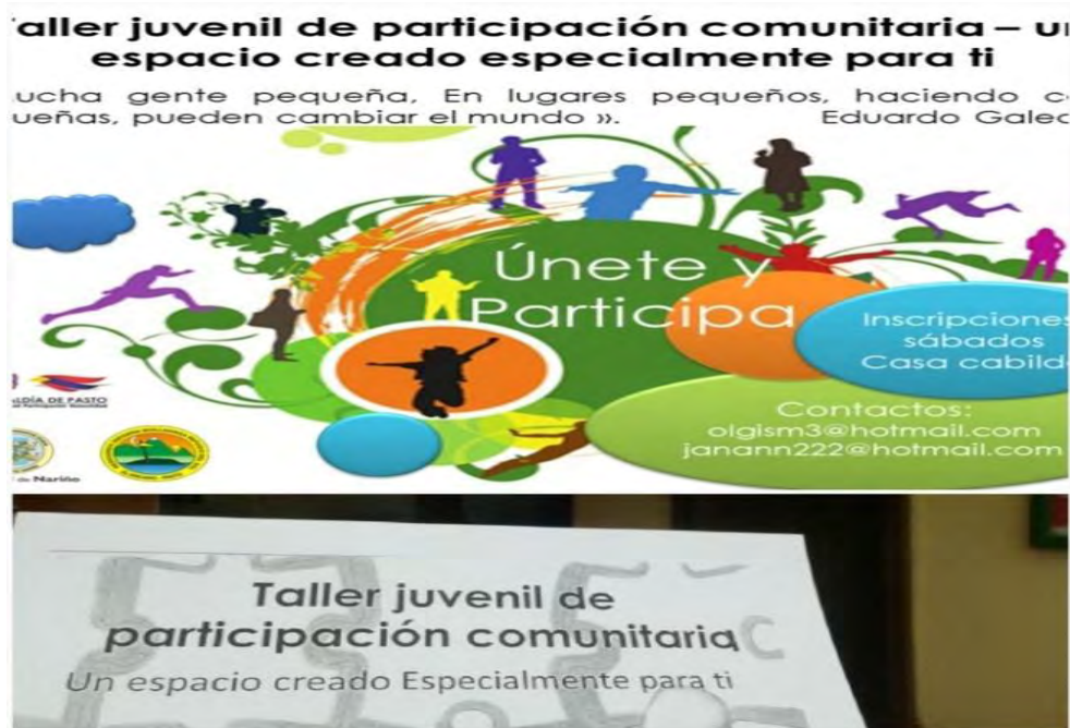
Imagen 10 Chapolas de invitación.