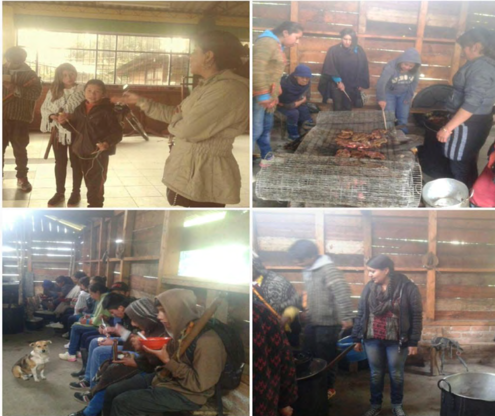
Imagen 28 Asado con los jóvenes de la guardia indígena.

Fuente esta investigación. Sábado 30 julio 2016.