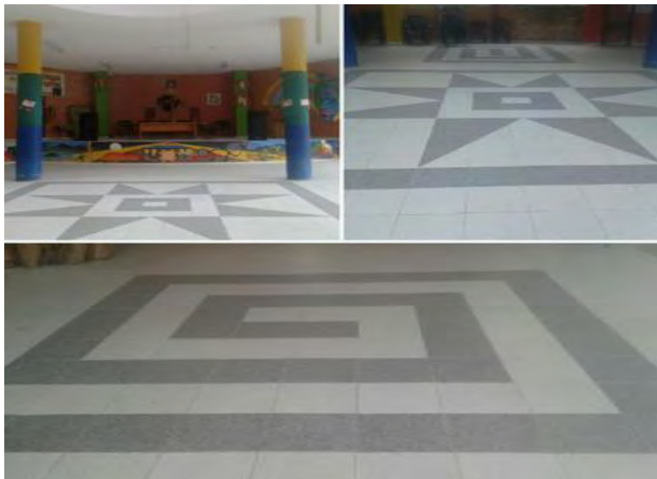
Imagen 38 Simbología ancestral en las instalaciones del resguardo indígena.