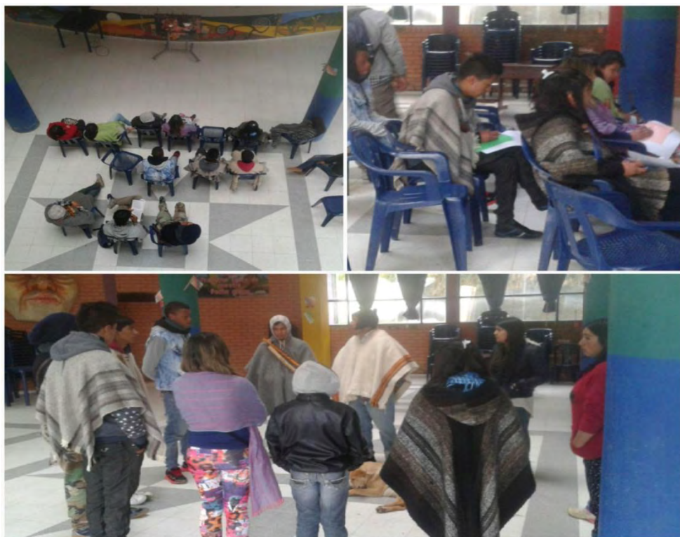
Imagen 26 El liderazgo, película: “pollitos en fuga”.

Sábado 9 de julio 2016.