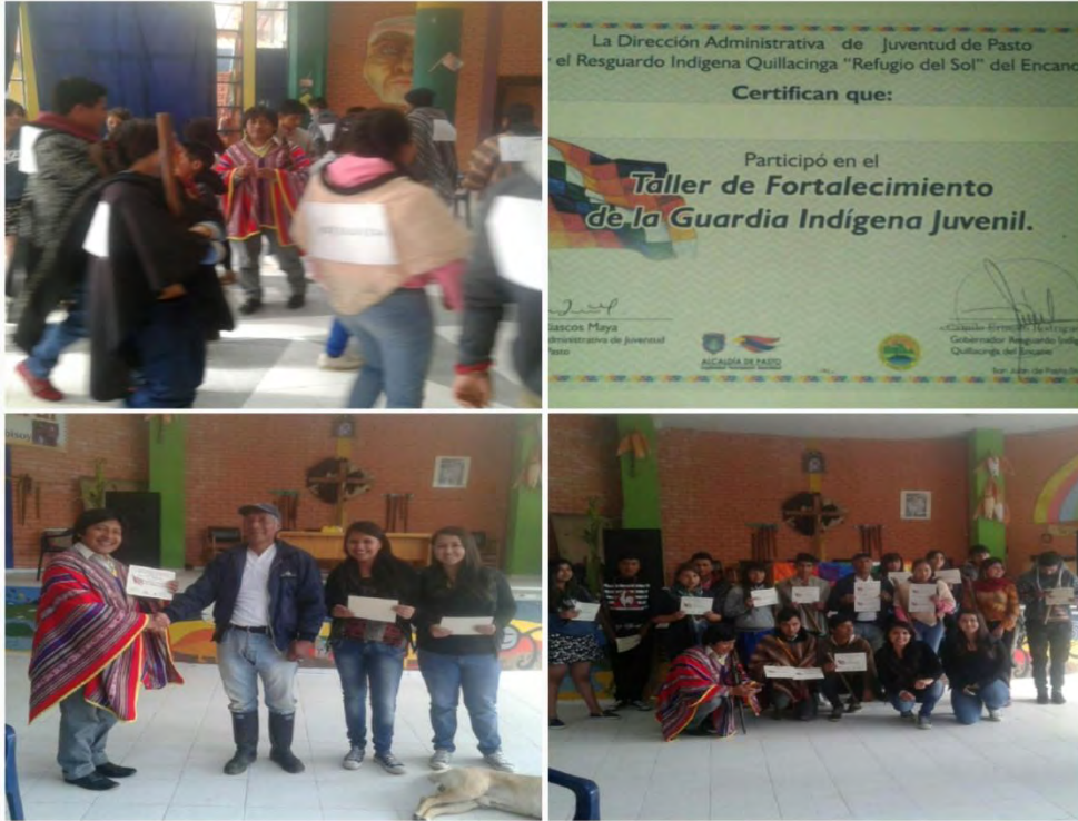
Imagen 29 Reconocimiento a los jóvenes de la guardia indígena, acompañamiento gobernador taita Camilo Rodríguez