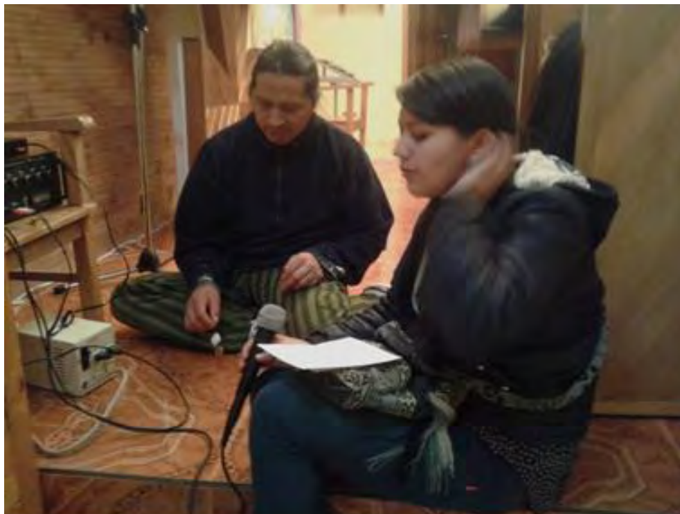
Imagen 16 Convocatoria parlantes Vereda San José.

Miércoles 20 abril 2016