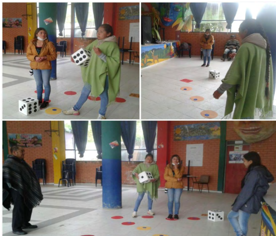
Imagen 24 Juego ¿Cuánto conozco mi resguardo?

Objetivo de la actividad percibir que tanto conocen de su resguardo y territorio.