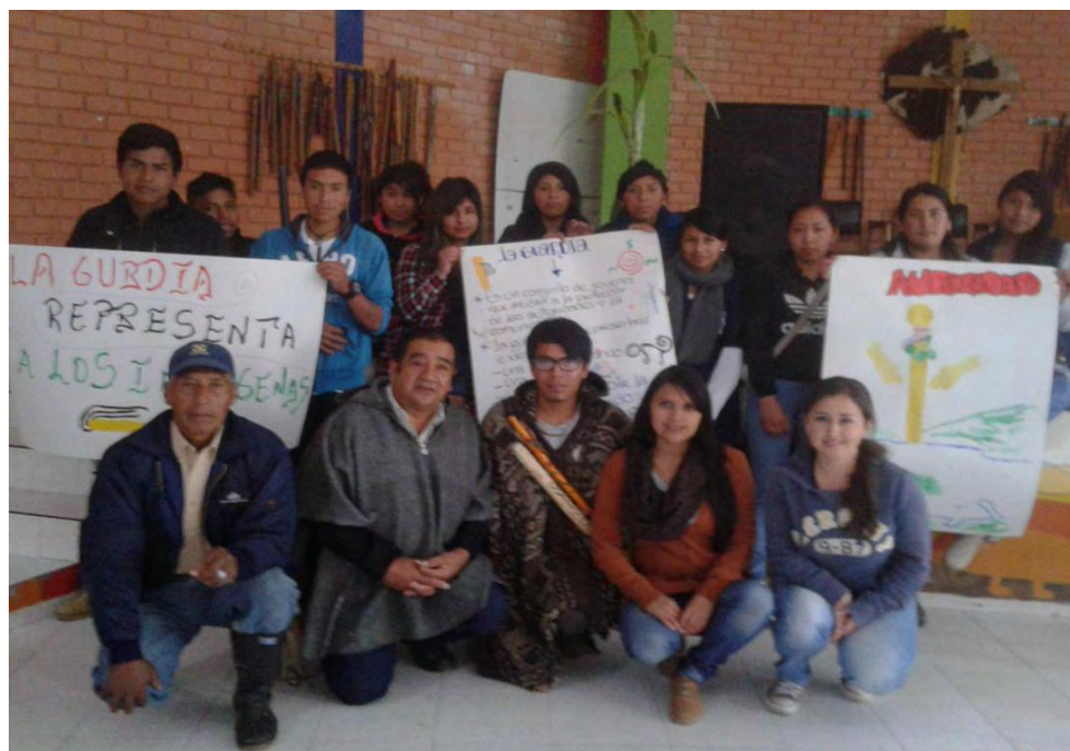
Imagen 19 Jóvenes de la guardia indígena y autoridades mayores.

Sábado 21 de mayo 2016.