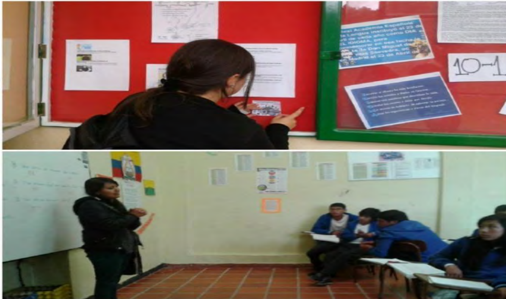
Imagen 14 Visita I.E.M encano centro, cursos 9, 10, 11.

Fuente esta investigación. Miércoles 20 abril 2016