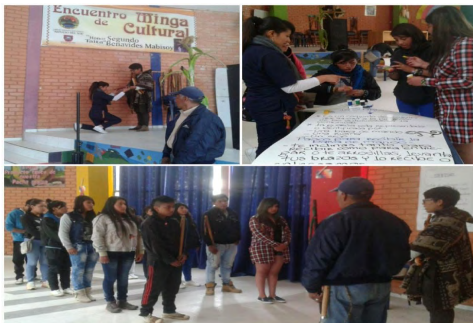
Imagen 20 Inicio Guardia Indígena Juvenil.

Objetivo de la actividad por medio de una cartelera creativa, saber de qué manera perciben la guardia indígena, además analizar el interés que tiene los jóvenes en el desarrollo de actividades en las que el tema central se relacione con su resguardo. Además de identificar quienes tomaban iniciativa a la hora de proponer ideas.