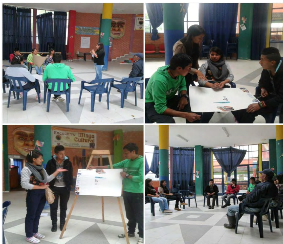
Imagen 21 Conociendo de primeros auxilios.

Objetivo de la actividad analizar la participación de los jóvenes en temáticas propuestas por una de sus autoridades mayores, además de ver su trabajo en equipo.