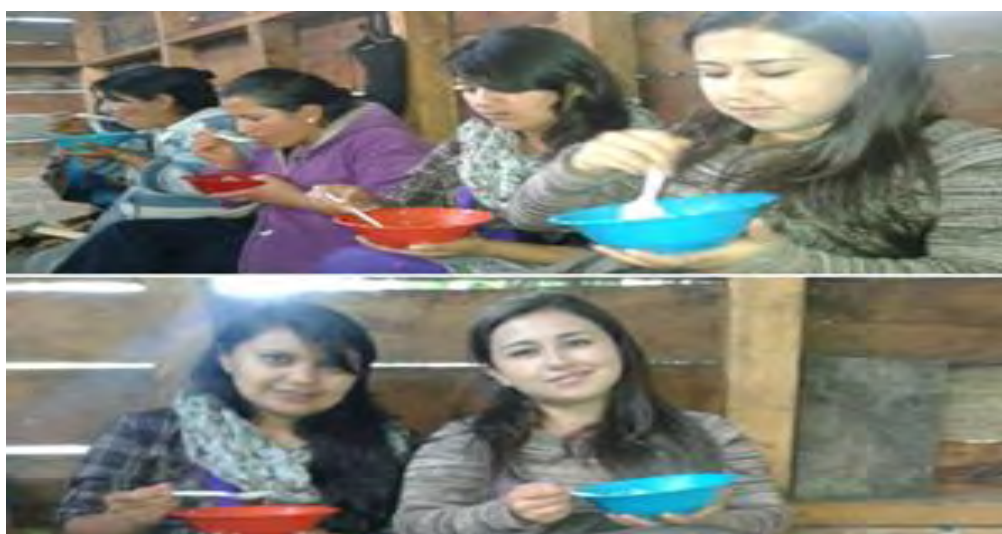
Imagen 33 Almuerzo con autoridades resguardo Quillasinga

Sábado 30 abril 2016.