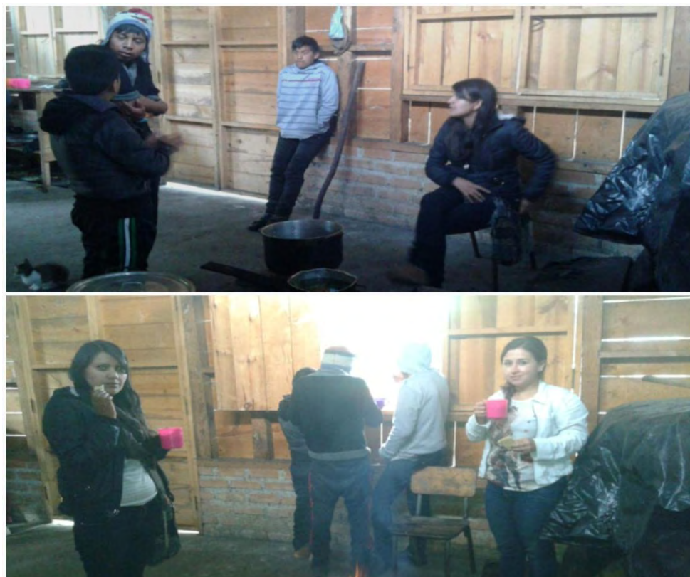
Imagen 25 Compartiendo en el fogón. Cocina resguardo indígena.

Objetivo a pesar de la falta de los jóvenes se obtuvo la oportunidad de hablar con los jóvenes asistentes y compartir con ellos un refrigerio, de esta manera conocer un poco más de su entorno y pasatiempos.