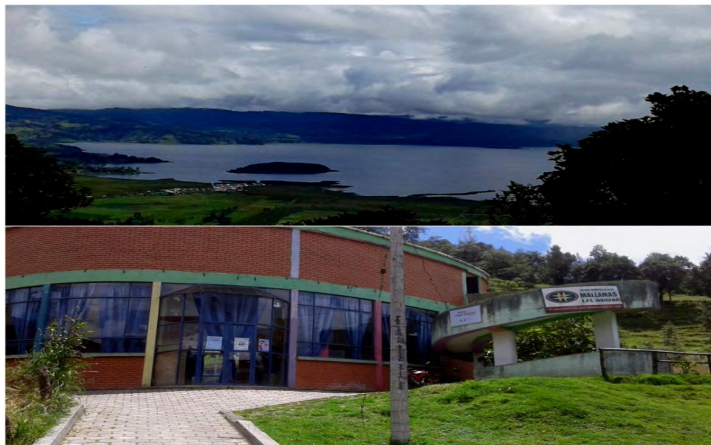
Imagen 1. Laguna de la Cocha y Resguardo Quillasinga Refugio del Sol.

Los Quillasingas que habitaron la montaña, hoy se reinventan en el corregimiento del Encano a partir del auto-reconocimiento, la necesidad de agruparse, de retomar la autoridad y la autonomía propia, dando origen primeramente al cabildo Quillasinga, que posteriormente sería el actual Resguardo Indígena Quillasinga Refugio del Sol.