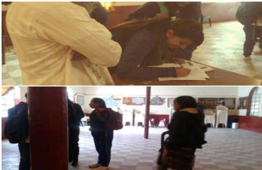
Imagen 18 Inscripción de los jóvenes I.E.M Encano centro

Fuente: esta investigación. Martes 3 de mayo 2016.