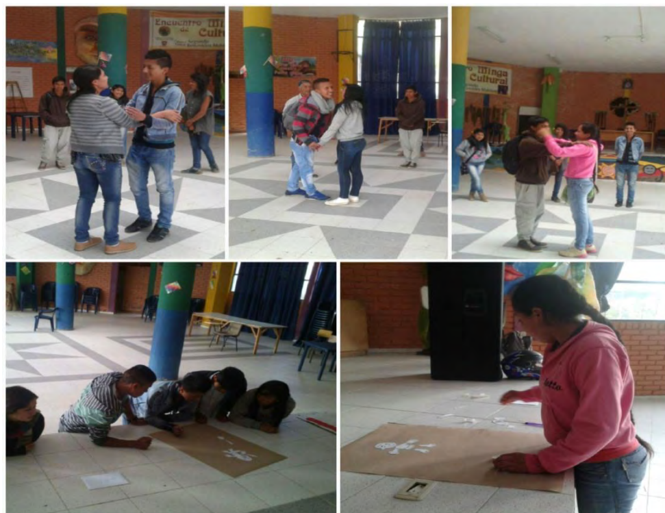
Imagen 22 Saludos indígenas, elementos que hacen parte del botiquín.

Objetivo de la actividad observar el trabajo en equipo ver la comunicación que hay entre ellos y la forma en la que copera cada uno para el buen desarrollo de la actividad.