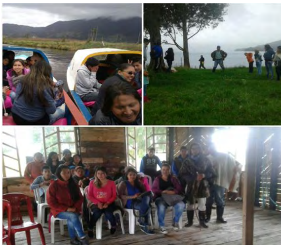
Imagen 23 Recorrido “isla larga”.

Objetivo de la actividad: observar el trabajo en equipo por medio de los diversos juegos, percibir si existe una mayor comunicación entre ellos.