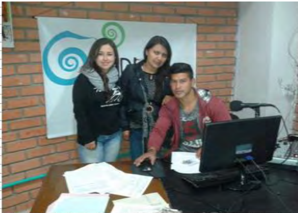
Imagen 15 Segunda visita radio Quillasinga 106.1

Miércoles 20 abril 2016