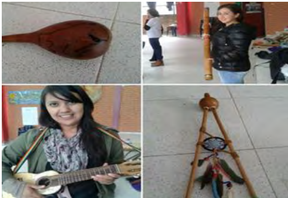
Imagen 35 Acompañamiento escuela de música ancestral y latinoamericana Guaguasquilla, vereda Santa Lucia

Fuente esta investigación. Jueves 11 agosto 2016.