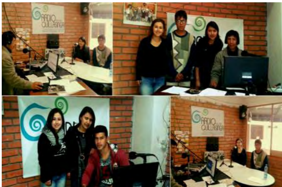
Imagen 8. Instalaciones de Radio Quillasinga 106.1 FM.

Este proceso de tejido ancestral en los niños y jóvenes ha generado buenos resultados, los participantes refieren que se sienten bien cuando elaborara un trabajo con sus propias manos, Oscar menciona que “Los guaguas empiezan a valorar el trabajo que realizan y a esmerarse por obtener buenos resultados, de esta manera se crea compromiso en ellos”. Además de desarrollar la creatividad, la paciencia, y el trabajo en equipo .