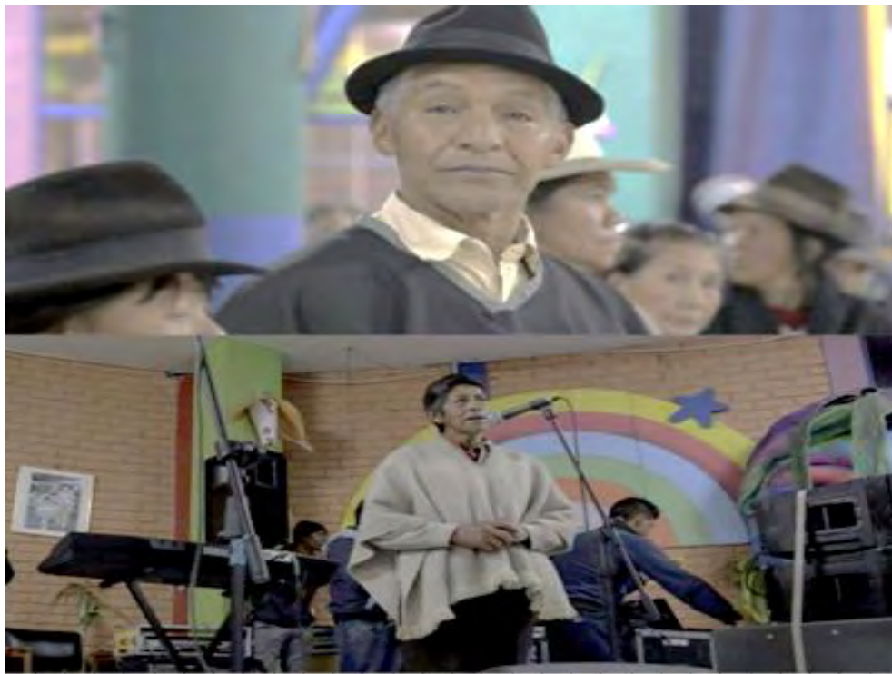
Imagen 5. Hombres comunidad Quillasinga.