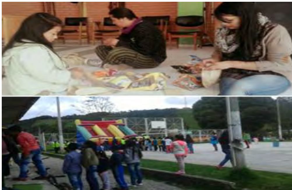
Imagen 32 Acompañamiento día del niño.

Fuente esta investigación. Sábado 30 abril 2016.