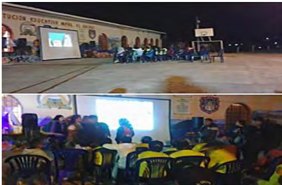
Imagen 11 Cine al parque.