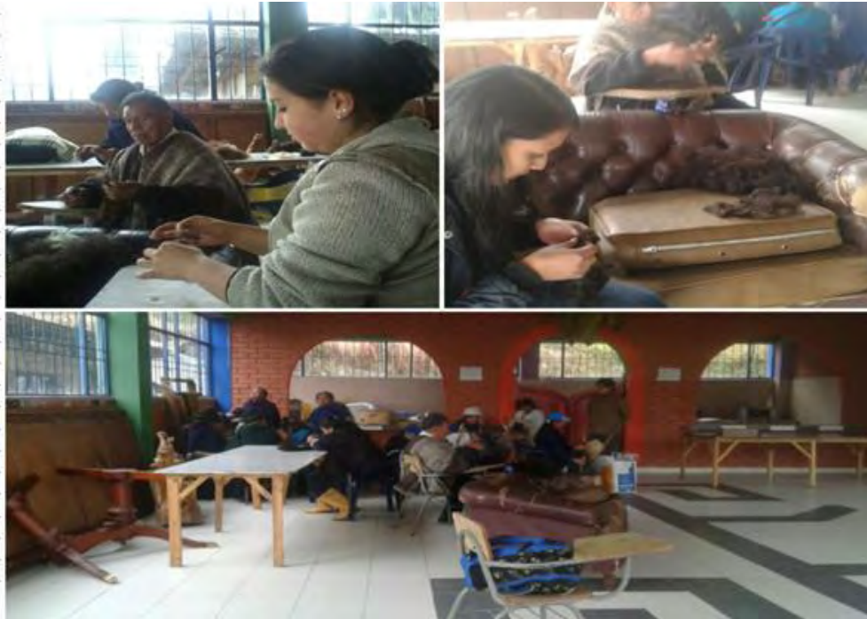
Imagen 36 Conociendo el proceso de hilar, adultos mayores Quillasingas.

Sábado 2 de julio 2016.