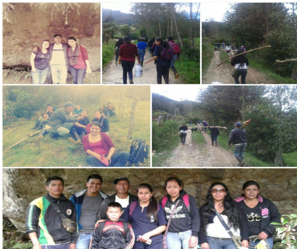
Imagen 27 Caminata vereda Casapamba jóvenes guardia indígena.

Sábado 16 de julio 2016.