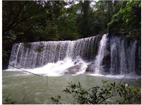
Cortinas de Diamante Uribe - Meta

El meta también es conocido por los monos que habitan en las selvas, y entre estos existe uno muy especial, el mono aullador, el animal terrestre más ruidoso, que por su condición anatómica puede alcanzar sonidos que se escuchan hasta 4 km a la redonda, lastimosamente fue un encuentro que nunca se dio. De todos modos Uribe es un lugar lleno de especies sorprendentes en estado natural, como es el caso de las vistosas guacamayas volando y alimentándose sin miedo al contacto humano, o también las grandes mariposas de azul profundo que se deslizan por los árboles de las cascadas. Todo esto hace parte del recorrido natural de los llanos orientales, pues su vegetación permite el contacto con muchas especies; inusuales, extrañas, grandes, pequeñas, y también extremadamente fantásticas como es el caso del milenarío Jaguar que se interna en las selvas húmedas próximas a la Amazonia, y que por su imponente energía se transforma en leyenda de tiempos ancestrales.