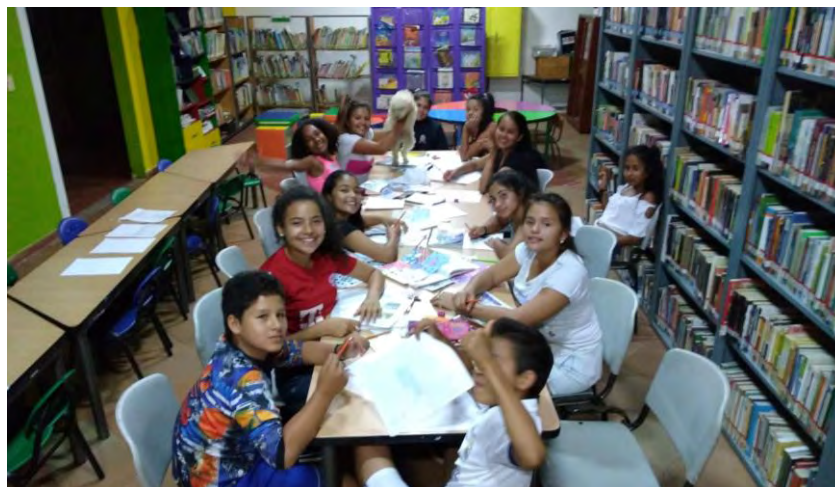
Colectivo Externo de Artes

Híbridos Colores Híbridas Expresiones presenta un enfoque cualitativo en el cual se busca que cada participante explore sus posibilidades creativas a partir de una serie de ejercicios que estimulen su desarrollo intelectual y emocional, generando un proceso que parta del trabajo individual al grupal, logrando así la intervención final en el espacio público.