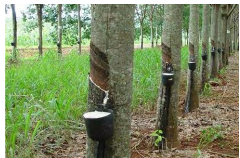
Explotación del Caucho