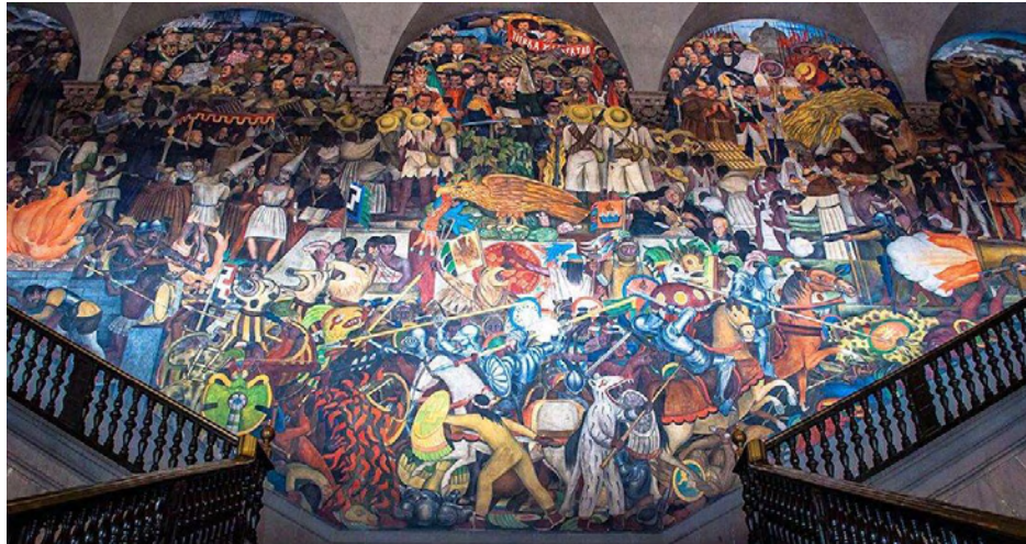
La Historia de México 1929 Diego Rivera

los artistas por plasmar la visión social que cada uno de ellos tenía sobre la identidad nacional 10 . Este movimiento comprometido en mostrar un perfil histórico de transformaciones sociales es un claro ejemplo de unidad colectiva que se proyecta con el fin de evidenciar y generar una denuncia frente a la injusticia de las clases dirigentes las cuales ejercían un poder nefasto sobre la población civil, produciendo extrema pobreza, condiciones infrahumanas, explotación laboral y demás formas de atentar contra los derechos humanos.