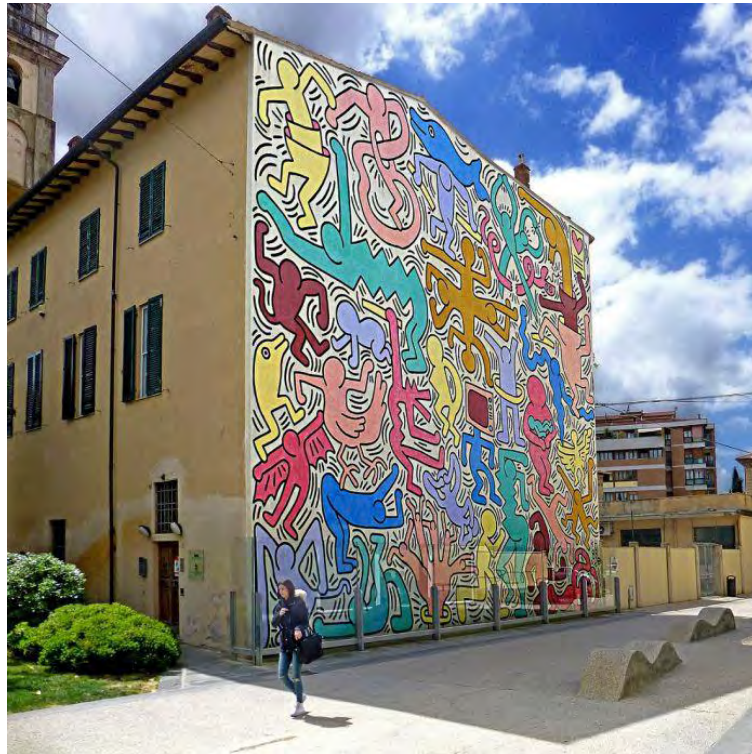
Obra Street Art 1989 - Keith Haring

sociales, estilos musicales y de más influencias propias de la segunda mitad del siglo XX que evolucionan y se interiorizan en las nuevas generaciones, en este caso con los grupos participantes en Uribe, permitiendo así un mejor encuentro con el desarrollo plástico de las propuestas artísticas y por tanto una comunicación fluida entre la comunidad.