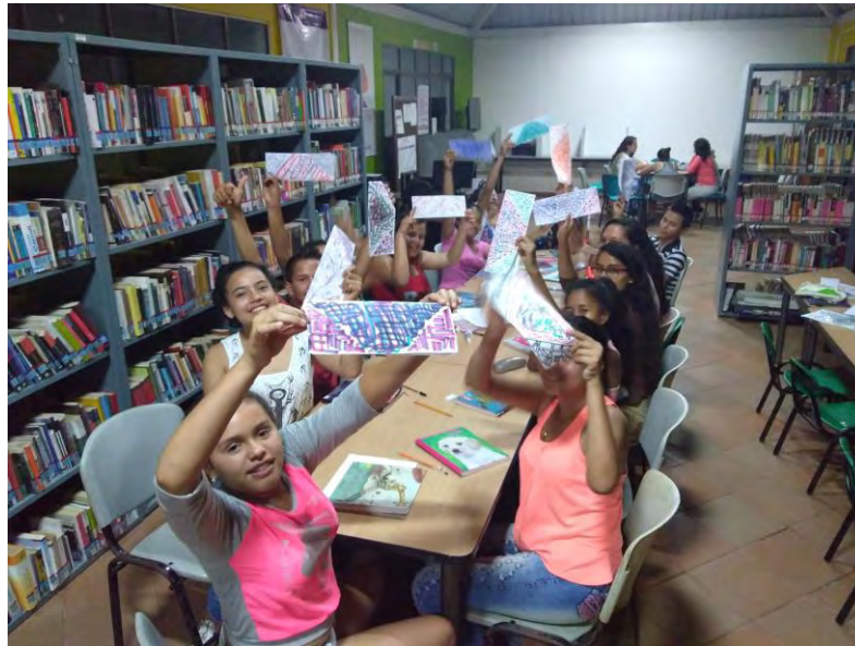
Primera Jornada de Taller

Empleando una recolección de datos a partir de la observación, la escucha y el análisis de la práctica artística, el primer mes recoge las expectativas frente al proyecto y como la gente recibe estos conocimientos. En esta etapa el primer encuentro aclara los imaginarios sobre el dibujo para abrir paso a la exploración de líneas (regulares e irregulares) y de este modo introducir la idea de que uno de los elementos principales del arte es un encuentro personal, una búsqueda interior, y es justamente esto uno de los mejores resultados, escuchar de la propias palabras del grupo que el arte es un espacio para meditar, pensar, elevar la imaginación. Otro resultado significativo es el rompimiento del trabajo artístico como una construcción individual, ya que parte de los ejercicios implican un complemento bilateral y es justamente eso lo que abre la mente a enfrentar las diferencias y entender otros puntos de vista.