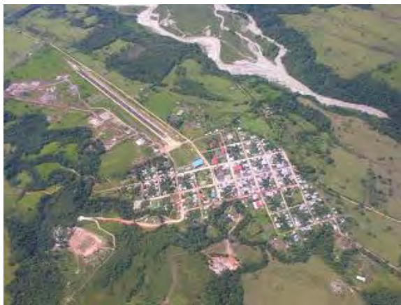
Cabecera Municipal de Uribe Meta

El municipio de Uribe alberga una comunidad luchadora e interesada por el crecimiento de la región, y esto se evidencia en la adolescencia de este municipio que es el grupo poblacional de este proyecto, gente que se interesa por aprender y conocer su territorio, personas buscando ideas alternativas que ayuden al crecimiento personal y social. En este lugar el Colegio Rafael Uribe Uribe es el único en el casco urbano y es una institución que tiene tres grupos estudiantiles, el primero de externos, hombres y mujeres que habitan con sus familias en la cabecera municipal, el segundo grupo se conforma de estudiantes del internado mixto, y el último es el internado femenino. Los dos últimos brindan la posibilidad de enviar a sus hijos e hijas que viven en veredas a estudiar en el colegio principal de la región, permitiendo así un mejor desarrollo y una mejor calidad educativa. Para llevar a cabo el proyecto se solicitó trabajar con los grados 6, 7, 8 para estimular las edades más tempranas en la producción creativa, contribuyendo en la expresividad y al favorecimiento de dinámicas de integración social y cultural. En este sentido la etapa de socialización en el colegio fue decisiva para las inscripciones en los talleres, cada detalle como las palabras a usar y la presentación con objetivos e ideas claras fueron fundamentales para generar confianza y lograr un buen número de inscripciones para conformar el colectivo de artes de Uribe Meta.