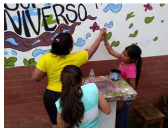
Intervención Internado Femenino