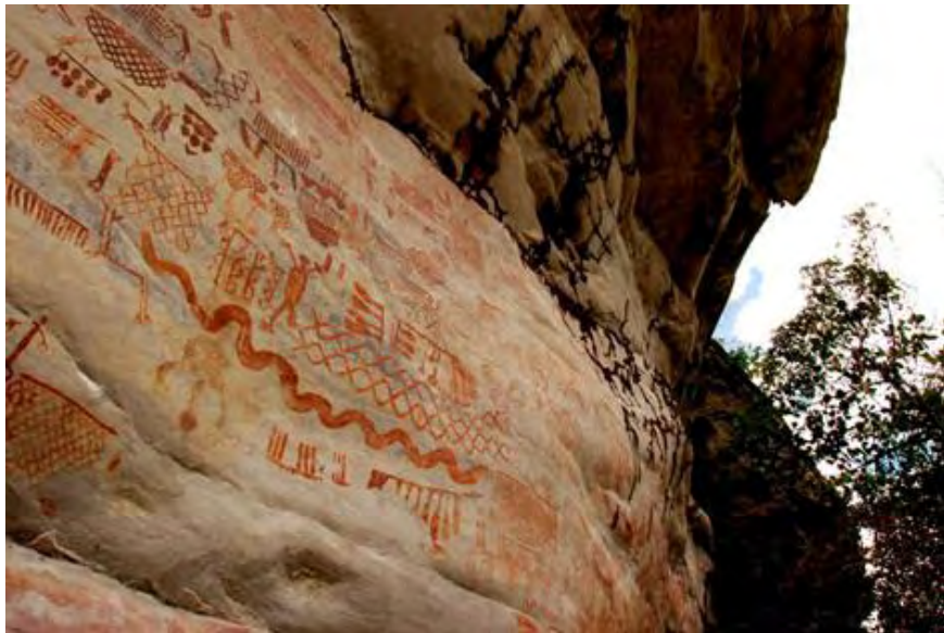
Serranía de la Lindoza

hombres 9 . Esto hace alusión a los lugares cerrados de arte, esos espacios que de algún modo cierran el contacto con la experiencia artística y generan un bloqueo en el aprendizaje cultural. En otras palabras, el arte al aire libre es una expresión que se expande y se proyecta en el tiempo, abriendo las puertas a la interpretación subjetiva del espectador.