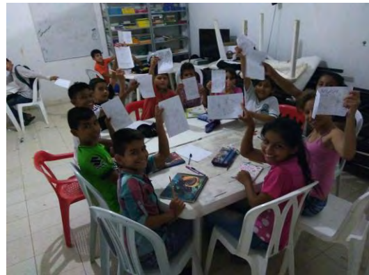
Talleres Grupales: Internado Mixto

En contraste al segundo mes de talleres la información recolectada se encamina a la asimilación y desarrollo figurativo de construcción de personajes, animales, vegetación y textos cortos. En esta etapa también es importante la relación que tiene el colectivo de artes con la biodiversidad de la región, ya que el estímulo de esta etapa presenta mayor fuerza en materia biológica a partir de documentales y charlas, por tanto las interpretaciones, conclusiones y reflexiones de esta etapa son fundamentales para el proceso de análisis de resultados. Por último la tercera etapa trae consigo una información comunicativa y de observación, ya que es el mes donde los conocimientos adquiridos dan frutos y todo se traslada a la intervención pictórica, por tanto los componentes recolectados se sustentan en la evolución técnica del trabajo artístico, en la observación del diálogo y la confianza, el trabajo en equipo y muy importante las reflexiones que cada participante asume desde su vivencia.