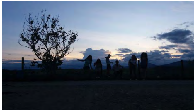
Pasantes Manos a la Paz – British Council

Para terminar, es posible que la conclusión más grande sea que una buena actitud deriva en grandes acciones y que es aquí donde el arte tiene gran protagonismo, pues es a raíz de este que toda un grupo social cambio su modo de vida para darse la oportunidad de ver más allá, de encontrarse con el otro atreves del pensamiento y la creatividad, y así cumplir con la tarea de integrarse, reconciliarse, de invocar a la memoria y rendirle tributo a la naturaleza a partir de las imágenes y las acciones, y de este modo construir desde un pequeño espacio de Colombia un ejemplo de integración e igualdad, donde el trabajo en comunidad es lo que da paso a los grandes legados que traspasan el tiempo.