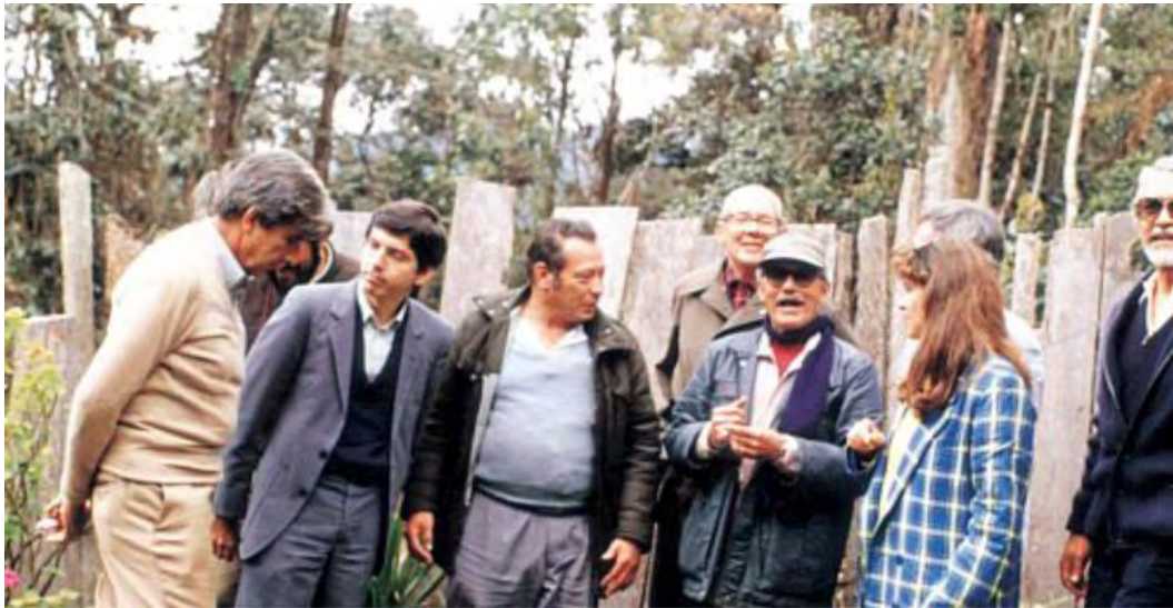
Los Acuerdos de la Uribe, 1984

temporada de horror donde lo único importante son los intereses propios. Cabe resaltar que “Los Acuerdos de La Uribe” en 1984 abrió un camino de posibilidades para solucionar los conflictos de poder a partir del cese al fuego, lastimosamente la continua ola de homicidios sistemáticos a líderes políticos agravaron las negociaciones y la tregua se ve quebrantada, abriendo así otra temporada de violencia para este departamento y el país.