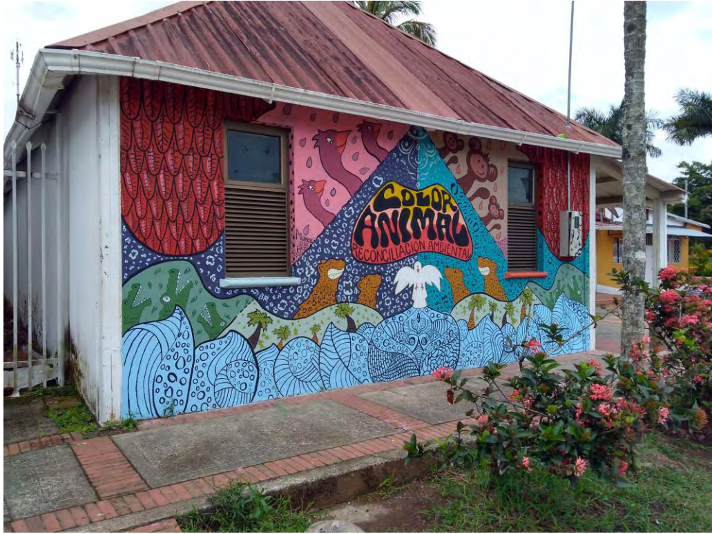
Color Animal, Biblioteca Pública

“Respirar las líneas, sentir cada movimiento de color, elevar las ideas y conectar las mente en un giro de atracción orgánica.”