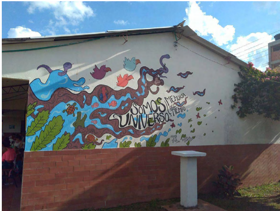
Somos Universo, Internado Femenino

que el objetivo de acercamiento a la naturaleza se dio con buenos resultados ya que los grupos de trabajo interiorizaron las temáticas propuestas y se generó la reflexión sobre una cultura conectada, que resuelve sus diferencias y se une para alcanzar sus propósitos. En otras palabras la comunidad abrió paso a reconciliarse como seres humanos y más importantes aún a reconciliarse con la naturaleza, comprendiendo que esta es el territorio que habitan y que el legado para el futuro está ahí, que requiere de cuidado y protección como todo ser vivo.