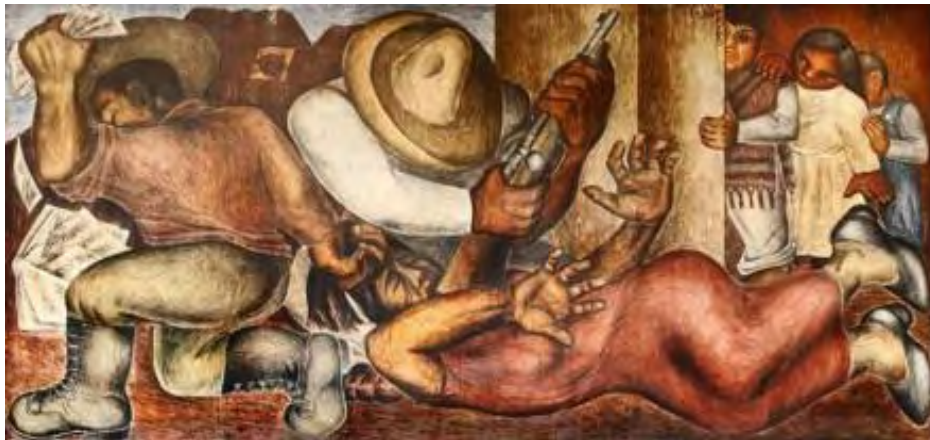
Atentado A Las Maestras Rurales 1936 Aurora Reyes

esquema mental donde las mujeres son las protagonistas. En palabras de Margarita Aguilar, Ella se mantuvo firme y fiel a sus convicciones en el terreno político y en su concepción del arte. Sin sublimar su acción como mujer de lucha, está pendiente su reconocimiento como una de las forjadoras de cambios que han empujado al país a la conquista de sucesivas libertades 11 . De este modo el espíritu de Aurora Reyes acompaña el desarrollo del proyecto impulsando a las nuevas generaciones a construir un país fuerte y con criterio, donde hombres y mujeres contribuyan con el mismo empeño a la construcción de paz.