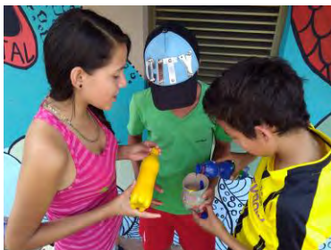
Intervención Biblioteca Pública

Entre otros resultados es destacable observar que la manipulación técnica del pincel ha adquirido mayor fluidez gracias a ejercicios anteriores de movilidad, además en esta última etapa se alcanzan evidencias más progresos en cuanto a composición y distribución de espacios, lo cual son evidencias de una buena asimilación del desarrollo artístico. Para terminar, existe un valor agregado al comportamiento de colectivo de artes, y es la amabilidad con la que se finalizaban las jornadas de muralismo, pues detalles tan fáciles como ayudar a organizar materiales, lavar pinceles y además transportar todo esto, son elementos que evidencian que el arte es un proceso generador de conciencia. En resumen, todo el proceso presenta buenos resultados, la comunidad y sus participantes encuentran que el arte aparte de mantener un espíritu dinámico fortalece las relaciones sociales y se presenta como generador de cambio, estimulando el poder reflexivo, conectando al ser con el entorno. Así mismo se presta para entablar debates inusuales y acudir a opiniones alternativas donde el público joven es quien participe, haciendo sentir su voz como elemento transformador y portador de mensajes, incidiendo en la cultura de su pueblo en donde tantas generaciones han vivido en conflicto y ahora existe un camino distinto para el futuro; es ahí donde influye la educación artística, en la construcción de ver más allá y formar una cultura de paz.