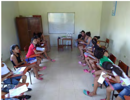
Talleres Grupales: Internado Femenino

La primera etapa del proyecto que comprende el primer mes de estudio hace una recolección general de las habilidades y el desarrollo técnico que sale a flote a partir de la participación y el intercambio de saberes, respondiendo a interrogantes que abren el paso a la comunicación y al acercamiento personal y grupal en materia artística como es el trabajo de líneas y puntos, pero es además en esta etapa donde la información subjetiva sale a flote a partir de la participación y el intercambio de saberes, respondiendo a interrogantes que abren el paso a la comunicación y al acercamiento personal y grupal.