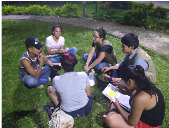
Acercamiento a la Comunidad

Colombia es un territorio lleno de misterio que al igual que el universo se mantiene en un constante cambio, así entonces sus montañas, ríos, selvas, desiertos, paramos y de más ecosistemas cumplen este ciclo, al igual que la gente con sus costumbres e historias, y son estos cambios los que de algún modo están registrados en este informe, el devenir de los años y como la sociedad responde a estos acontecimientos, para este caso el importante desarrollo del posconflicto es un fuerte cambio que influye en las comunidades, transformando ideas y formas de ver el mundo, repercutiendo en cómo nos desarrollamos en sociedad y empezamos a trabajar en un proceso de construcción de paz.