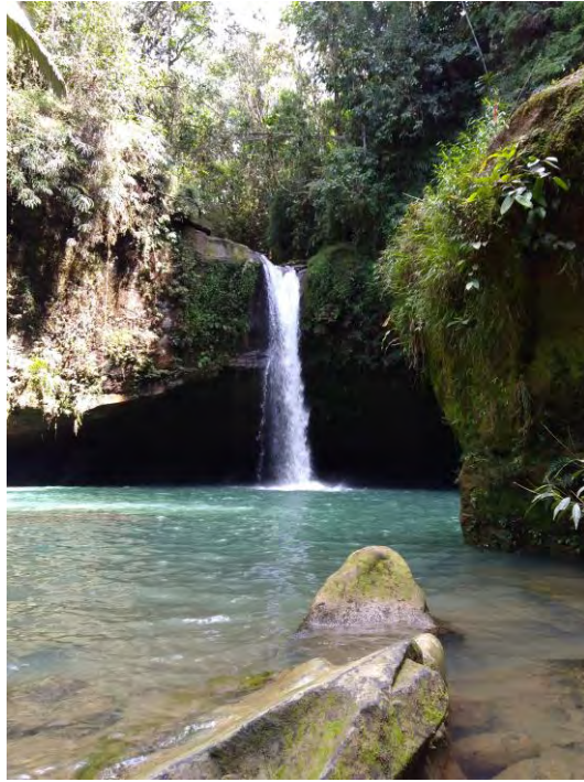
Cascada del Amor Uribe - Meta