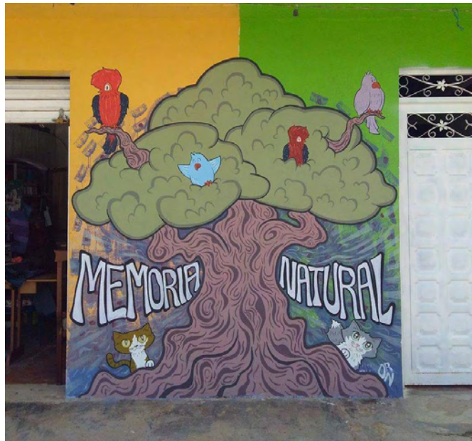
Memoria Natural, Calles de Uribe Meta

conflictos e intereses. De ahí la importancia de trabajar por una conciencia natural donde el respeto por los ecosistemas sea un hecho transversal en la cotidianidad, sembrando de este modo un pensamiento universal de conexión, una verdadera reconciliación. Es aquí donde las palabras de Pilar Soto en su tesis de arte, ecología y conciencia toman un fuerte protagonismo, “Dentro de nosotros aún sigue codificada la memoria de ser parte del cosmos y de cada elemento que compone la vida, de la naturaleza. Por lo que, si en lo más profundo de nuestro ser como materia o como energía quedó grabada la pertenencia del origen de la vida, entonces es ahí donde tenemos que conectarnos para darnos cuenta que nos hemos alejado de ella y que aún estamos a tiempo de corregir el rumbo” 13 . Este mensaje deja una reflexión sobre la vida y la relación energética existente entre el ser humano y el entorno, en este caso la selva, los árboles, las aguas, el aire fresco transportando sonidos y mucho más.