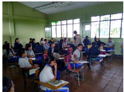
Sustentación del Proyecto