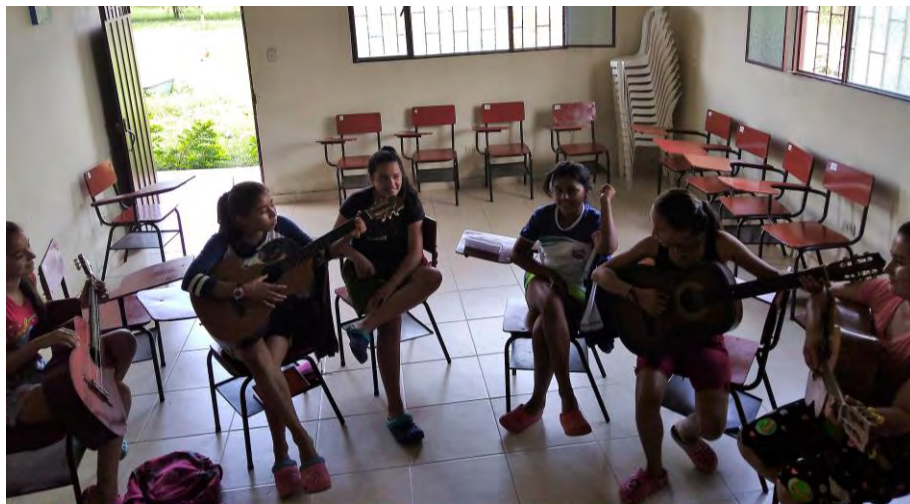
Clases de Guitarra

En condiciones parecidas surgió el hecho de ser el profesor de música con desarrollo en la guitarra acústica en el internado femenino, y este fue un proceso interesante porque no solo fue crear toda una metodología de enseñanza en cuanto a teoría y práctica musical, sino también fue un espacio para enseñar apreciación sonora y lírica de la música, de modo que las estudiantes a parte de entender conceptos básicos también aprendieron sobre otras culturas musicales como el flamenco, el tango, el rock, el country, etc. Y esto sumado a otras referencias históricas de los sonidos y sus orígenes daba paso no solo a la clase de música, sino al momento participativo donde todo el salón interactúa y aprende.