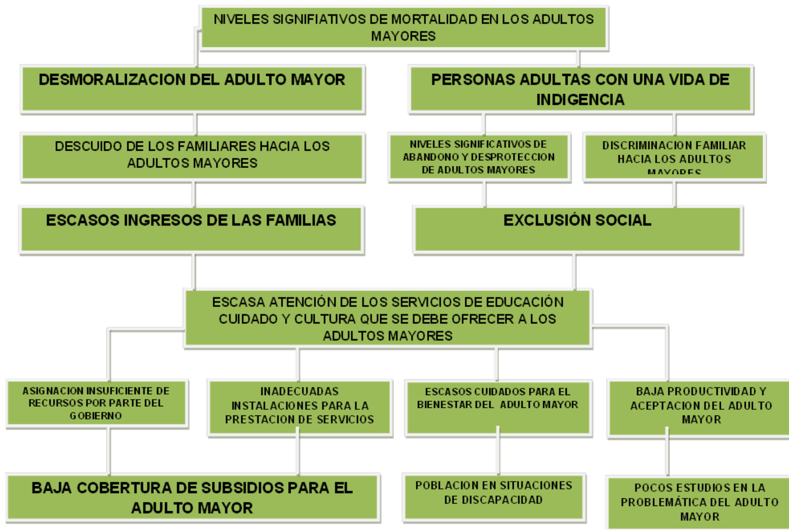
Grafico 2. Árbol de problemas